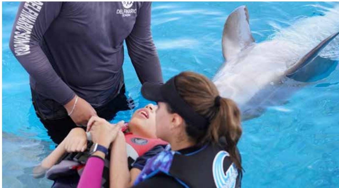
El Sistema DIF Cajeme anunció la apertura de la convocatoria para el programa 'Delfinoterapias 2026', mediante el cual se otorgarán 300 terapias gratuitas a beneficiarios del municipio.

Este programa de apoyo está dirigido a personas con diagnóstico de autismo, parálisis cerebral