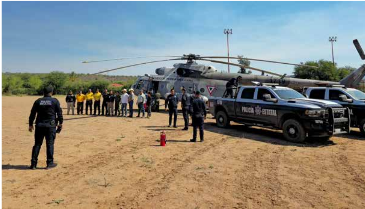
Los combatientes forestales han trabajado día y noche, reflejando el compromiso y la dedicación de las brigadas que diariamente enfrentan condiciones complejas para proteger los recursos naturales.

Los combatientes forestales han trabajado día y noche, reflejando el compromiso y la dedicación de las brigadas que diariamente enfrentan condiciones complejas