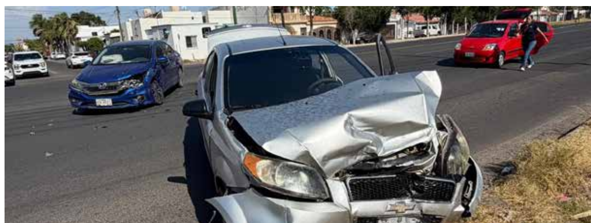
Lesiones que ameritaron su traslado a un hospital sufrió un conductor que, al no efectuar alto en calles Kino y Jesús García provocó aparatoso choque.