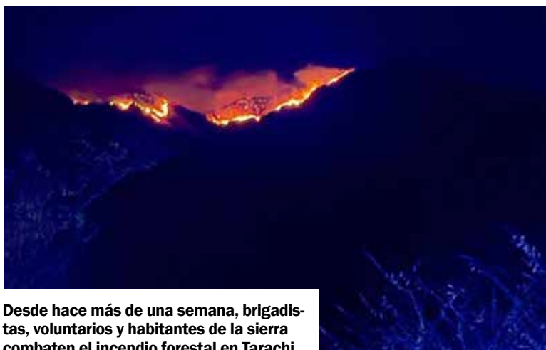
Desde hace más de una semana, brigadistas, voluntarios y habitantes de la sierra combaten el incendio forestal en Tarachi.

Ante esto se ha solicitado el apoyo para recolectar víveres: alimentos no perecederos, agua embotellada, botas de seguri-