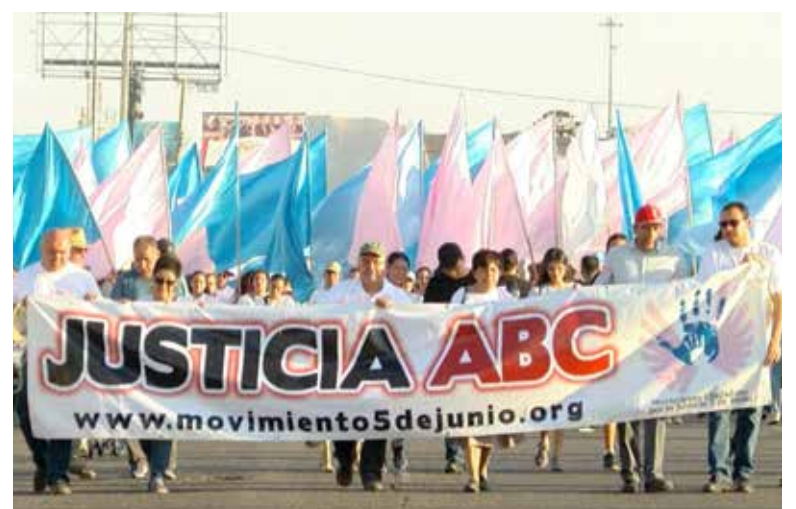
A 17 años de la tragedia ABC, familias siguen enfrentando impunidad y exigen justicia.

En cuanto al sexenio de Andrés Manuel López Obrador, reconoció mejoras sustanciales en la atención médica y los apoyos para las víctimas y sus familias, aunque lamentó que no se registraran avances relevantes en materia de justicia penal.