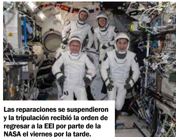
Las reparaciones se suspendieron y la tripulación recibió la orden de regresar a la EEI por parte de la NASA el viernes por la tarde.

No es la primera vez que la estación tiene que lidiar con este problema: las grietas responsables de