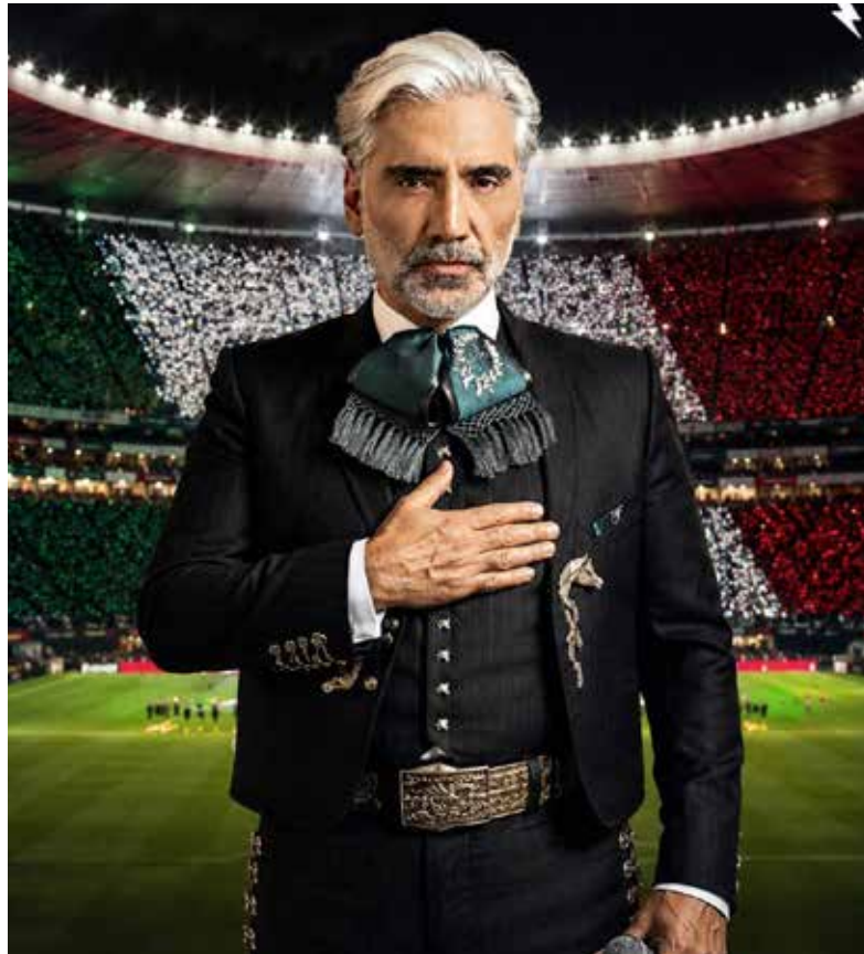
Alejandro Fernández representará a México durante la inauguración de la Copa del Mundo 2026 en el Estadio Azteca.

La transmisión televisiva y el espectáculo artístico de la ceremonia comenzarán exactamente 90 minutos antes del silbatazo inicial, el cual está programado para las 13:00 horas (tiempo del centro de México). La cobertura estará disponible completamente en vivo a través de los canales principales de televisión abierta en México (Televisa/TUDN y TV Azteca), además de plataformas oficiales de streaming. La noticia ha desatado una gran ola de orgullo nacional en las plataformas digitales. La participación del menor de la