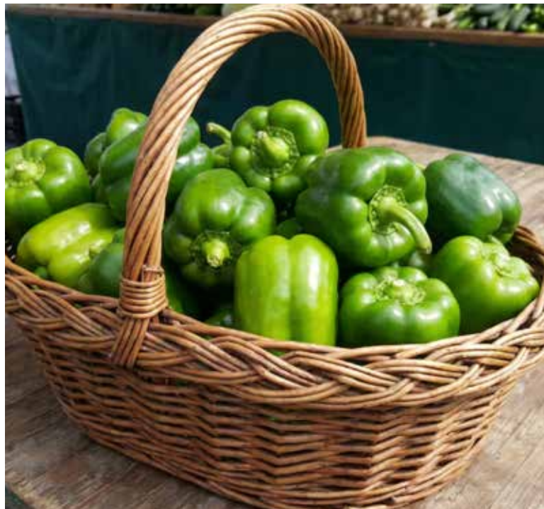
Consumido de forma regular, aporta nutrientes clave que favorecen la hidratación, la digestión y el bienestar general.

Esta variedad aporta beneficios significativos a la salud. Son bajos en calorías, ofrecen alrededor de 20 calorías por cada 100 gramos y contienen hasta 120 miligramos de vitamina C, una cantidad cercana al doble que la de una naranja. Además, suministran fibra y antioxidantes, que ayudan a proteger las células y a reducir el riesgo de diversas enfermedades.