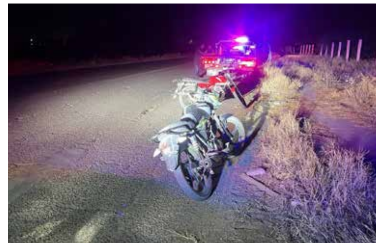
Un operativo de revisión implementado por autoridades sobre la calle 200, entre los fraccionamientos Urbi Villas del Rey y Villa del Real, dejó como saldo el aseguramiento de dos motocicletas.

Con este hecho, suman al menos tres muertes violentas en Hermosillo en un lapso menor a 10 horas.