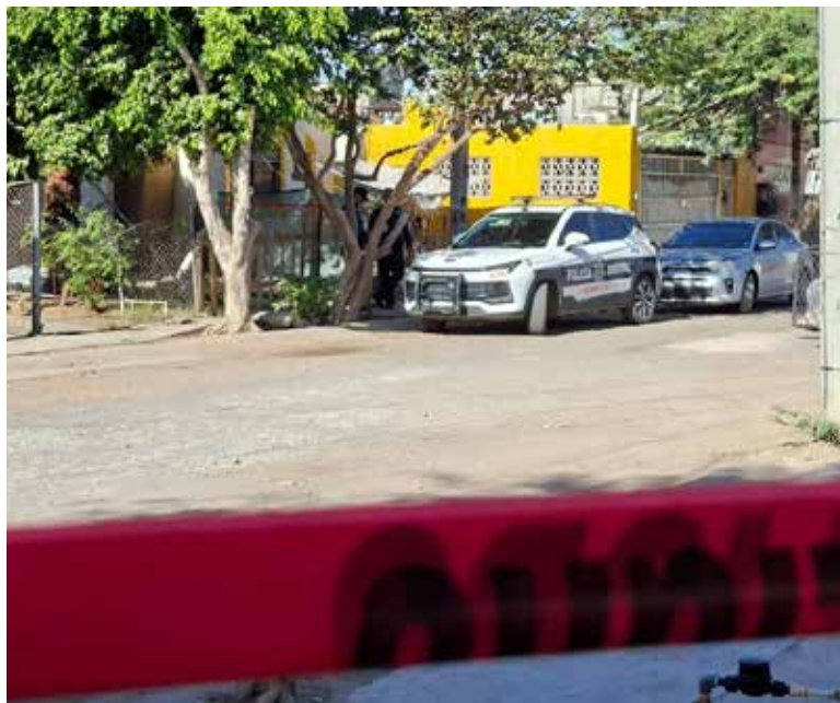
Un ataque armado registrado alrededor de las 07:00 horas de este viernes dejó como saldo una persona sin vida en la colonia San Bosco.

En la zona quedó bajo resguardo una vivienda marcada con el número 190, la cual, de acuerdo con información de vecinos, pre-