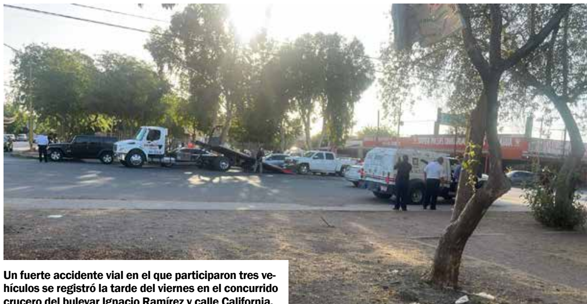
Un fuerte accidente vial en el que participaron tres vehículos se registró la tarde del viernes en el concurrido cruce del bulevar Ignacio Ramírez y calle California.