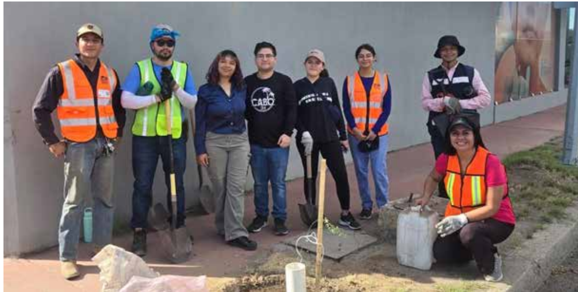
Plantan decenas de árboles para crear corredores de sombra en Hermosillo.