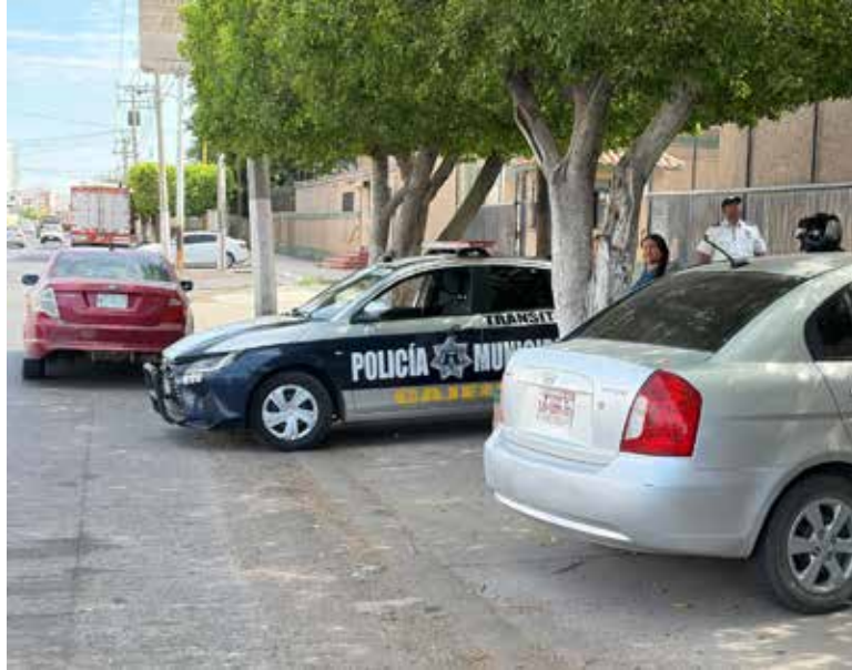
La falta de precaución en una intersección derivó en un fuerte impacto que terminó con una persona atendida por socorristas.

ba por la 200 de poniente a oriente y en el cruce con la Sufragio Efectivo vira hacia la izquierda para tomar hacia el norte y con esta maniobra cortó circulación a la motocicleta y se produjo la colisión.