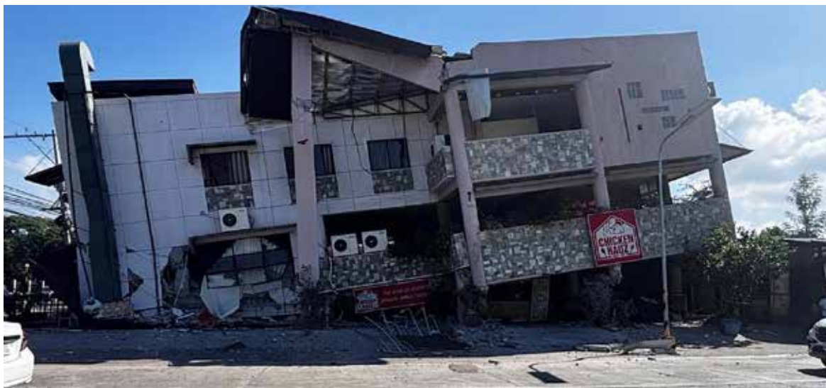
El terremoto que sacudió la isla de Mindanao ocurrió alrededor de las 7:37 am de este lunes y obligó a emitir alertas de tsunami en varios países de la región.

Mindanao es la segunda isla más grande de Filipinas —tanto en superficie como en pobla-