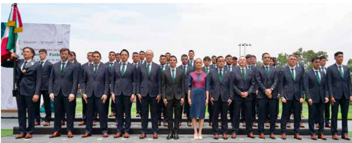
La presidenta Claudia Sheinbaum abanderó a la Selección Nacional de México que participará en la Copa Mundial de la FIFA 2026.