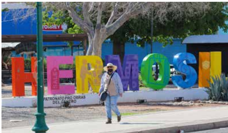
Seguirán temperaturas superiores a los 40 grados en Sonora: Conagua.

oriente, los valores máximos se ubicarán entre los 20 y 40 grados. En Hermosillo, este lunes se prevé una temperatura máxima de 42 grados centígrados, con posibilidad de alcanzar los 43 grados el martes. Los vientos serán de 10 a 20 kilómetros por hora, con rachas de hasta 40 kilómetros por hora”, declaró.