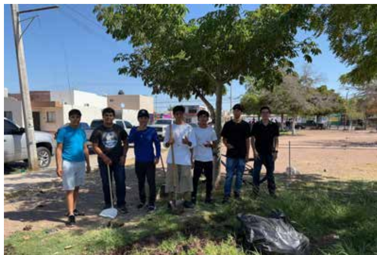
Estudiantes del CETis 69 llevaron a cabo la jornada 'DGETI en tu Comunidad'.

La institución destacó que este tipo de acciones permiten fortalecer valores como la responsabilidad, la solidaridad y