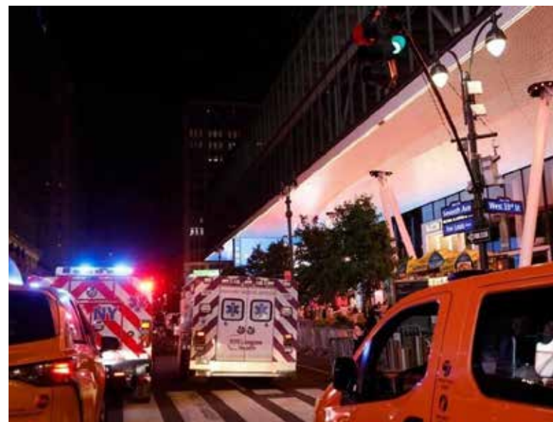
Todas las víctimas fueron trasladadas al Hospital Bellevue. Señaló también que el sospechoso está bajo custodia, sin dar más detalles.

La visita presidencial ya ha motivado un refuerzo de las medidas de seguridad alrededor del recinto y las manzanas aledañas, y se prevé una presencia considerable del Servicio Secreto, el Departamento de Policía de Nueva York y otras agencias para el evento, que será transmitido a nivel nacional.