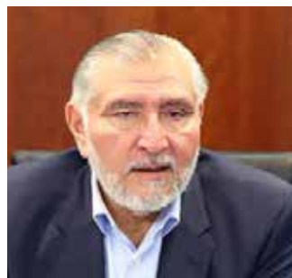
Adán Augusto Lopez