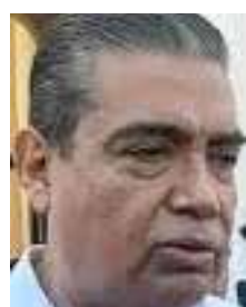
Gustavo Rómulo Salas

responsables individuales, la situación evidencia una falla operativa que debe ser atendida por el propio Fiscal del Estado, Gustavo Rómulo Salas Chávez, pues el acceso oportuno a la justicia constituye una obligación insti-