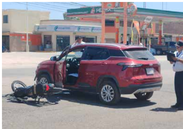
Una motocicleta y una camioneta colisionaron, dejando como saldo a un joven lesionado y daños materiales.

Fiscalía General de la República (FGR), autoridad que continuará con las diligencias derivadas de su captura.