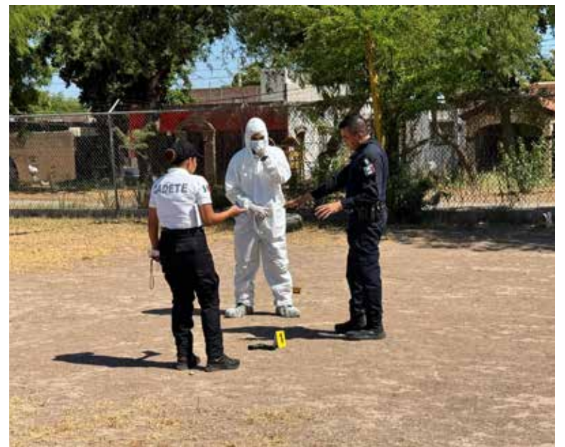
La Academia de Policía Municipal de Cajeme desarrolló prácticas de procesamiento de indicios a cadetes que cursan la materia “Primeros Pasos de la Investigación Policial”.

Asimismo, los futuros policías recibieron instrucción en la identificación de indicios, su documentación y el correcto llenado de la cadena de custodia, procedimientos fundamentales para asegurar la integridad de la evidencia y contribuir al desarrollo de una carpeta de investigación, lo cual permite que las y los cadetes comprendan la importancia de actuar bajo el mando y conducción del Ministerio Público, respetando en todo momento los principios legales y técnicos que rigen la investigación policial.