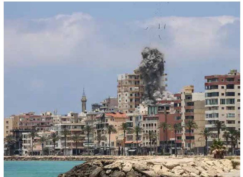
La nueva ofensiva se produce en medio del deterioro de la situación de seguridad entre Washington y Teherán tras varios días de intercambios militares.

Más temprano, el presidente de Estados Unidos, Donald Trump, anunció que Irán había derribado un helicóptero Apache en el estrecho de Ormuz y prometió