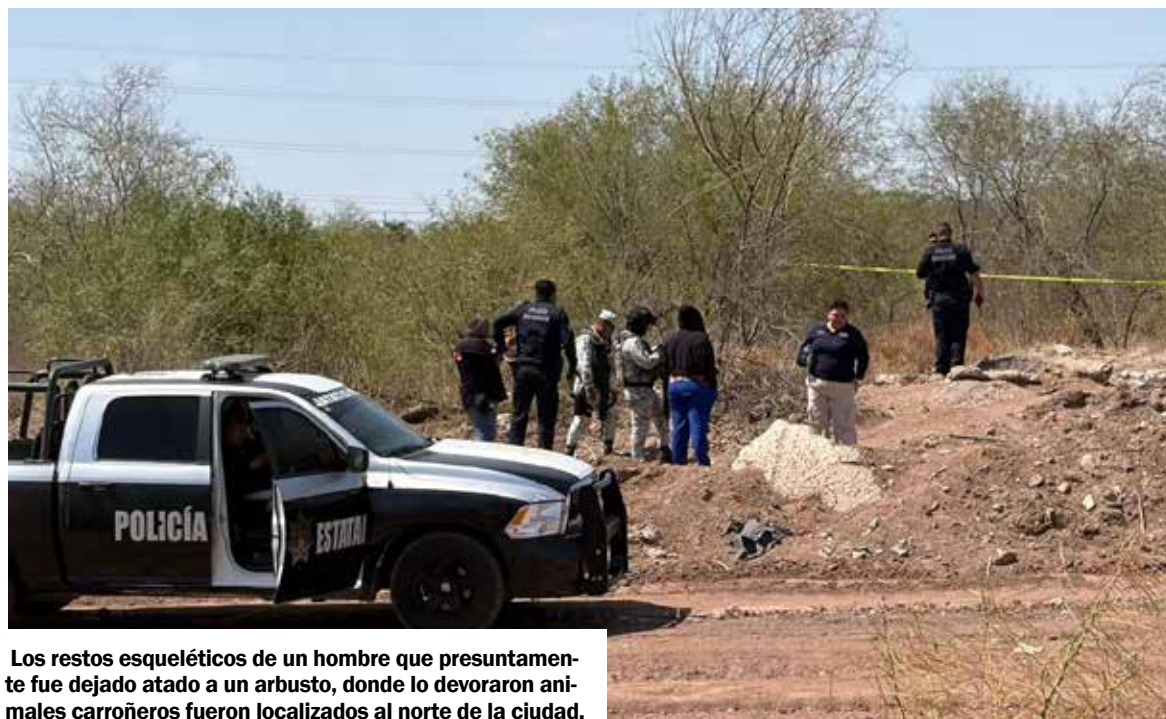
Los restos esqueléticos de un hombre que presuntamente fue dejado atado a un arbusto, donde lo devoraron animales carroñeros fueron localizados al norte de la ciudad.

Debido a que aún había abundantes manchas de grasa, se pre-