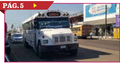
PÁG. 5 ▶ OPERA LA RUTA 6 CON TRES CAMIONES