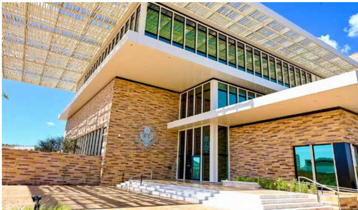
Nogales se consolida como uno de los consulados más ágiles para tramitar visas en México.

Ante este panorama, indicó que se implementó una estrategia de reorganización interna enfocada en optimizar procesos, mejorar la atención y agilizar las entrevistas consulares, todo ello