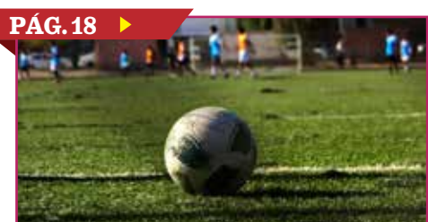
PÁG. 18 ▶ JÓVENES PARTICIPAN EN VISORÍAS DEL AMÉRICA