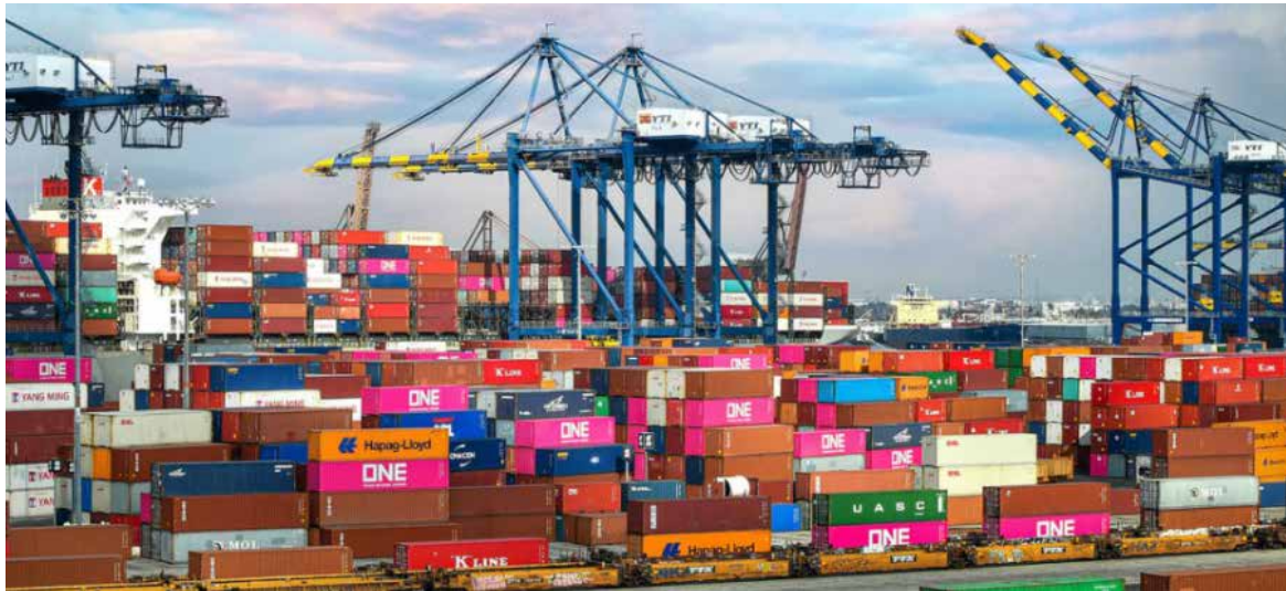
Las ventas mexicanas al mercado estadounidense alcanzan un nivel sin precedentes, pese a aranceles y tensiones comerciales.

De acuerdo con datos de la Oficina del Censo del Departamento de Comercio de Estados Unidos, la cifra representa un incremento de 20 por ciento frente a los 41 mil