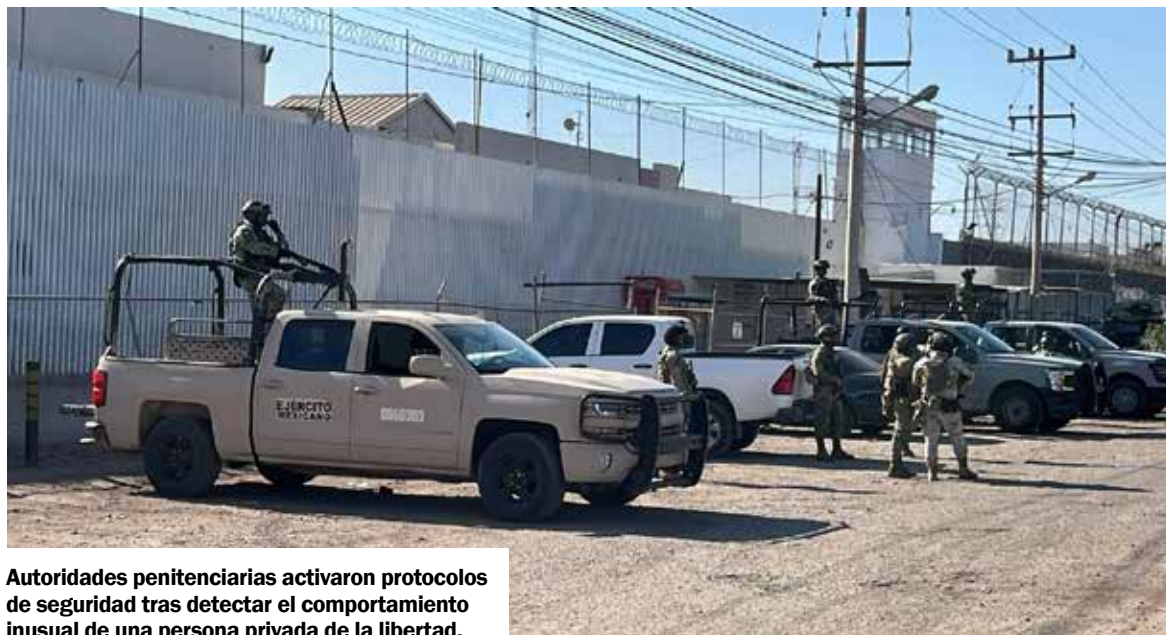
Autoridades penitenciarias activaron protocolos de seguridad tras detectar el comportamiento inusual de una persona privada de la libertad.

La movilización de custodios y personal de vigilancia sucedió aproximadamente a las 16:00 horas y generó expectativa entre