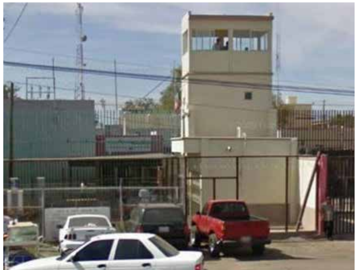
Al interior del Cereso de Ciudad Obregón se cuenta con siete grupos de Alcohólicos Anónimos a través de los cuales se lleva el programa de "Doce Pasos".

Agregó que el próximo mes de julio se llevará a cabo la Semana de la Persona Alcohólica Privada de la Libertad, con pláticas informativas para acercar el mensaje a las y los internos.