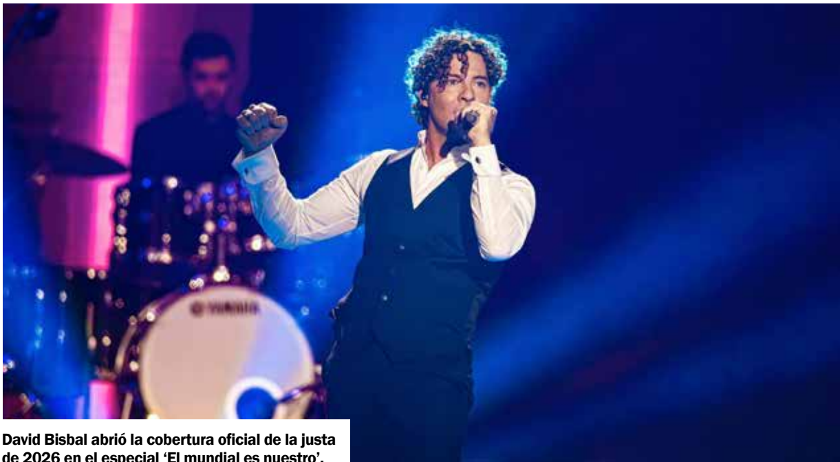
David Bisbal abrió la cobertura oficial de la justa de 2026 en el especial 'El mundial es nuestro'.