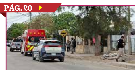
PÁG. 20 ▶ ATAQUE ARMADO DEJA DOS VÍCTIMAS

En abril de 2026 las exportaciones de México a Estados Unidos alcanzaron un nivel sin precedentes para un solo mes de 50 mil 691 millones de dólares, con lo que se mantiene como el principal socio comercial de la mayor potencia económica del mundo. »» PÁG. 16