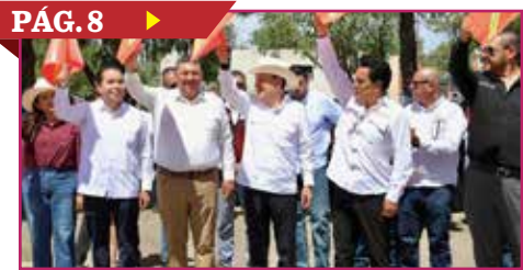
PÁG. 8 ▶ MODERNIZARÁN MÁS CARRETERAS