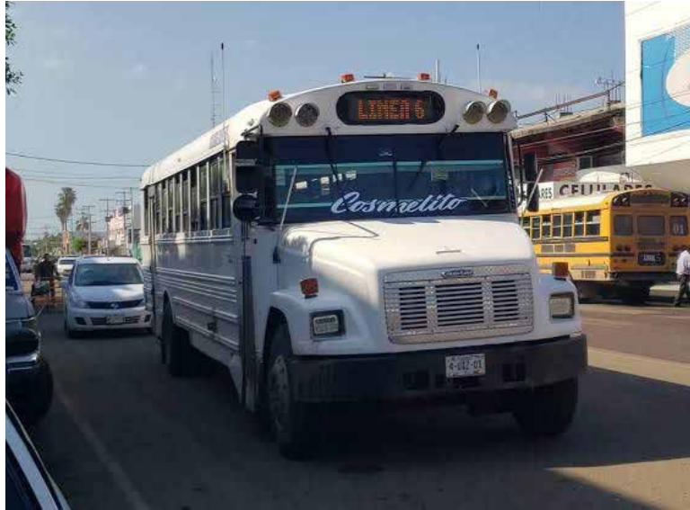
Trabajadores del Parque Industrial han solicitado que regrese la Línea 6 que cubría el horario de las 5:00 de la tarde en el Parque Industrial de Ciudad Obregón.

En el caso de esta ruta, dijo, sí se tiene el servicio, pero son