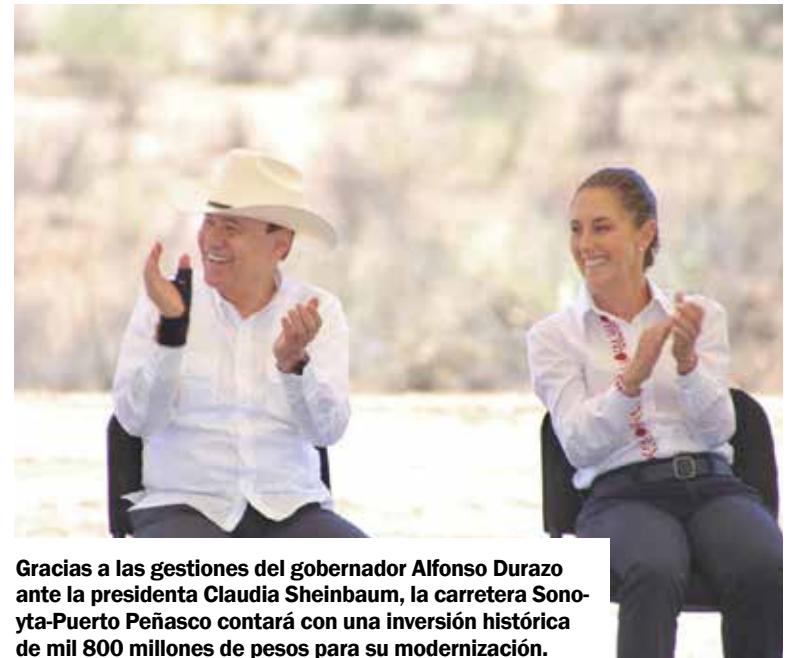
Gracias a las gestiones del gobernador Alfonso Durazo ante la presidenta Claudia Sheinbaum, la carretera Sonoyta-Puerto Peñasco contará con una inversión histórica de mil 800 millones de pesos para su modernización.