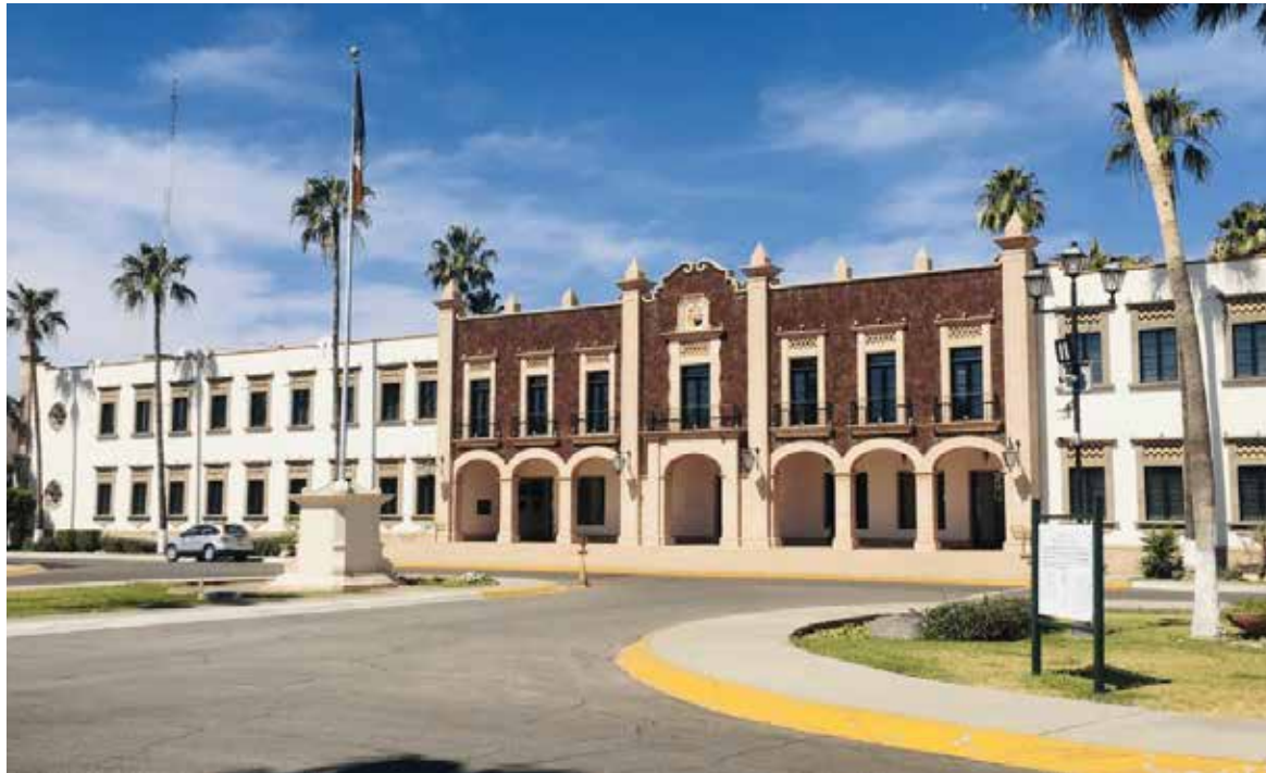
La Unison enfocará todos sus esfuerzos en restablecer las actividades y garantizar la continuidad de los procesos académicos para miles de estudiantes.

“Como parte de las negociaciones, la universidad presentó una propuesta que incluyó mejoras salariales, laborales y de seguridad social. Entre los acuerdos destacan un incremento directo