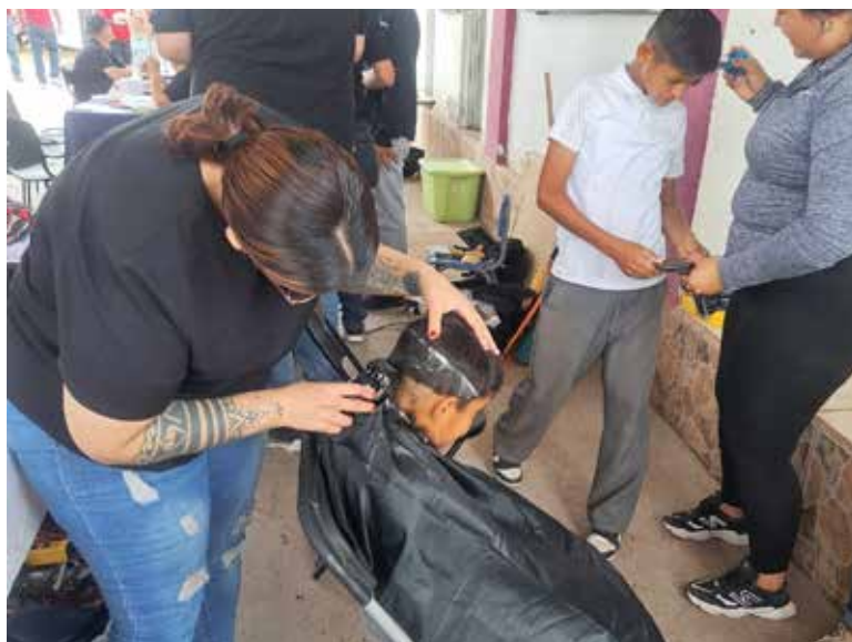
Con el objetivo de acercar servicios y programas a la población, se realizó una Feria de la Paz y una Jornada de Servicios en la comunidad de las Granjas MICA.

'Nosotros estamos desde el año pasado realizando actividades en conjunto con el estado, la federación y el municipio de Cajeme, llegando a diferentes polígonos. En esta ocasión terminamos las acciones en Pueblo Yaqui, Ciudad Obregón y algunas colonias,