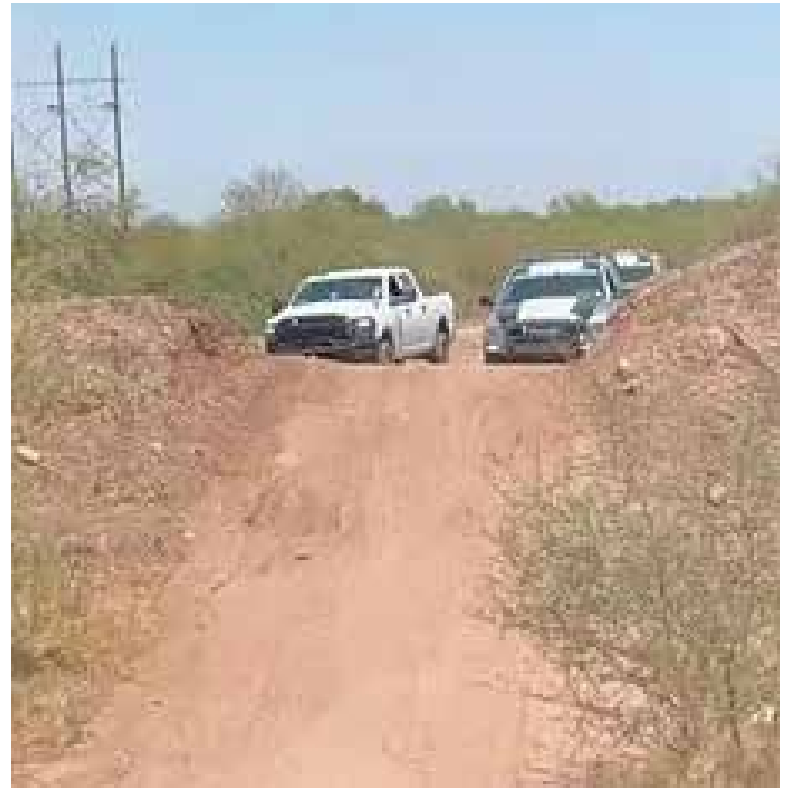
De un balazo en la nuca, una mujer fue privada de la vida la mañana del jueves, en el interior de su casa, en la colonia San Rafael.

Sin embargo, su actuar al igual que el de los policías fue muy sigiloso para evitar que trascendiera a los medios de comunicación.