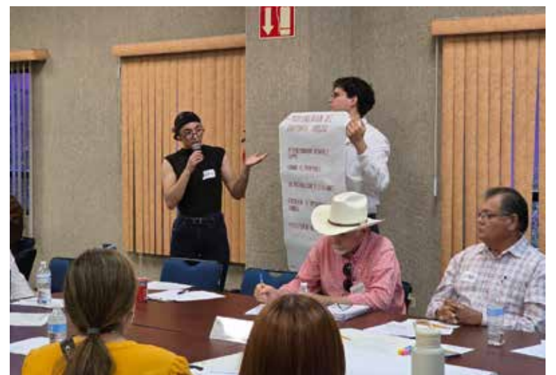
Se realizó en las instalaciones del Itson Náinari la primera sesión del taller y foro denominado ‘La Movilidad como Factor de Desarrollo en el Municipio de Cajeme’.

consulta se busca, entre otros objetivos, fomentar alternativas de transporte eficientes, seguros y sostenibles, además de reducir la dependencia del automóvil par-