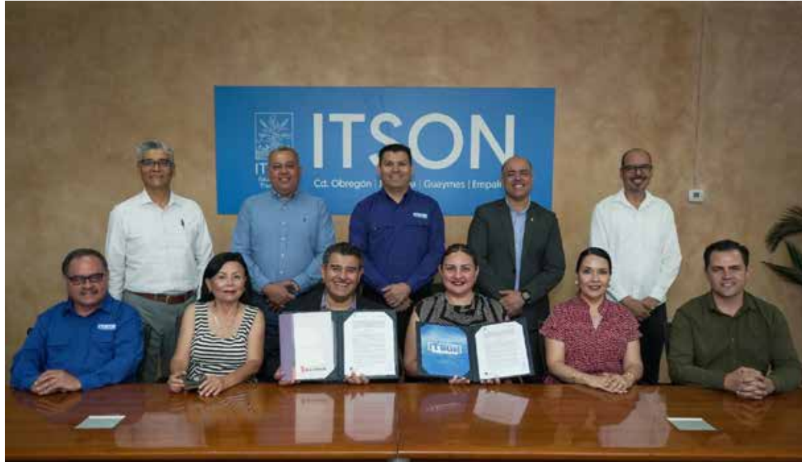
El Instituto Tecnológico de Sonora (Itson) y Bachoco, S.A. de C.V., firmaron un convenio general de colaboración que permitirá desarrollar programas y proyectos conjuntos en beneficio de la sociedad.

Asimismo, expresó su satisfacción por concretar esta alianza con una de las empresas más importantes del país y destacó las