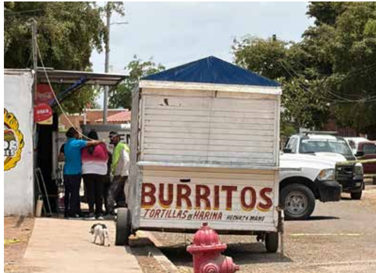
Autoridades procesaron la escena y aseguraron indicios balísticos tras el reporte en la colonia San Rafael.

Y hace cinco años igualmente asesinaron a un hijo frente a un negocio de caguamanta en calles Ramón Guzmán y Ro-