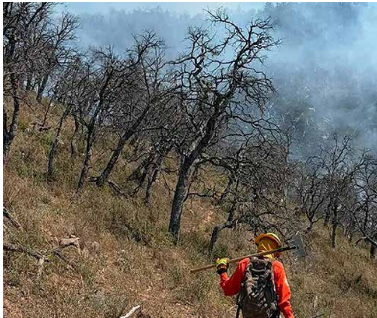
Más de 2 mil hectáreas consumió incendio en la Sierra de Sonora: CEPC.

‘Sí, bueno, ahorita ya está el 100% de liquidación, 100% de control. Fueron dos mil 90, si mi memoria no me falla, dos mil 80 hectáreas’, señaló.