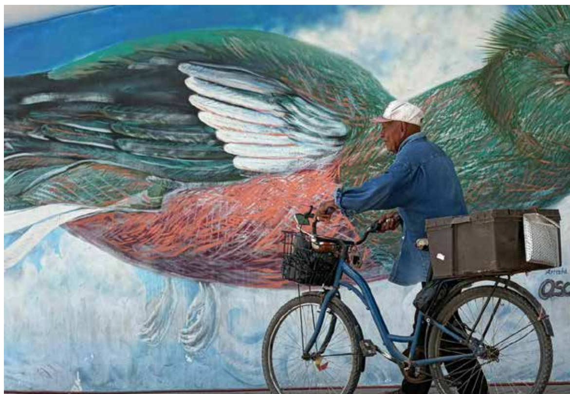
Artesanía yoreme, en riesgo por crisis ambiental.

“Habrá un efecto dominó. Los daños no se limitarían a Sinaloa; también impactarían a los artesa-