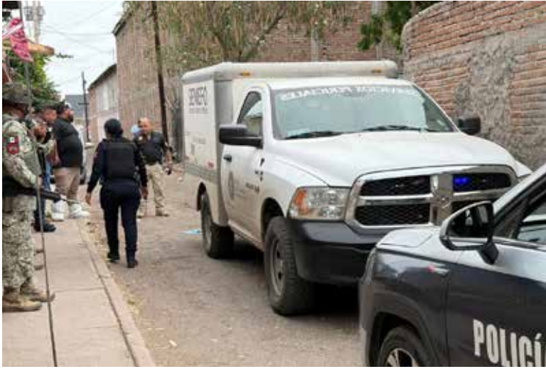
En avanzado estado de descomposición se localizó el cuerpo de un desconocido en un lote baldío bardeado en la colonia Hidalgo.