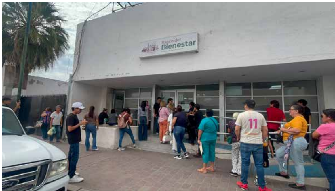
Beneficiarios de los programas sociales del Gobierno Federal han reportado dificultades para utilizar las tarjetas del Bienestar en diversos establecimientos de Hermosillo.

De acuerdo con testimonios de usuarios, las fallas se presentan con mayor frecuencia en negocios que operan con termina-