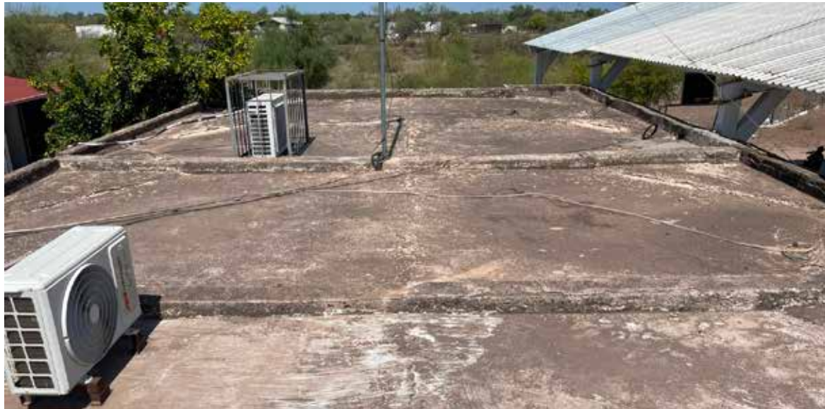
En riesgo de colapsar se encuentra el techo de las áreas de dirección, bodega y comedor estudiantil de la Escuela Primaria José María Pino Suárez.

El directivo señaló que solicitarán formalmente a la Secretaría de Educación y Cultura (SEC) de Sonora la reparación del inmueble, debido al avanzado deterioro