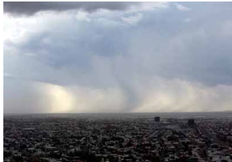
Lluvias ganarán fuerza en Sonora durante el fin de semana: Conagua.

Precisó que el pronóstico apunta a un fin de semana con preci-