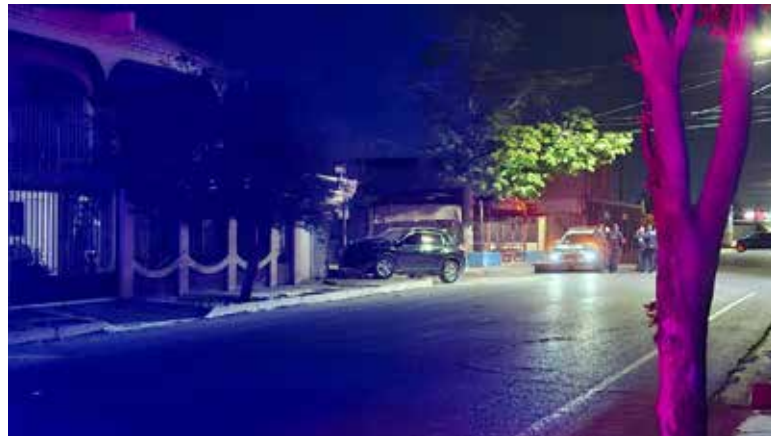
Autoridades aseguraron armamento y detuvieron a dos personas luego de un despliegue que se extendió por varias colonias.

H ermosillo. Una noche marcada por detonaciones, reportes cruzados y una persecución que se extendió por varias calles de la colonia Sahuaro terminó con la detención de dos jóvenes en posesión de armas de uso exclusivo del Ejército.