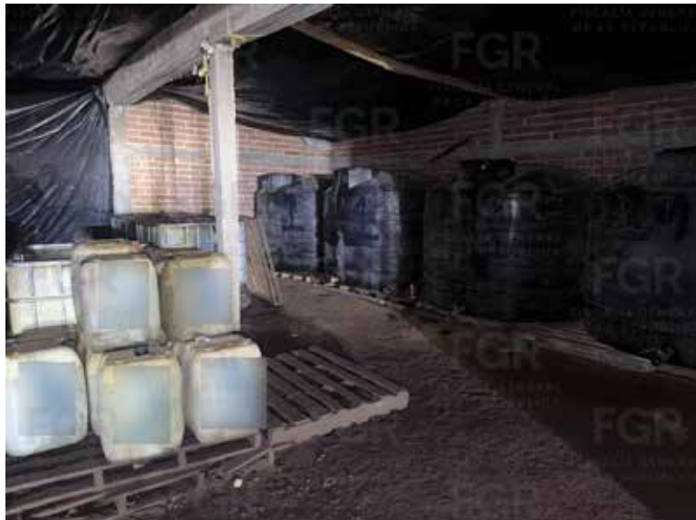
La Fiscalía General de la República (FGR) aseguró aproximadamente 23 mil litros de hidrocarburos, dos mangueras de presión, dos vehículos, diversos bidones y tambos de plástico.

La inspección judicial fue cumplimentada por el agente del Ministerio Público Federal (MPF), adscrito a la Fiscalía Especializada