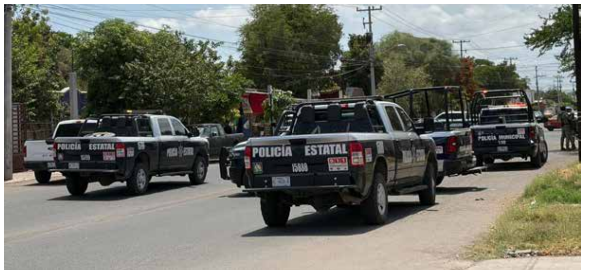
De un balazo en costado izquierdo fue lesionado un adolescente en una privada de la Rincón del Valle, luego de que le dispararon desde el techo de una casa de la Nueva Palmira.

rial de Investigación Criminal se hicieron cargo de las indagaciones.