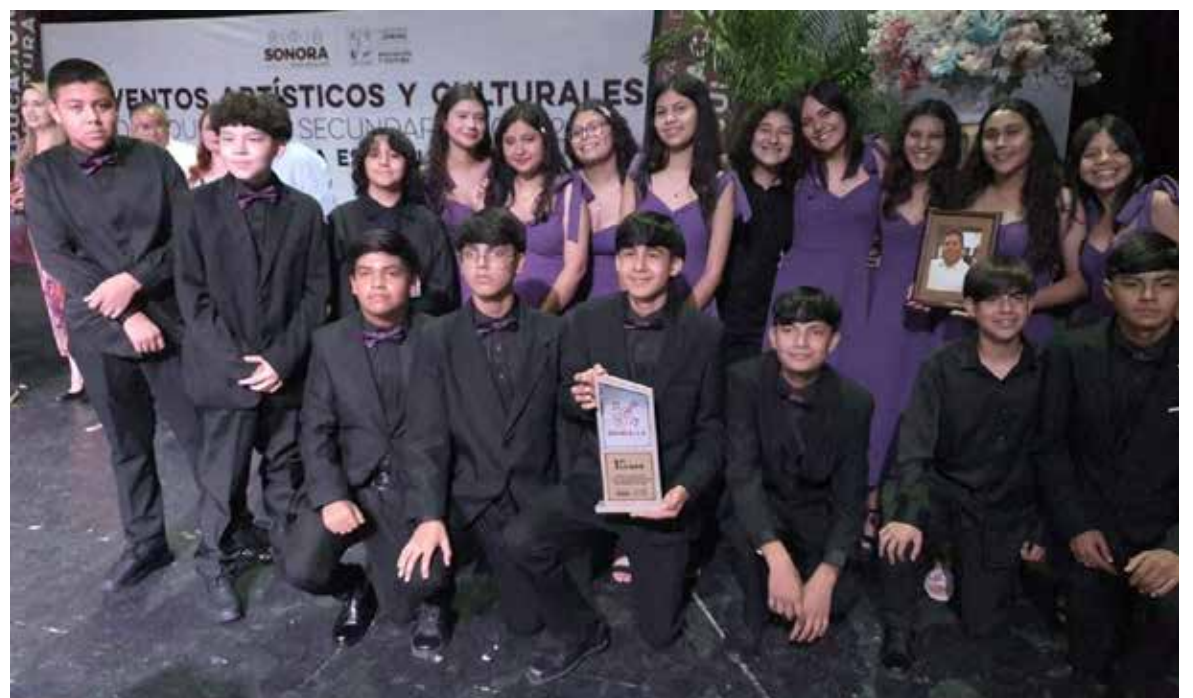
Rondalla de la Secundaria General No. 2 conquista tetracampeonato estatal.

la delegación de la Secundaria General No. 2 destacó en la disciplina de danza contemporánea, donde obtuvo el tercer lugar estatal, demostrando el talento artís-