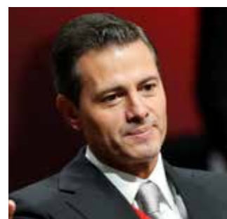
Enrique Peña Nieto