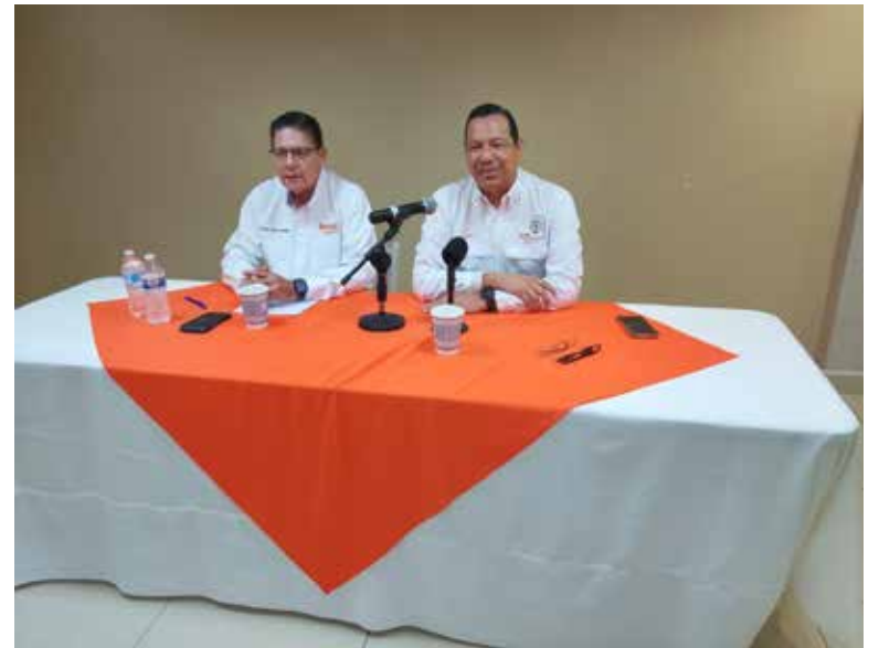
SNTE Sonora respalda diálogo con Federación y rechaza protestas que afecten a terceros.

El dirigente sindical sostuvo que los resultados alcanzados demuestran que el diálogo institucional y la negociación responsable pueden generar beneficios concretos para los trabajadores sin recurrir a movilizaciones que afecten a la ciudadanía.