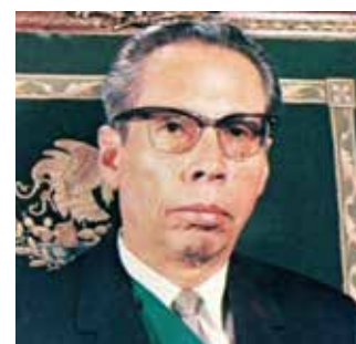
Gustavo Díaz Ordaz

Y vaya que en la semana se abrió la llamada válvula de escape, pues la olla sí que estuvo a máxima temperatura.