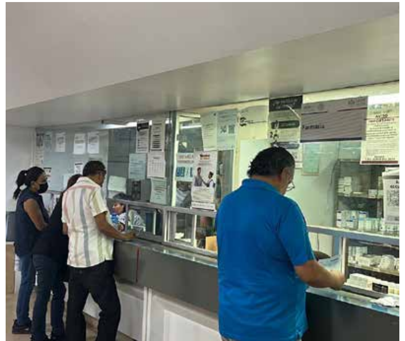
El segundo piso de la Clínica Hospital del Issste que desde hace años se encuentra como bodega, podría ser rehabilitada para servicios de hospitalización y especialidades médicas.

Agregó que se desconocen los motivos de que este piso quedara abandonado para ser convertido en bodega, sin embargo, existe la necesidad de ampliar la clínica a un hospital central.