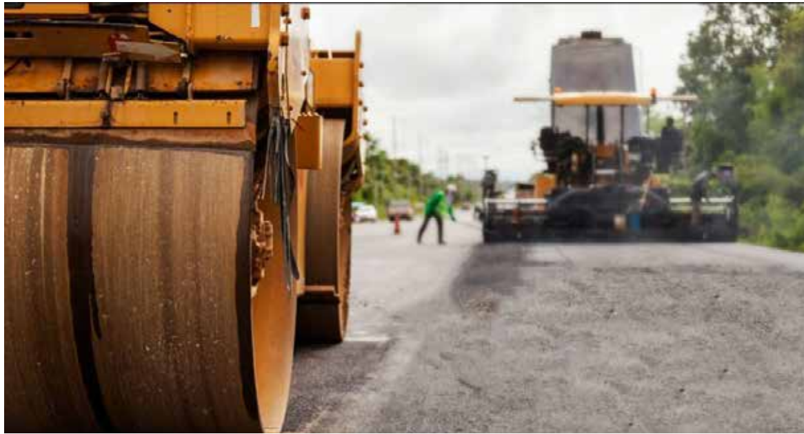
Avanza al 35% rehabilitación de la carretera al aeropuerto con meta para octubre.

Indicó que se trata de una de las vialidades con mayor circulación vehicular de la región, debido a su conexión con el