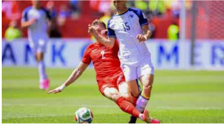
El cuadro anfitrión vino de atrás para sumar unidades en un encuentro disputado hasta el último minuto.

tes del descanso y al minuto 32 estuvo cerca de conseguirlo. Tani Oluwaseyi recibió dentro del área y sacó un potente disparo, pero el balón se fue por encima del travesaño. Con la ventaja mínima para Bosnia, ambos equipos se marcharon al medio tiempo.