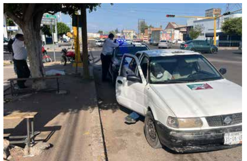
Un motociclista resultó lesionado la tarde del viernes luego de verse involucrado en un accidente de tránsito registrado en el transitado cruce-ro de las calles Jalisco y No Reelección.

Será la autoridad correspondiente la encargada de deslindar responsabilidades y establecer cómo ocurrió el accidente que por varios minutos generó expectación entre automovilistas y peatones que transitaban por el