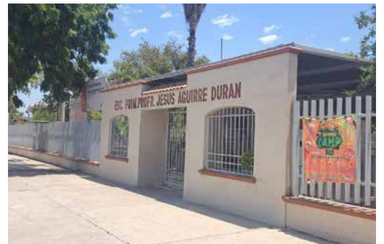
Ante las altas temperaturas que se han registrado en la región, la Escuela Primaria Jesús Aguirre Durán suspenderá actividades que impliquen permanecer al aire libre.