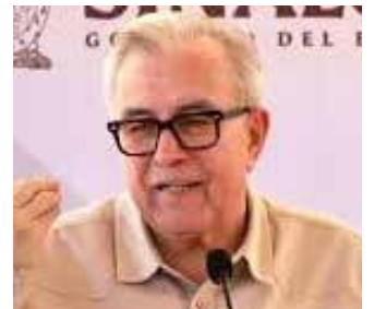
Rubén Rocha Moya

Muy preocupante el anuncio que hizo hace unas horas el presidente de los Estados Unidos DONALD TRUMP, donde dijo que si México sigue protegiendo a sus 'manzanas podridas' y no hace la tarea que le corresponde en el combate al narcotráfico, por un lado vendrán agentes de ese país a hacerles tarea y por el otro, se podrán súper estrictos con el envío de remesas a nuestro país que ascienden a más o menos a 60 mil millones de pesos anuales, que benefician a decenas de miles de familias mexicanas en la compra de alimentos, ropa, calzado, pago de servicios y hasta construcción de viviendas y compra de vehículos, por lo que les afectaría grandemente, solo porque el gobierno de Morena no quiere aflojar. En una palabra, esas remesas le dan una bocanada de oxígeno a la economía mexicana, muy golpeada en los últimos años, sobre todo en varios estados del sureste mexicano. En una mesa de reflexiones que escuchábamos de un trabaquito de analistas de primer nivel, de parte del Atypical TEVE, encabezado por puros caballones como CARLOS ALAZRAKI, BEATRIZ PAGUES, JAVIER LOZANO, MANUEL LÓPEZ SAN MARTÍN, enlazados con el corresponsal en Washington ARMANDO GUZMÁN, nos dejaron con los ojos cuadrados, sobre las posibilidades de que a México le pasen cosas malas próximamente en torno a la relación con el vecino país, si México sigue empeñado en proteger a sus narco políticos como: ADÁN AUGUSTO LÓPEZ HERNÁNDEZ, RUBÉN ROCHA MOYA, ENRIQUE INZUNZA y seis más, que ya cuentan con órdenes