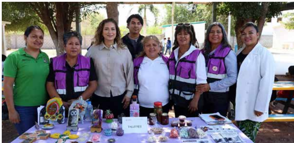
La Secretaria de las Mujeres de Cajeme, continúa con el programa de ‘La Ruta de las Mujeres’ en delegaciones y comisarías.

La Ruta de las Mujeres a visitado comunidades como Colonia Rosales, Campo 2 y Estación Corral, entre otras, como parte de la estrategia de fortalecimiento integral impulsada por las diversas dependencias del Ayuntamiento de Cajeme.