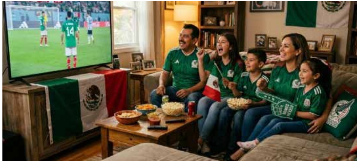
Estimaciones señalan que la derrama será moderada, debido al bajo dinamismo y a factores estructurales que frenan el crecimiento.

beneficio económico para el país provenga del aumento del turismo asociado a la justa deportiva, que se celebrará de manera conjunta entre México, Estados Unidos y Canadá. Sin embargo, el