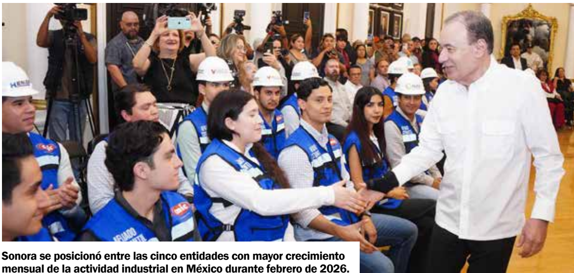
Sonora se posicionó entre las cinco entidades con mayor crecimiento mensual de la actividad industrial en México durante febrero de 2026.