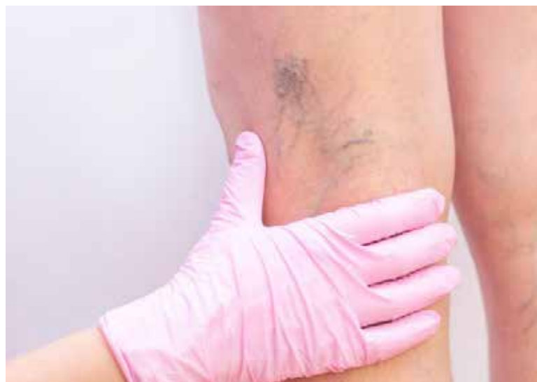
Especialistas advierten que las várices pueden provocar dolor, hinchazón y complicaciones graves si no se atienden a tiempo.

graves, como la trombosis. La evolución natural de las varices puede desencadenar daños progresivos en la piel, aparición de úlceras crónicas y un grado de incapacidad comparable al de una insuficiencia cardíaca congestiva.