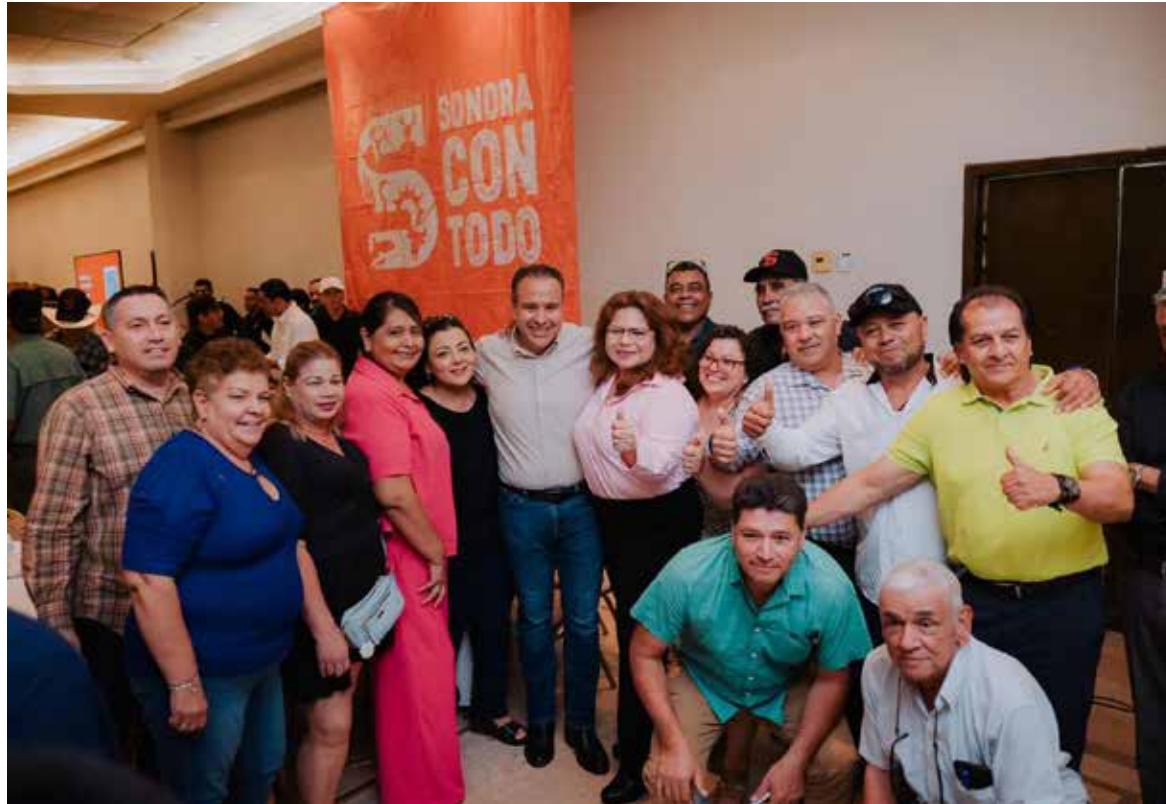
El alcalde de Hermosillo, Antonio 'Toño' Astiazarán Gutiérrez respondió a la invitación del colectivo de asociaciones civiles Sonora con Todo al reunirse con ciudadanos del municipio de Cajeme.

Ante cientos de personas que se dieron cita en el Centro Mag-