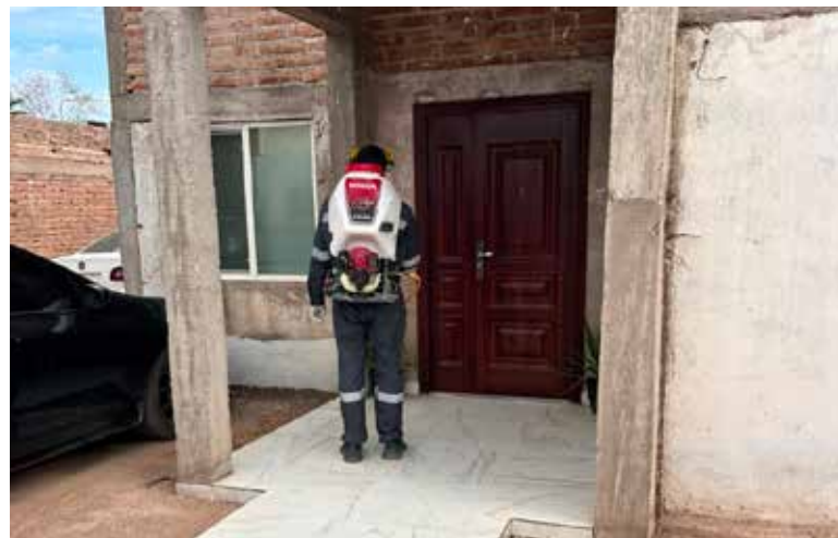
El Gobierno de Sonora, a través de la Secretaría de Salud Pública (SSP), mantiene acciones permanentes para prevenir la rickettsia, una enfermedad grave transmitida por la picadura de garrapatas infectadas.

La SSP recomienda mantener patios y viviendas limpios, evitar la acumulación de objetos donde puedan esconderse las garrapatas, revisar periódicamente a las mascotas y acudir de inmediato a una unidad de salud ante síntomas como fiebre, dolor de cabeza intenso o malestar general.