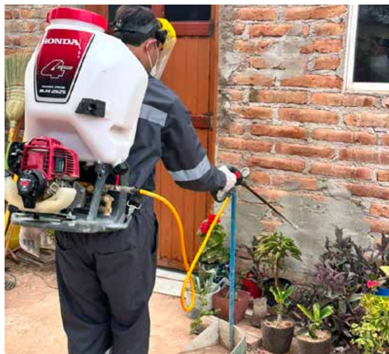
La prevención y la atención oportuna son fundamentales para evitar complicaciones por esta enfermedad.