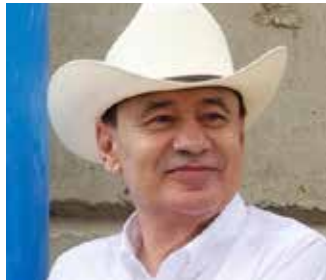
Alfonso Durazo Montaña