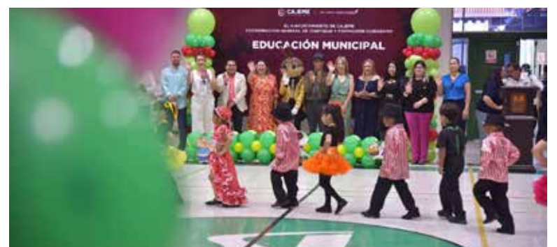
Una vez que concluya el ciclo escolar 2025-2026, el Ayuntamiento de Cajeme, a través de Educación Municipal y el Instituto Municipal de Cultura, pondrá en marcha los tradicionales campamentos de verano dirigidos a niños.