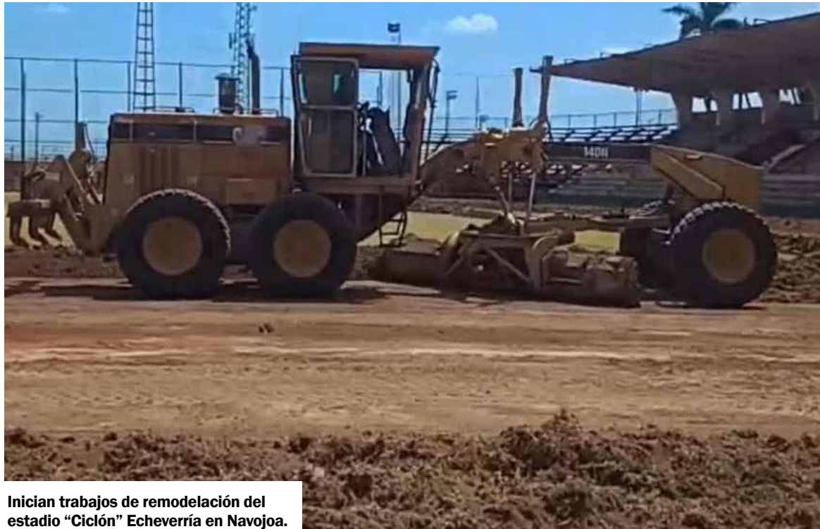
Inician trabajos de remodelación del estadio “Ciclón” Echeverría en Navojoa.

Con la presencia de maquinaria y personal en el inmueble, arrancó la obra que busca modernizar uno de los escenarios deportivos más representativos del sur de Sonora. Este proyecto contempla una renovación integral del estadio, con el propósito de ofrecer mejores condiciones tanto