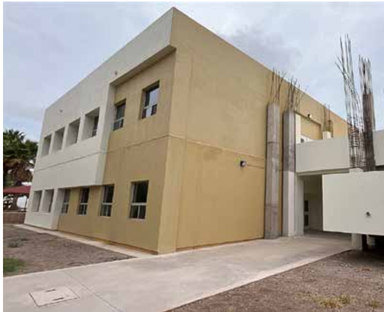
El próximo semestre iniciará operaciones el nuevo edificio en la Unison extensión Cajeme.

Mencionó que el proyecto de este edificio contempla un tercer piso; sin embargo, por el momento se deberán retomar las gestiones para obtener recursos y continuar con la ampliación.