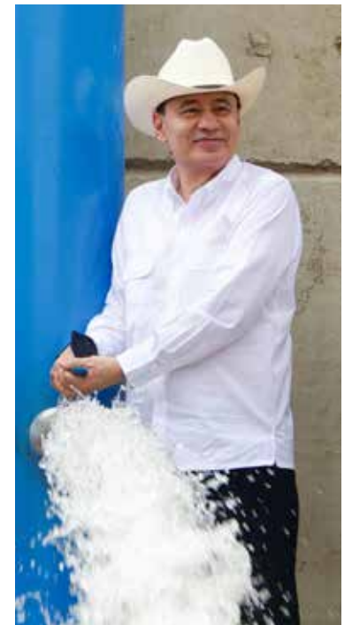
El gobernador Alfonso Durazo Montañó ha impulsado la mayor inversión en infraestructura hídrica en la historia reciente de Sonora, con un monto total de mil 308.8 millones de pesos respaldado por el Gobierno de México

litros por segundo adicionales al suministro de la capital, fortaleciendo la disponibilidad de agua para miles de familias hermosillenses.