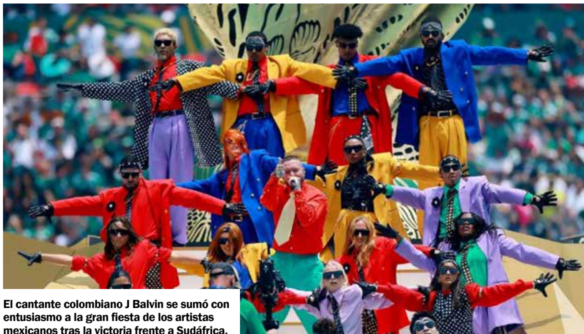
El cantante colombiano J Balvin se sumó con entusiasmo a la gran fiesta de los artistas mexicanos tras la victoria frente a Sudáfrica.

Para rematar una jornada perfecta, el cariño internacional se hizo presente gracias a Shakira. La estrella colombiana utilizó su cuenta oficial de Instagram para enviar un emotivo mensaje que conmovió a sus fanáticos: "Felicidades México, estoy muy feliz por mi familia mexicana en este día inolvidable", consolidando así un día donde la música y el fútbol se unieron en una sola voz de victoria.