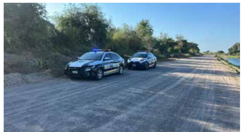
Una mujer resultó lesionada luego de que el vehículo que conducía terminara volcado al interior del Canal Alto, a la altura del Paseo El Chorro.

Paramédicos de Cruz Roja atendieron a la mujer en el sitio y posteriormente la trasladaron a un hospital para una valoración mé-