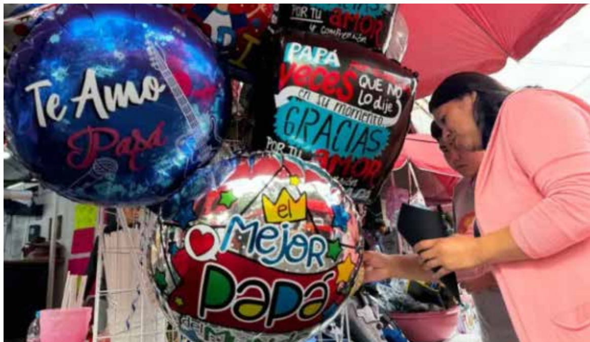
Restaurantes, tiendas de ropa, calzado y electrónicos se verán entre los principales beneficiados por el incremento en el gasto familiar.

El organismo del sector privado indicó que este festejo se coloca como una de las fechas de mayor impacto para el comercio, los servicios y el turismo en México, pues se beneficiarán cerca de 3.6 millones de unidades económicas del sector, en particular, res-