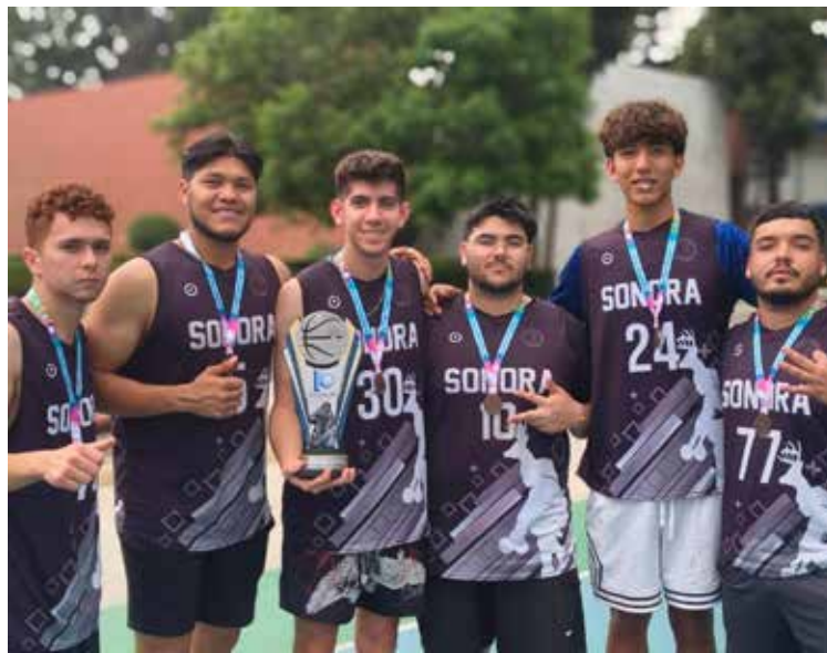
Con un marcador ajustado de 50-48, el conjunto sonorense aseguró su lugar entre los mejores del certamen.