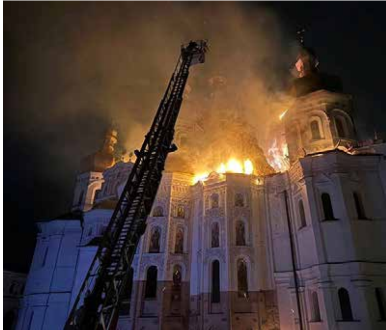
El Servicio Estatal de Emergencias indicó que las llamas afectaron a la catedral de la Dormición y alrededor de 800 metros cuadrados del techo del inmueble.

Las autoridades ucranianas reportaron un incendio en la catedral de la Dormición, uno de los prin-