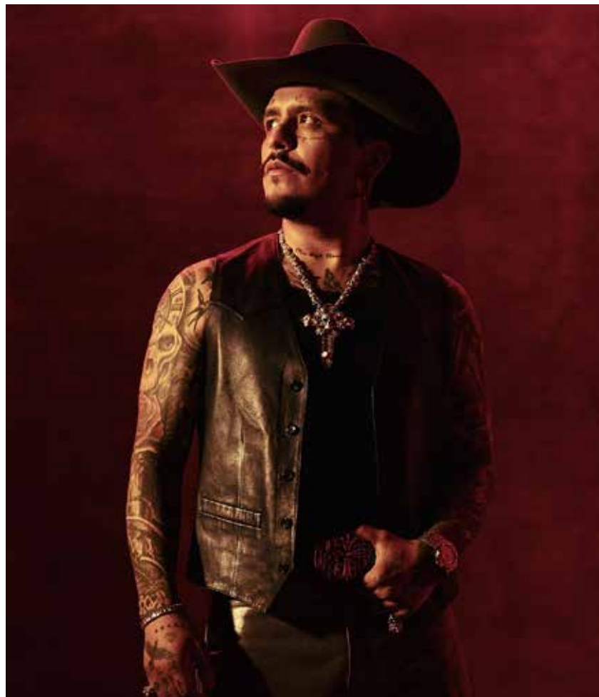
Christian Nodal enfrenta una de las peores crisis de su carrera al topar con pared en el IMPI por los derechos de "El Forajido".

Para los veteranos músicos, la polémica movida del solista genera una confusión fonética y gráfica evidente ante el público cibernético y el mercado musical. El argumento legal presentado ante el IMPI es contundente: el simple hecho de añadir el artículo "El" no aporta una distinción suficiente frente a los derechos de marca que ellos ostentan legítimamente y cuya vigencia exclusiva en el territorio nacional está asegurada al