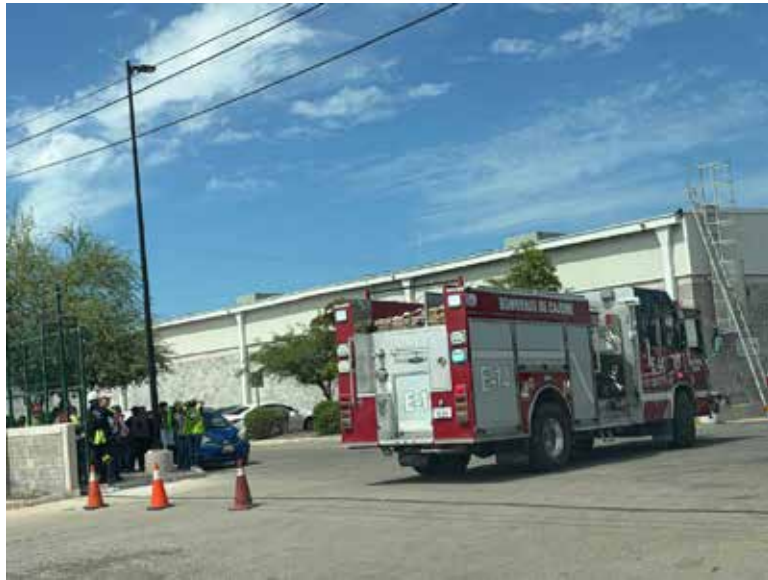
La rápida reacción del personal evitó que el fuego se propagara dentro del establecimiento ubicado en el sur de Ciudad Obregón.

El jefe Bomberos, explicó que, si hubo fuego y que este perforó la lámina del techo, pero gracias a que empleados hicieron frente a las llamas de esta manera las contuvieron.