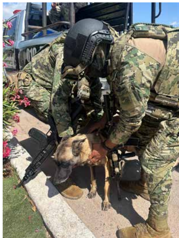
La SSPM trabaja con la visión de ofrecerle una vida digna y una recuperación integral.

La SSPM trabaja con la visión de ofrecerle una vida digna y una recuperación integral. Una vez que su estado de salud sea óptimo, se contempla que reciba adiestramiento especializado con apoyo de la Secretaría de Marina, con el propósito de que pueda convertirse en un