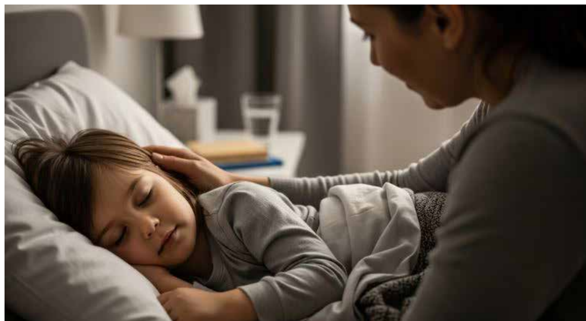
Dolores de crecimiento: cuándo son normales y qué señales requieren atención médica.

Sin embargo, uno de los rasgos más característicos es que el dolor desaparece por la mañana y el menor continúa sus actividades normales sin dificultad para ca-