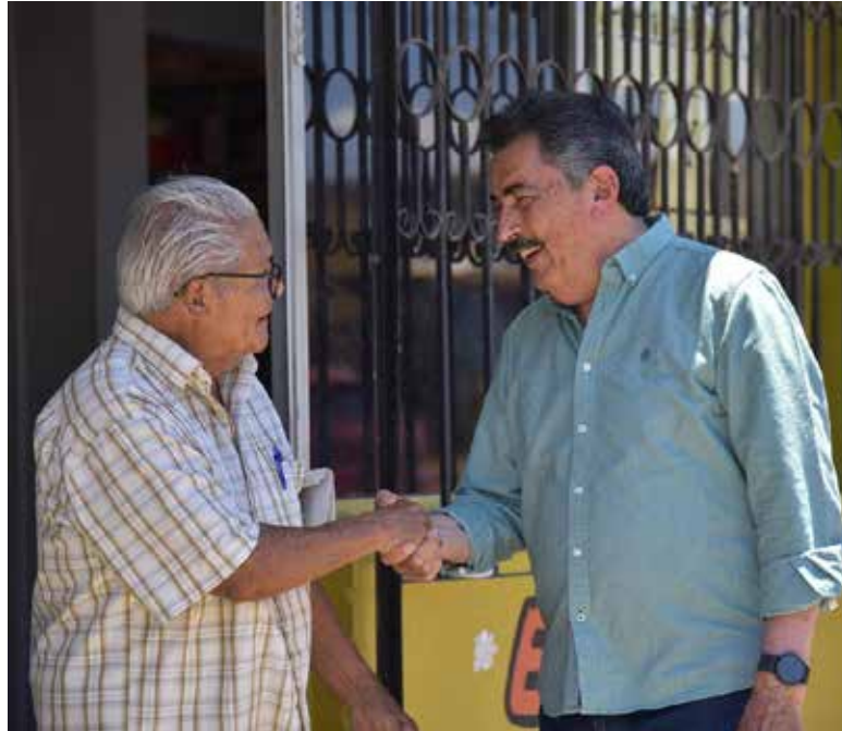
El Gobierno Municipal continúa intensificando los trabajos de recarpeteo en distintos sectores de Ciudad Obregón, alcanzando ya más de 30 mil metros cuadrados de calles rehabilitadas.

Durante un recorrido al sur del municipio, el alcalde visitó donde actualmente se trabaja sobre la calle Agustín Melgar, desde el tramo de la California hasta la avenida Ramón Guzmán, destacando que estos avances han sido posibles gracias a la incorporación de una nueva máquina pa-