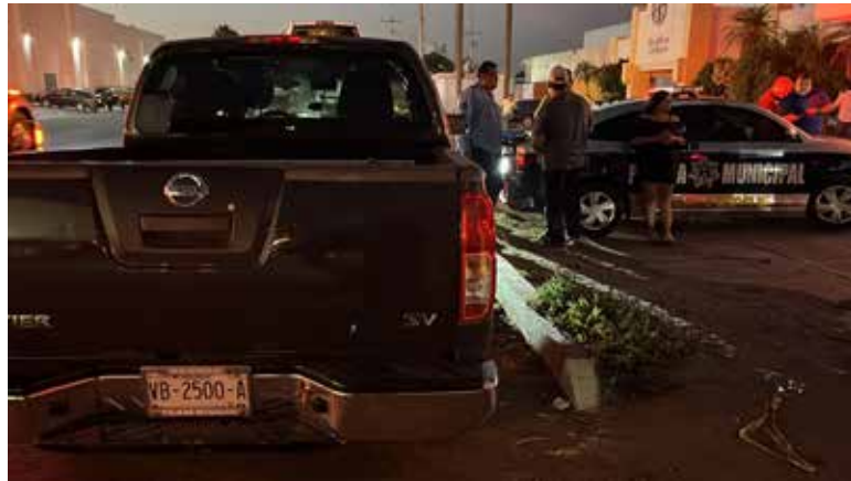
El percance involucró a cuatro unidades, generando momentos de tensión entre automovilistas y peatones que se encontraban en la zona.

De acuerdo con los primeros reportes, el percance involucró a cuatro unidades, generando momentos de tensión entre automovilistas y peatones que se encontraban en la zona. Tras el fuerte impacto, dos mujeres y una menor de edad sufrieron diversas lesiones, por lo que fue