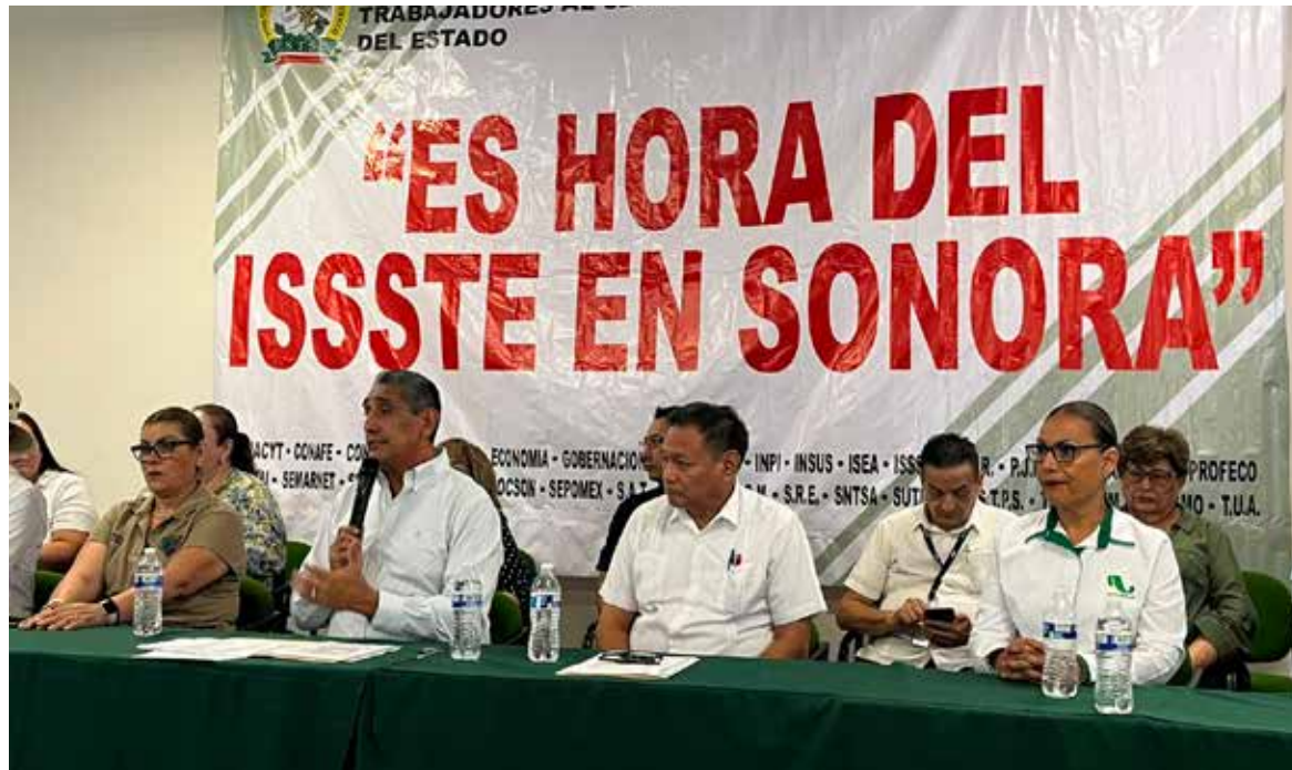
Sindicatos exigen atención inmediata ante crisis del Issste en Sonora.

Los dirigentes sindicales señalaron que las deficiencias en infraestructura, la falta de mantenimiento y las constantes fallas en el sistema de refrigeración han generado condiciones adversas tanto para pacientes como para