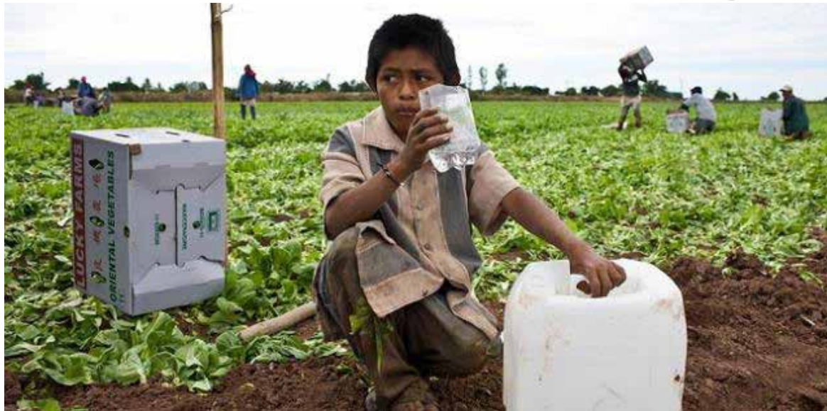
Más de 70 mil menores trabajan en condiciones de riesgo en Sonora: FNGS.

La especialista señaló que, de acuerdo con datos de la Encuesta Nacional de Trabajo Infantil 2022 del Instituto Nacional de Estadística y Geografía (INEGI), en Sonora se contabilizaron 70 mil 840 menores de edad realizando actividades consideradas de riesgo, una cifra que refleja la necesidad de fortalecer las acciones de protección y preven-