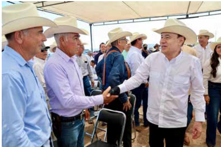
El gobernador Alfonso Durazo destacó que el Centro Integral Ganadero permitirá elevar la capacidad operativa, reducir costos de producción y generar mayor valor agregado para el sector pecuario del estado.

El jefe del Ejecutivo estatal, acompañado de Juan Ochoa, presidente de la UGRS, enfatizó que el proyec-