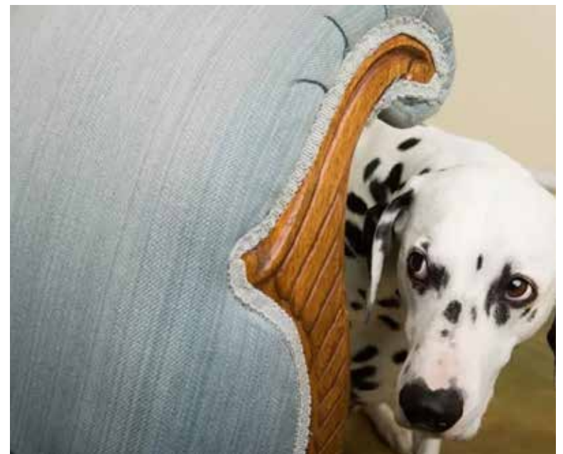
Llaman activistas a proteger a mascotas y animales en situación de calle durante temporada de lluvias.

Finalmente, la activista destacó, la importancia de instalar casitas o habilitar espacios seguros en cocheras y patios para protegerlos del clima y reducir los riesgos para su salud y bienestar.