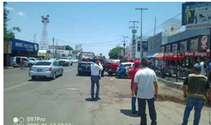
Un cortocircuito en un centro de carga ubicado en Sinaloa y Galeana dejó gran parte del primer cuadro de la ciudad sin energía eléctrica movilizándose cuerpos de emergencia.