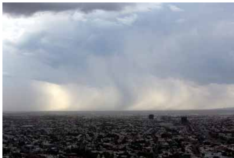
El Gobierno de Sonora, a través de la Coordinación Estatal de Protección Civil (CEPC), informa que el monzón mexicano continuará favoreciendo la presencia de tormentas vespertinas en distintos puntos del estado.

La presencia del monzón mexicano, fenómeno característico de la temporada de verano en el noroeste del país, favorece el ingreso de humedad prove-