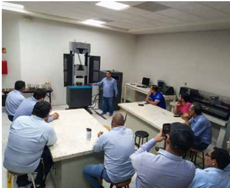
El Instituto Tecnológico de Sonora (Itson), a través del Departamento de Personal, llevó a cabo el programa de capacitación 'Laboratorios y Recursos Audiovisuales'.

El programa inició formalmente con un enfoque centrado en la