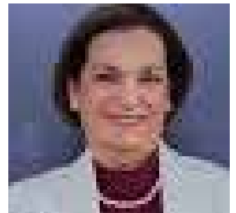
María Dolores Del Río.