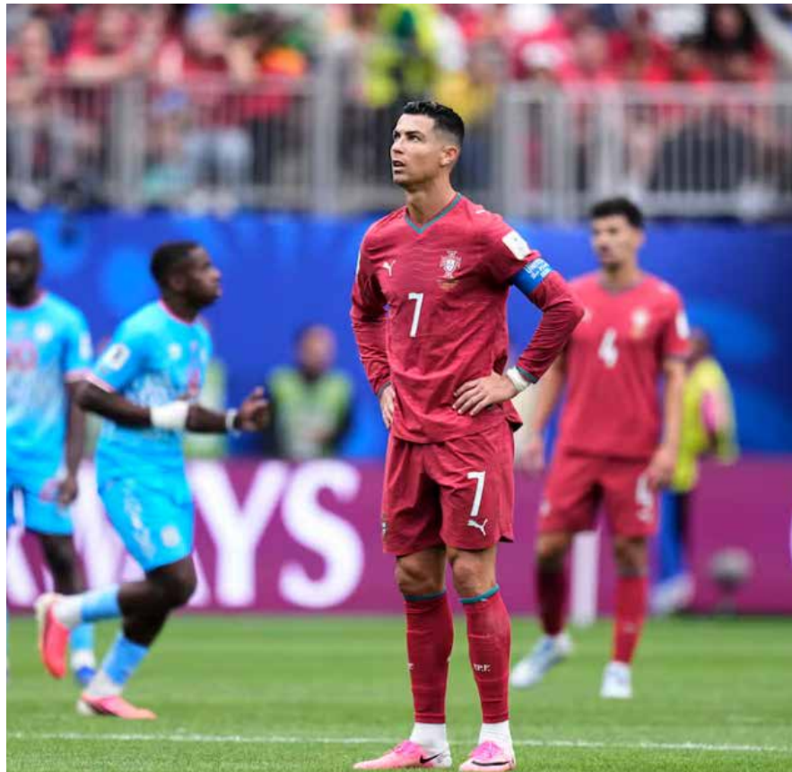
Pese al dominio y a un gol temprano, el equipo europeo dejó escapar una victoria que parecía controlada.

Finalmente el debut de CR7 al hacer historia tras participar en su sexto