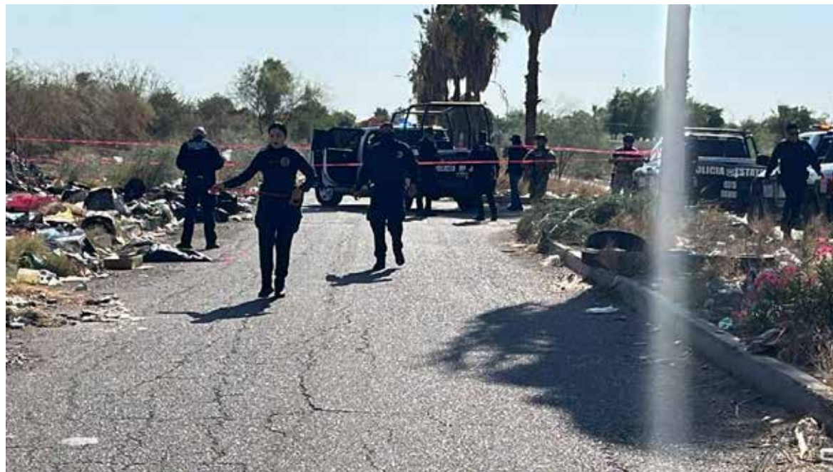
El cuerpo sin vida de un hombre fue localizado la tarde del miércoles en el interior de una bolsa de plástico de color negro.

De acuerdo con los primeros reportes, personas que transitaban por el sector observaron la bolsa