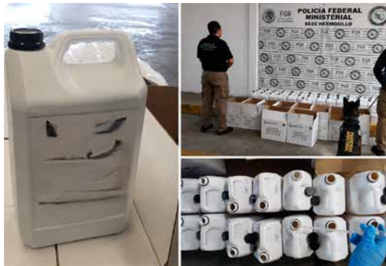
Se logró el aseguramiento de 40 bidones que contenían en conjunto 200 litros de metanfetamina.

La Fiscalía General de la República (FGR) a través de su Fiscalía Especializada de Control Regional (FECOR) en el estado de