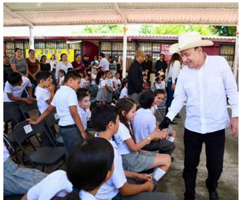
Durante su gira por la sierra, el mandatario impulsó obras prioritarias de infraestructura y servicios.

En Suaqui Grande, el gobernador Durazo Montaña anunció la construcción de un tejaban en la cancha del parque de la localidad, con una inversión aproximada de 5 millones de pesos, en beneficio de mil 114 habitantes, creando un