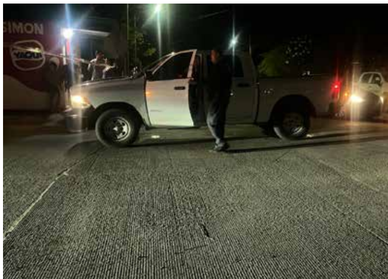
El hecho violento movilizó a corporaciones de seguridad de los tres niveles de gobierno en la zona.

reportes, la víctima presentó un rozón y un impacto de bala a la altura de la espalda. Afortunadamente, el proyectil no dañó órganos vitales, lo que evitó consecuencias mayores.