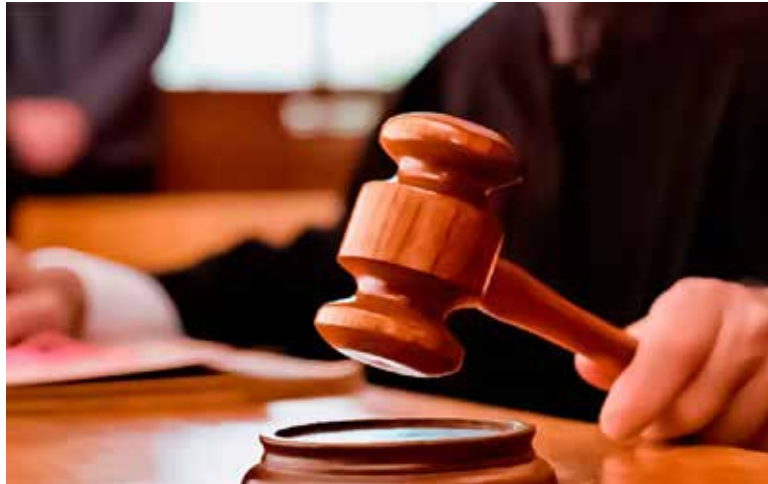
Maduro, que está acusado de cargos relacionados con el narcotráfico, se declaró no culpable ante un tribunal federal de la ciudad.

La petición -que solicitaba una prórroga de al menos tres semanas- fue presentada el martes ante el juez federal Alvin K. Hellerstein, que se encuentra al frente del caso en el Tribunal de Distrito Sur de Nueva York. La vista estaba programada para el 30 de junio, según informaciones de la cadena de televisión CNN.