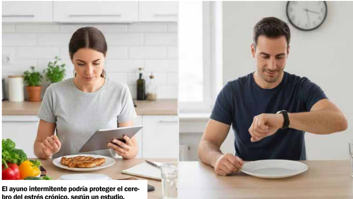
El ayuno intermitente podría proteger el cerebro del estrés crónico, según un estudio.

El ayuno intermitente, según la investigación publicada en Translational Psychiatry , podría ayudar a disminuir los efectos negativos del estrés crónico en el cerebro. Se observó que este patrón alimentario permite preservar la integridad de la mielina cerebral y mitigar conductas similares a la depresión en ratones sometidos a presión prolongada, posiblemente gracias a la influencia sobre bacterias beneficiosas en el intestino.