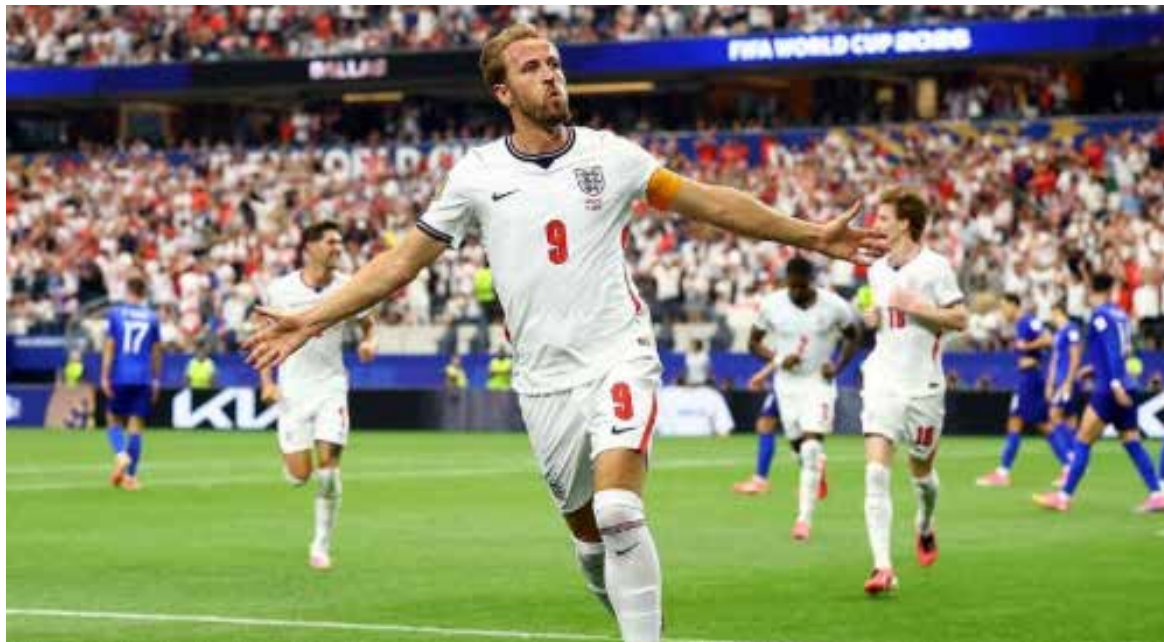
El conjunto de Gareth Southgate mostró contundencia en momentos clave para quedarse con los tres puntos.

Los croatas no bajaron los brazos y con el espíritu de lucha que les caracteriza consiguieron el empate 1-1 (36') tras una gran ju-