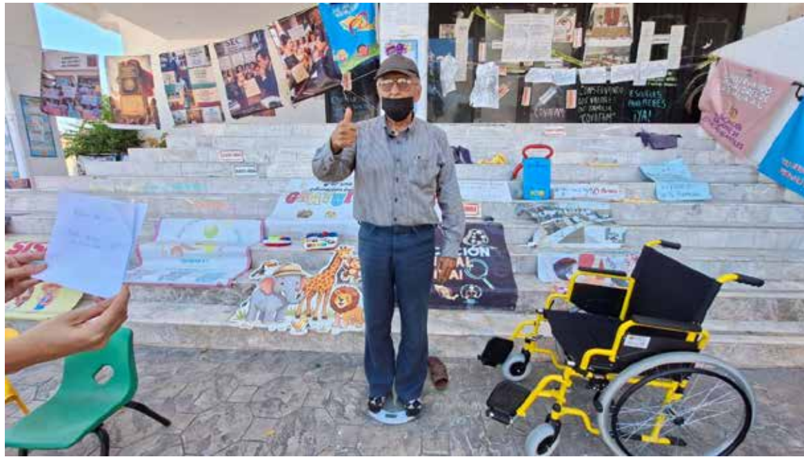
Abogado en huelga de hambre suma 28 días sin comer; reporta pérdida de más de 10 kilos

García Ramírez explicó que el desgaste físico se ha intensificado por diversos factores, entre ellos las altas temperaturas que se registran en Hermosillo, la exposición constante a la intemperie y las condiciones propias de