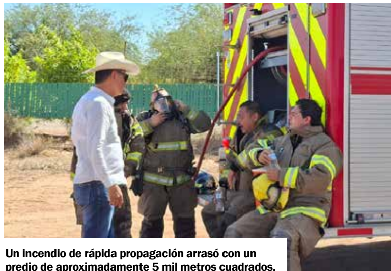
Un incendio de rápida propagación arrasó con un predio de aproximadamente 5 mil metros cuadrados.

era un punto muy pequeño, pero el viento cambió de dirección y tuvimos que salir para protección de las unidades y los bomberos... avanzó muy rápido”, explicó.