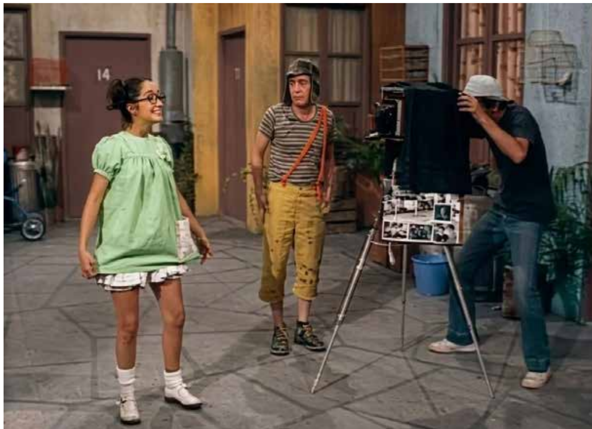
"Don Ramón", un reflejo honesto de la clase trabajadora latinoamericana cuyo legado e ingenio para sobrevivir traspasaron fronteras.

Cuando "Chespirito" lo invitó a formar parte de su primera producción independiente, "Los Supergenios de la Mesa Cuadrada" (1970), le dio una sola instrucción: "Sé tú mismo". Así nació el entrañable inquilino del departamento 72, un personaje que utilizaba su propia ropa cotidiana (pantalones de mezclilla, playera negra y gorro de pescador), no requería