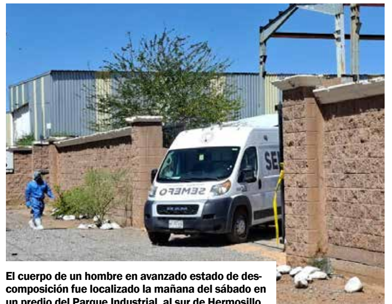
El cuerpo de un hombre en avanzado estado de descomposición fue localizado la mañana del sábado en un predio del Parque Industrial, al sur de Hermosillo.

De acuerdo con la información recabada en el lugar, el fallecido aparentemente se desempeñaba