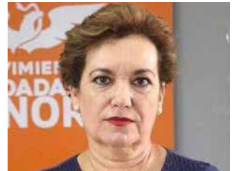
Dolores del Río

Con una semana de diferencia, el alcalde Javier Lamarque y la senadora Lorenia Valles midieron fuerzas a través de sus respectivos eventos de promoción electoral disfrazados con tintes informativos.