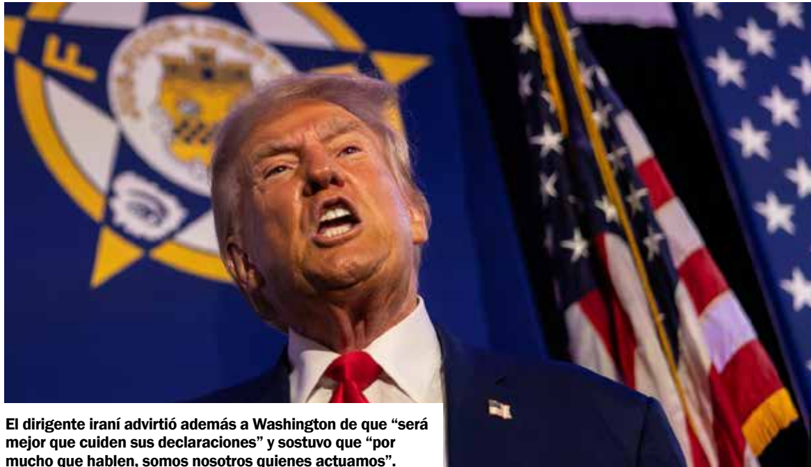
El dirigente iraní advirtió además a Washington de que “será mejor que cuiden sus declaraciones” y sostuvo que “por mucho que hablen, somos nosotros quienes actuamos”.

De acuerdo con IRNA, la delegación iraní interrumpió las conversaciones con EE.UU. que