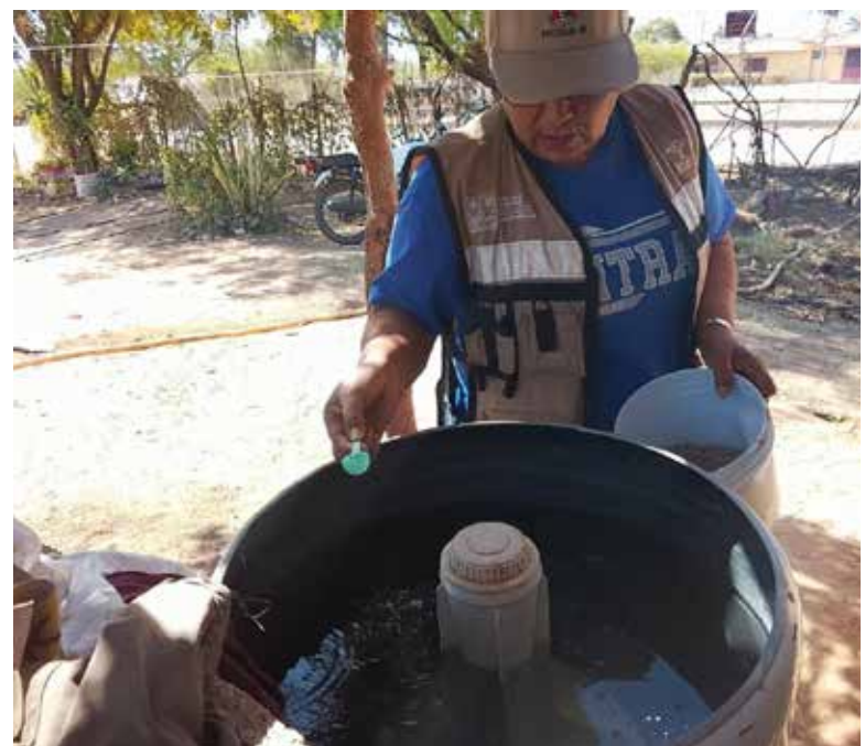
Se mantiene de forma permanente acciones para prevenir y controlar el dengue en diferentes municipios del estado.

El mosquito del dengue puede reproducirse en cualquier recipiente que acumule agua. Tinacos sin tapa, cubetas, juguetes,