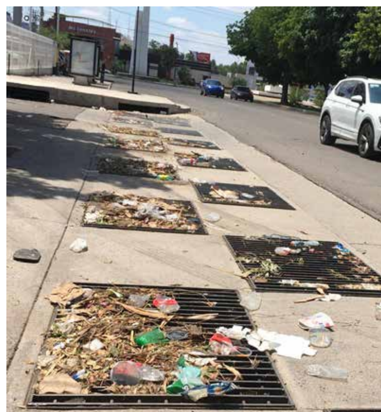
Llaman a no tirar basura en calles ante riesgo de inundaciones.

tener limpia la ciudad y reducir riesgos. Agregó que es fundamental fortalecer los mecanis-