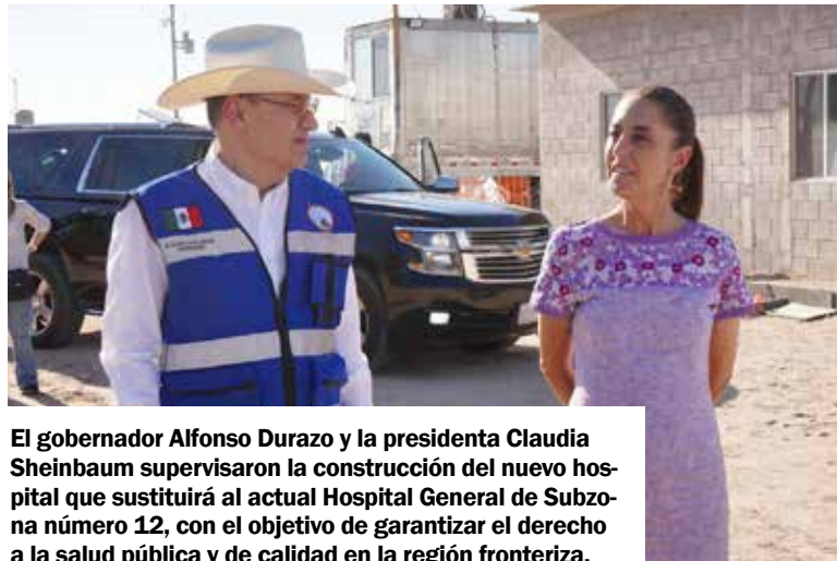
El gobernador Alfonso Durazo y la presidenta Claudia Sheinbaum supervisaron la construcción del nuevo hospital que sustituirá al actual Hospital General de Subzona número 12, con el objetivo de garantizar el derecho a la salud pública y de calidad en la región fronteriza.

Este nuevo nosocomio beneficiará de forma directa a más de 128 mil derechohabientes en San Luis Río Colorado y la región fronteriza, el cual sustituirá al actual Hospital General de Subzona número 12, y tendrá una capacidad de 120 camas censables, incorporando 24 especialidades médicas, así como equipamiento e instalaciones de vanguardia.