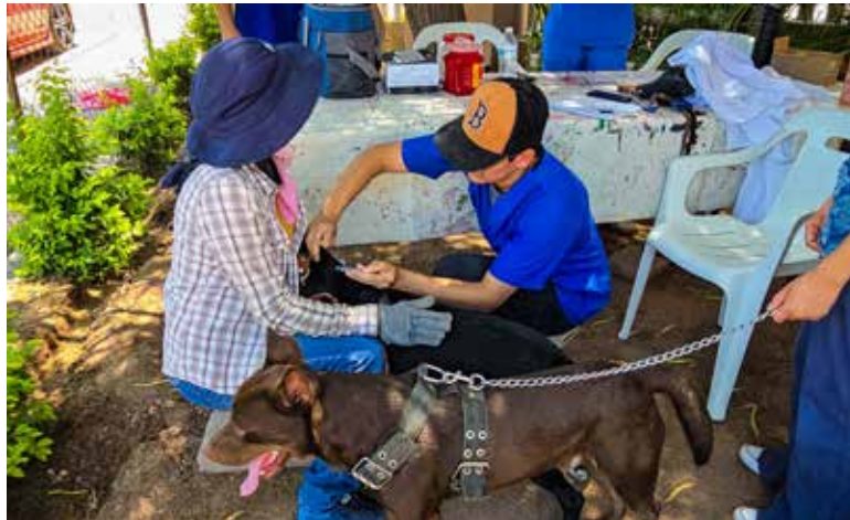
Se llevó a cabo la Campaña de Vacunación Antirrábica Gratuita dirigida a perros y gatos, en colaboración con las autoridades municipales y estatales de salud.

El Docente indicó que esta actividad forma parte de la colaboración permanente que la Universidad mantiene con las estrategias nacionales y estatales de vacunación antirrábica, especialmente durante la temporada de altas temperaturas, debido a que diversas enfermedades zoonóticas pueden incrementarse en este periodo, representando riesgos