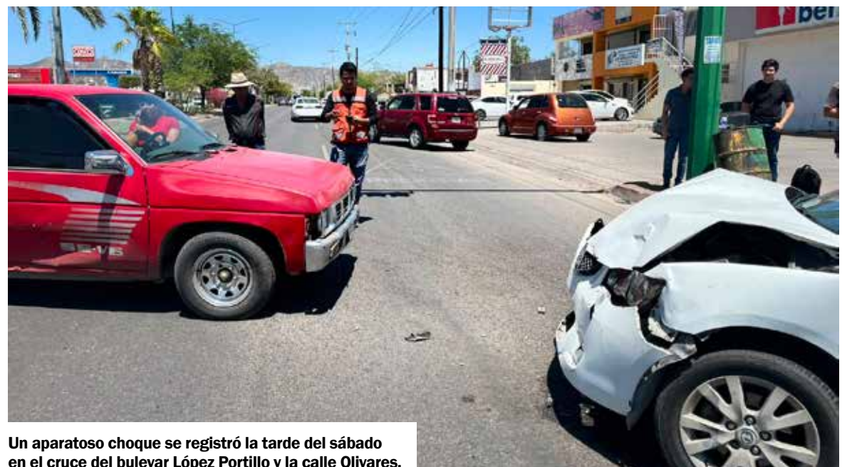
Un aparatoso choque se registró la tarde del sábado en el cruce del bulevar López Portillo y la calle Olivares.

Elementos de tránsito acudieron al sitio para tomar nota de lo ocurrido y realizar el deslinde de responsabilidades.