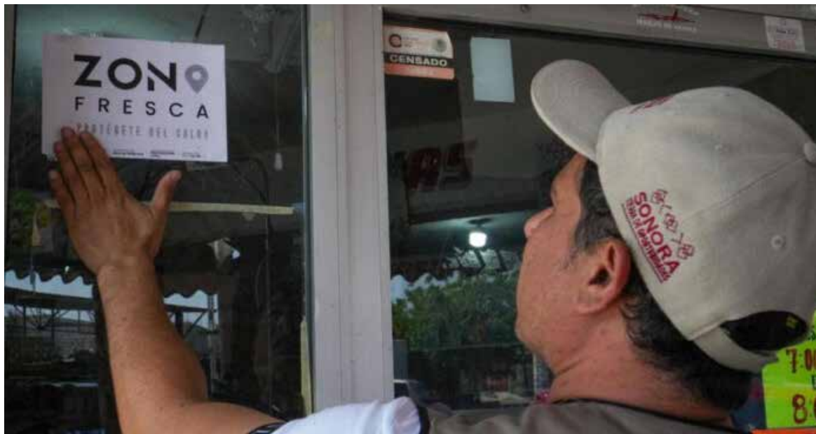
Canaco impulsa “zonas frescas” y llamado a proteger a la población ante el calor extremo en Hermosillo.

Señaló que tiendas de conveniencia como OXXO, cadenas SIX, además de farmacias, oficinas gubernamentales y la propia Cámara de Comercio, han abierto