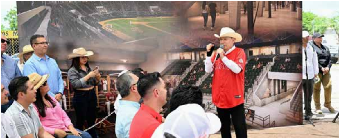
El gobernador Alfonso Durazo Montaño supervisó el arranque de la modernización y adecuación del estadio de béisbol Manuel 'Ciclón' Echeverría, proyecto histórico que contará con una inversión de 200 millones de pesos para rescatar uno de los recintos deportivos más emblemáticos del estado.