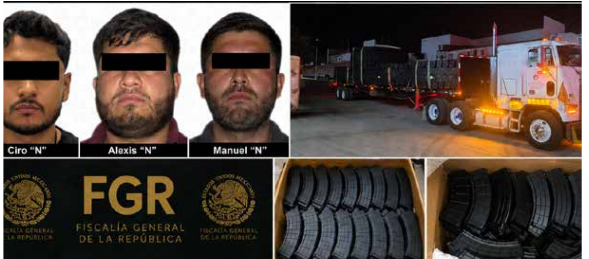
La Fiscalía General de la República (FGR) obtuvo vinculación a proceso en contra de tres personas.

Posteriormente, el Ministerio Público de la Federación (MPF) adscrito a la Fiscalía Especializada de Control Regional (FECOR) en Sonora, presentó los datos de prueba al juez de control, quien dictó la vinculación a proceso en contra de Alexis 'N', Manuel 'N' y Ciro 'N', impuso la medida cautelar de prisión preventiva oficiosa y otorgó un plazo de tres meses de investigación complementaria.