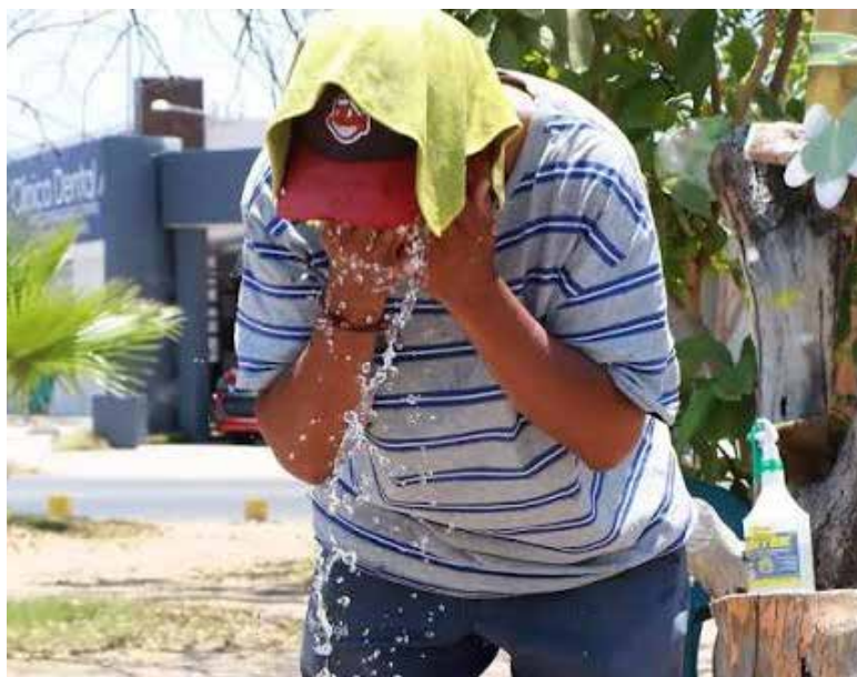
Protección Civil Sonora informa sobre condiciones de calor extremo, cielos despejados y posibles lluvias a partir de mediados de semana.

Ante cualquier situación de emergencia, se recuerda a la ciudadanía comunicarse de inmediato a la línea telefónica 9-1-1.