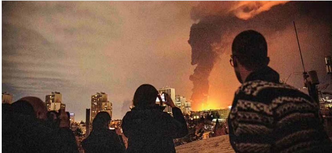
La compañía aclaró en un comunicado, que el incendio ocurrió mientras expertos de la compañía intentaban reanudar las operaciones de producción de gas en la fábrica.

heridos”, sin precisar cifras ni gravedad, la cartera cifró el total en 54 afectados, subrayando a la vez que los equipos de Búsqueda y Rescate,