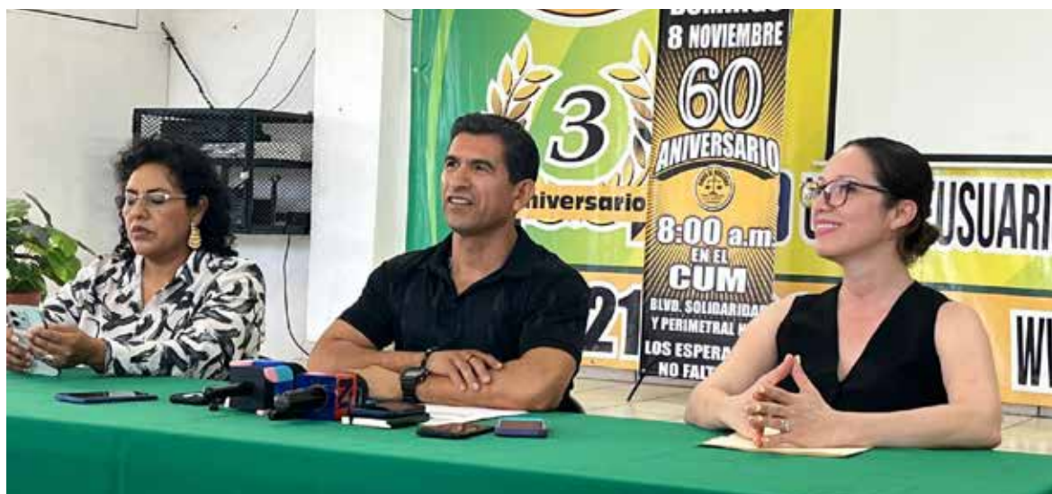
Campana ciudadana de reciclaje fortalece apoyo social y cuidado ambiental en Hermosillo.