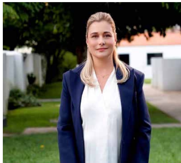
Gobernadora de Chihuahua exige investigar y entregar a Rocha Moya.

“Lo que atenta más contra la soberanía de México, no es un gobierno extranjero sino la impunidad del crimen organizado. Sí, el auténtico entreguismo e injerencismo es dar el control político al narco. La única razón por la que hoy vivimos esta situación es