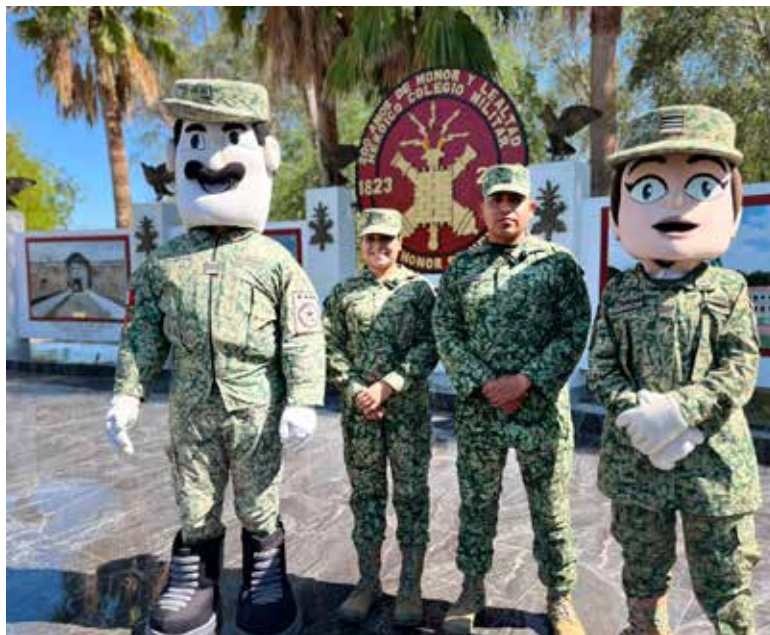
Cuarta Zona Militar abre sus puertas para senderismo nocturno en Hermosillo.

dará inicio a partir de las 6:30 de la tarde nuestros invitados podrán recorrer una ruta establecida dentro de las instalaciones militares.... El evento es totalmente gratuito, no falten, los esperamos aquí en la Cuarta Zona Militar”.