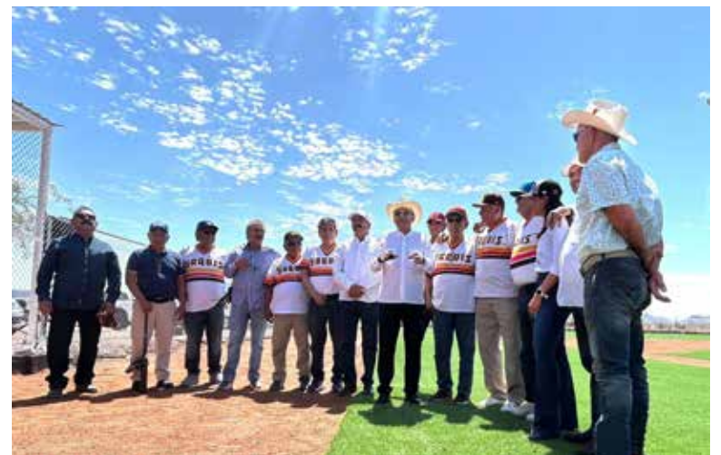
El gobernador Alfonso Durazo y el alcalde Javier Lamarque dieron el visto bueno a los trabajos realizados.

mos a la diputada Anabel Acosta, al presidente Javier Lamarque y al gobernador Alfonso Durazo por el apoyo’, mencionó, Baldemar Urías, impulsor del béisbol de la región y