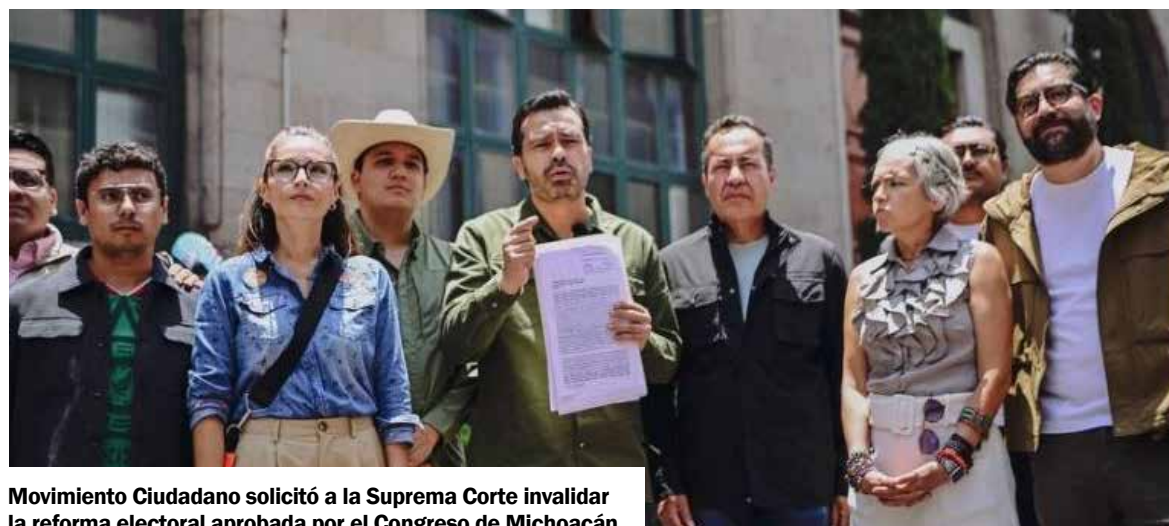
Movimiento Ciudadano solicitó a la Suprema Corte invalidar la reforma electoral aprobada por el Congreso de Michoacán.

La impugnación naranja se presentó formalmente bajo la figura de Acción de Inconstitucionalidad promovida por la Comisión Operativa Nacional de Movimiento Ciudadano. El recurso va dirigido en contra de la expedición, promulgación y publicación del Decreto No. 476, mediante el cual se reformaron, adicionaron y derogaron diversas disposiciones del Código Electoral del Estado de