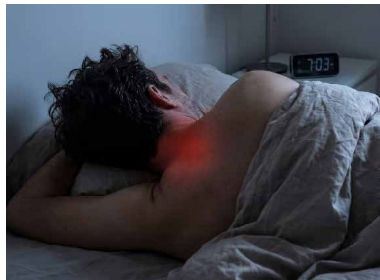
Especialistas señalan que el sedentarismo y el uso de pantallas están detrás del aumento de la cervicalgia.

El descanso nocturno influye directamente en la salud cervical. Dormir con almohadas dema-