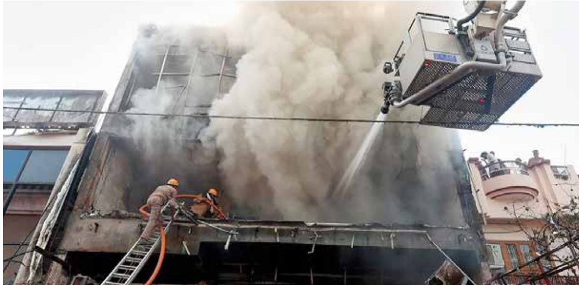
En el momento del siniestro, estudiantes y trabajadores se encontraban dentro del inmueble, lo que complicó la evacuación debido a la presencia de humo denso y la propagación del fuego.

El incendio se registró en un edificio de tres pisos donde funcionaba un centro educativo.