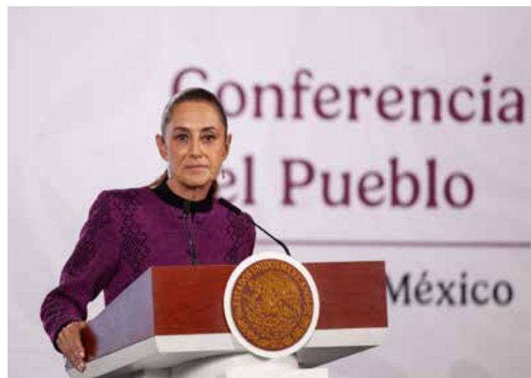
Sheinbaum añadió que también se buscó atender otras necesidades de la familia, aunque sin convertir el apoyo en un acto público.

Así mismo, la jefa de Estado señaló que mantiene contacto directo con personas afectadas por distintos problemas, incluidas madres buscadoras, pero sostuvo que no acostumbra difundir esos