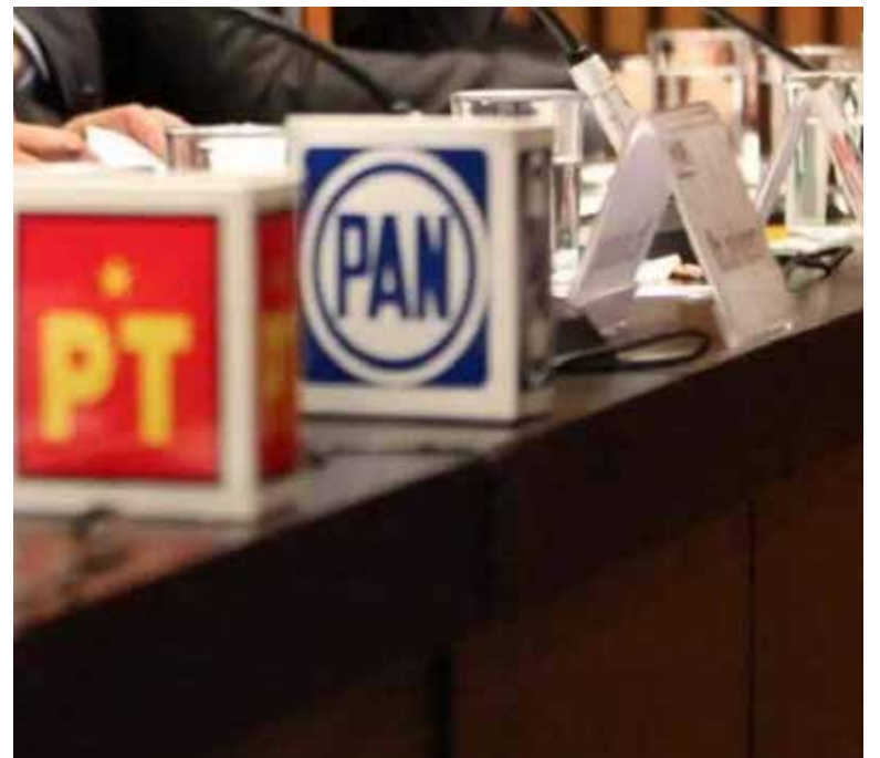
Prevé IEE registro de más de 10 agrupaciones políticas en Sonora.

tualmente, en procesos electorales, ya sea de manera directa o mediante alianzas con partidos ya establecidos”, explicó.