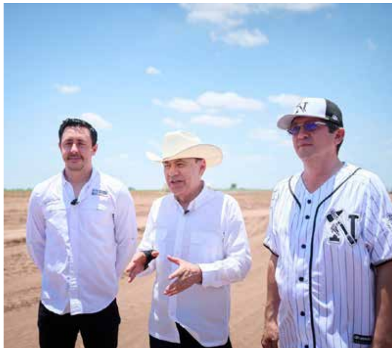
El jefe del Ejecutivo estatal supervisó el avance del proyecto de construcción de 2 mil 500 viviendas del Bienestar en Navojoa, como parte del programa nacional impulsado por la presidenta Claudia Sheinbaum Pardo.

Durante su gira de trabajo por el sur de Sonora, el mandatario estatal destacó que este desarrollo, que abarca una superficie de 28.5 hectáreas, representa una oportunidad histórica para garantizar el acceso a una vivienda digna para más familias del sur de Sonora, fortaleciendo así la justicia