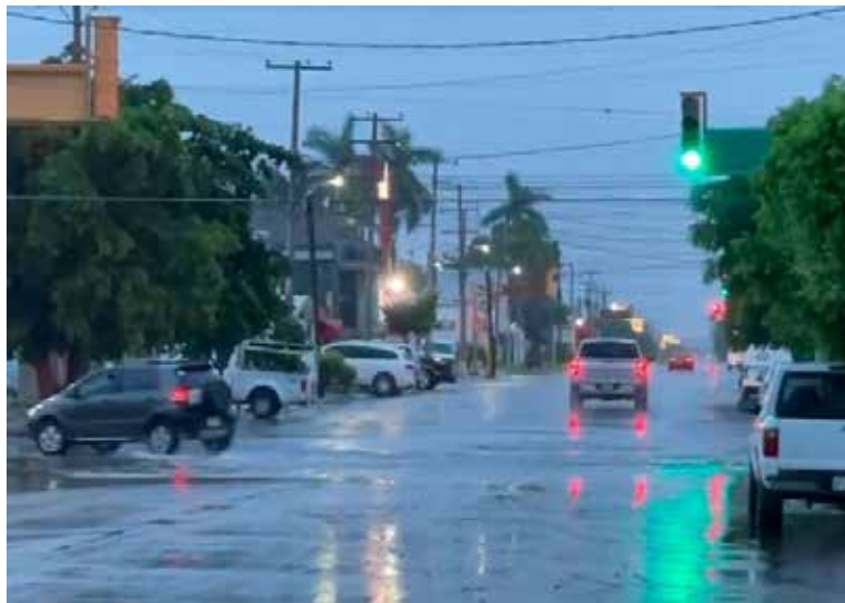
Lluvias por Día de San Juan alcanzarán a Cajeme este 24 de junio: Conagua.