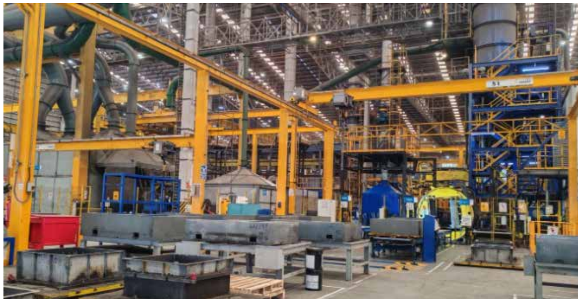
El crecimiento mensual de 1.2% marcó el mejor desempeño en casi dos años, de acuerdo con datos oficiales.

Las cifras muestran el mejor panorama de 2026, una vez que en enero hubo una contracción mensual de 1.0%; en febrero cre-