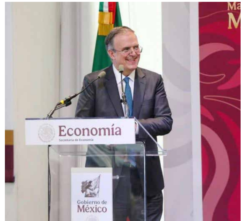
La revisión del tratado iniciará en julio, pero su permanencia está asegurada debido a que ninguno de los socios activó el mecanismo de salida.

Sobre el estado actual de las negociaciones, Ebrard señaló que aproximadamente el 85 por ciento del comercio entre México y Estados Unidos se realiza sin aranceles, lo que representa una diferencia sustancial respecto al escenario que planteó la administración Trump al inicio de su mandato, cuando amenazó con imponer un arancel generalizado de 25 por ciento a todos los pro-