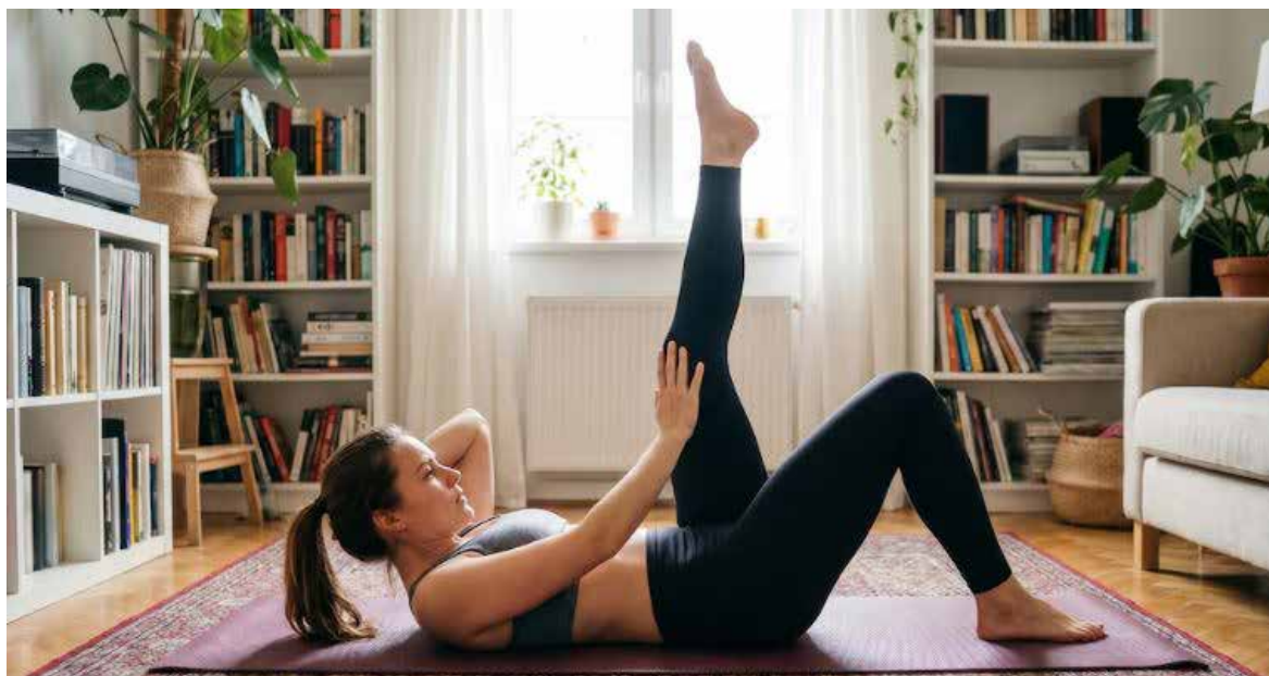
Estudios sobre ritmos circadianos indican que las personas con horarios más tempranos suelen presentar mejores indicadores de salud mental, metabólica y de estilo de vida.