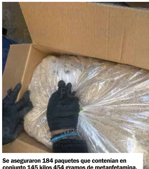
Se aseguraron 184 paquetes que contenían en conjunto 145 kilos 454 gramos de metanfetamina.

El narcótico asegurado quedó a disposición del Ministerio Público Federal (MPF), quien realiza los trámites legales correspondientes para proceder conforme a derecho corresponda.