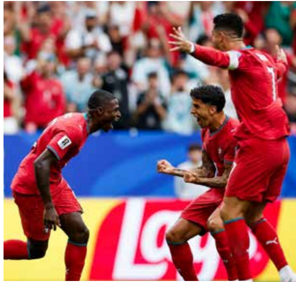
El atacante abrió el marcador apenas al minuto 6 y encaminó un triunfo sin complicaciones.

Ahí se trazó que el partido sería un día de campo para los lusos, que antes de la justa se les colocó la etiqueta de 'favoritos', con-