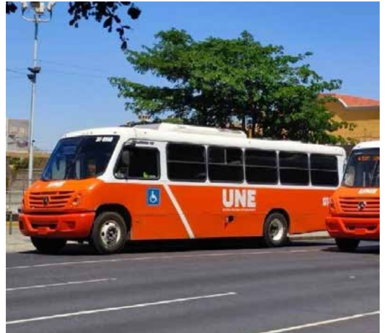
Exigen reforzar supervisión a camiones sin clima en Hermosillo.