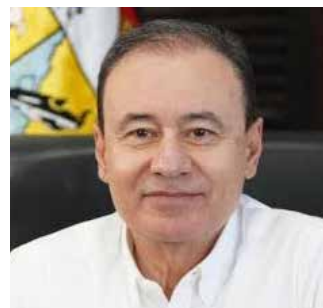
Alfonso Durazo Montaña