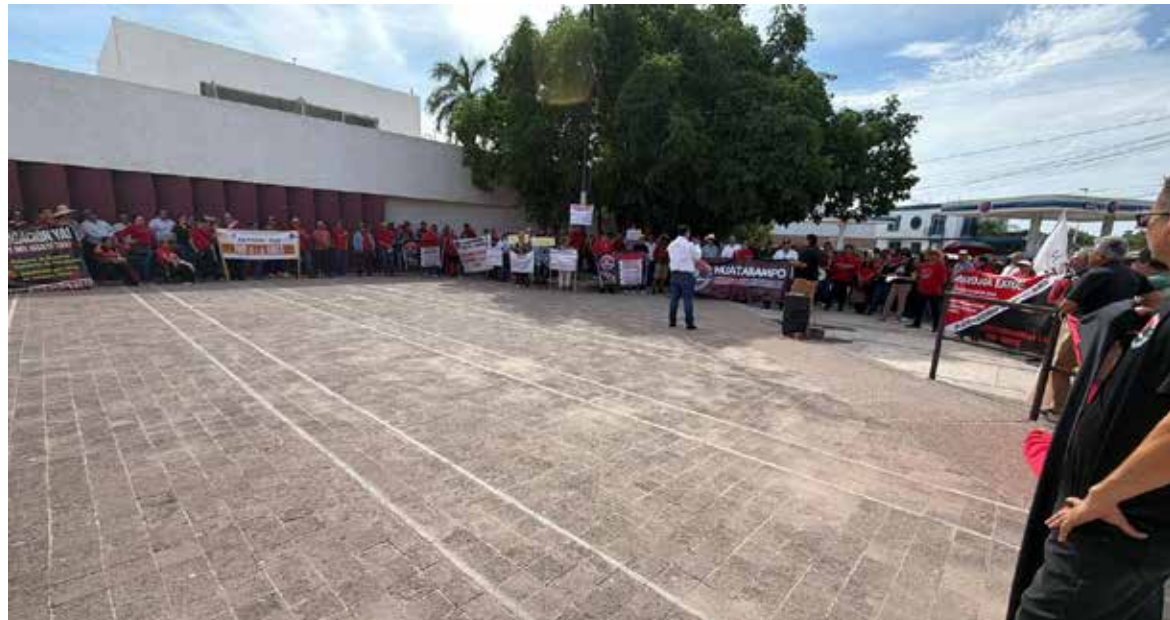
Jubilados del ISSSTE exigen mejor atención médica.

Los inconformes señalaron que las deficiencias en la atención, la falta de infraestructura adecuada y las carencias en diversos servicios continúan afectando