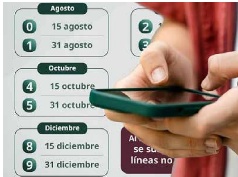
Prórroga al registro de celulares evidencia fallas en su implementación: Sonora Cibersegura.

El fundador de Sonora Cibersegura, señaló que desde el inicio del programa existieron advertencias sobre posibles vulnerabi-