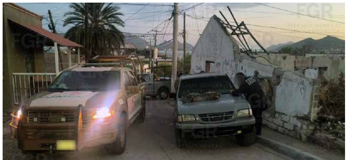
Se iniciaron investigaciones, tras el aseguramiento de 12 bidones vacíos con capacidad de 50 litros, y uno más abastecido con 50 litros de hidrocarburo.

El agente del Ministerio Público de la Federación, a través de la Fiscalía Especializada de Control Regional (Fecor) en Sonora resolverá la situación jurídica de las personas detenidas, dentro del tiempo constitucional, mientras continúa con la integración de datos de prueba que acrediten la