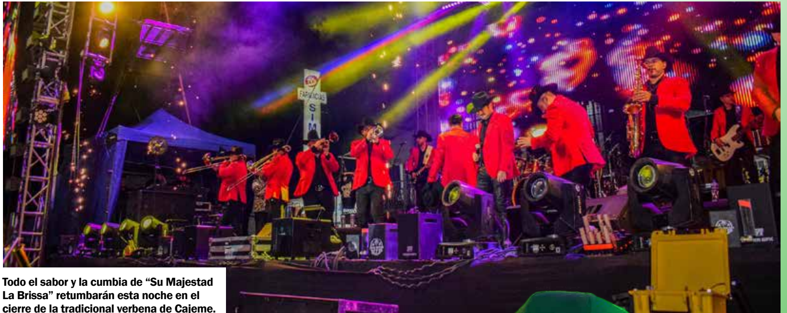
Todo el sabor y la cumbia de "Su Majestad La Brissa" retumbarán esta noche en el cierre de la tradicional verbena de Cajeme.