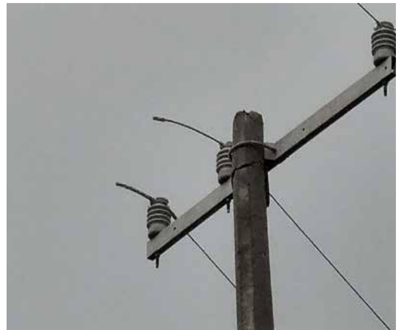
Las altas temperaturas de hasta 45 grados centígrados en la región han provocado apagones por varias horas en distintos municipios de Sonora.