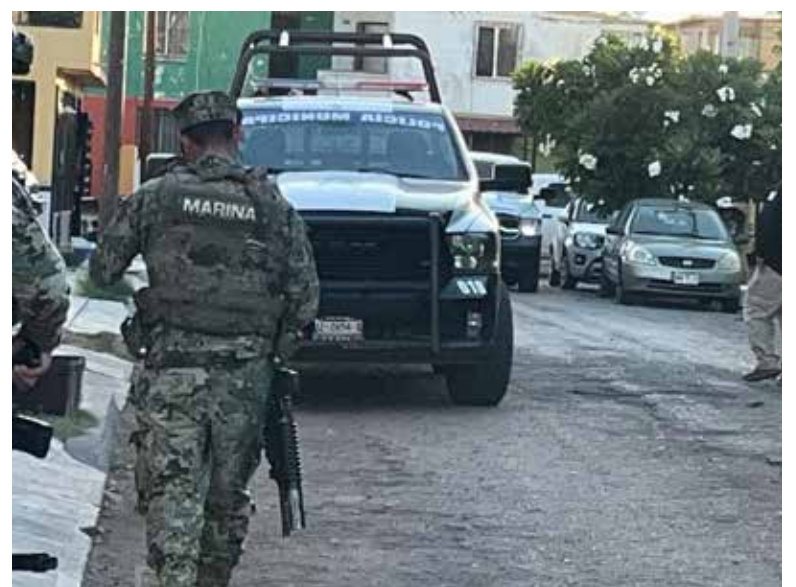
Una fuerte movilización de elementos de seguridad se registró en la colonia Cajeme, luego de reportarse la presunta privación ilegal de la libertad de un conductor.

Hasta el momento las autoridades no han emitido información