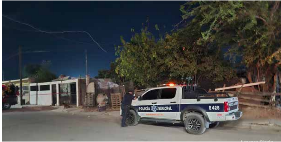
Un hombre murió la noche del jueves luego de ser atacado a balazos en un domicilio de la colonia Olivares.

El ataque fue reportado alrededor de las 22:00 horas. Paramédicos de la Cruz Roja trasladaron a la víctima en prioridad roja al Hospital General del Estado, ya que presentaba heridas de proyectil de arma de fuego en el abdomen y la espalda. Durante el traslado fue necesario realizar maniobras de reanimación y, minutos más tarde, se confirmó su fallecimiento en el hospital. La víctima fue identificada