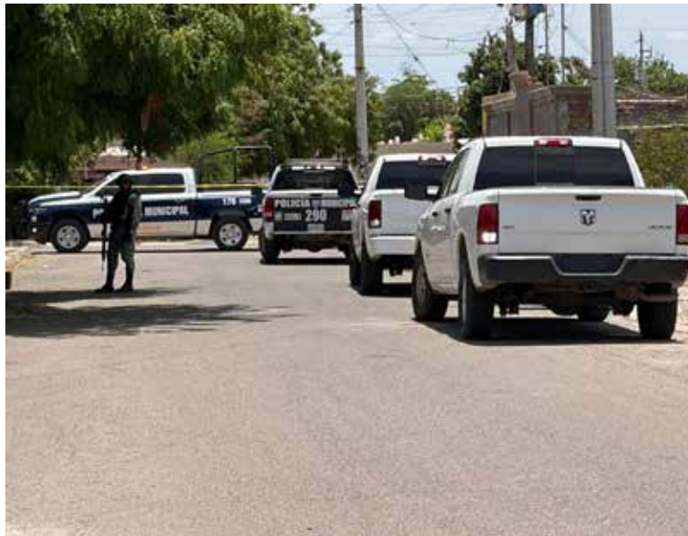
Un joven dio muerte a su esposa que tenía ocho meses de embarazo y después se privó de la vida.