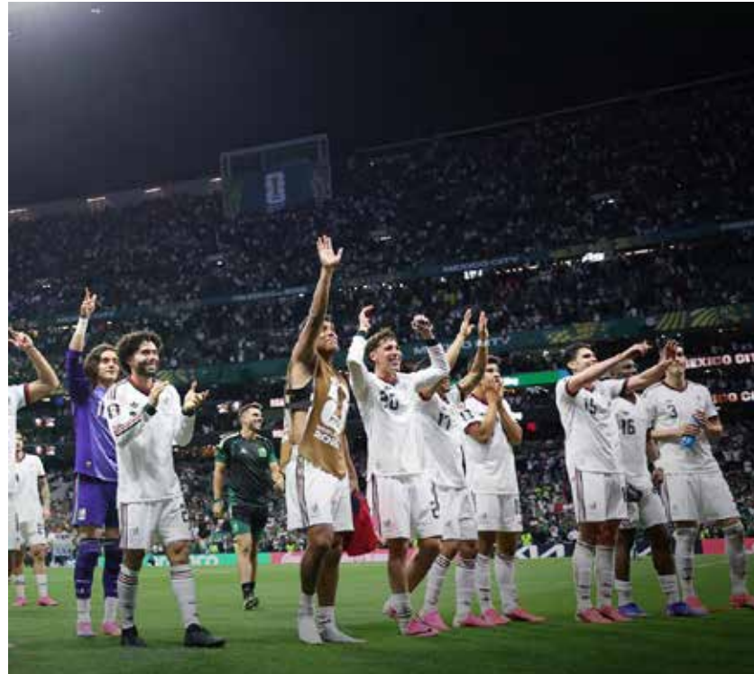
El Tricolor cerró la Fase de Grupos con paso perfecto y sin recibir gol, asegurando el liderato de su sector.

México derrotó este miércoles 24 de junio por 3-0 a la República Checa para clasificarse con puntaje perfecto, la primera vez en sus 18 participaciones mundialistas, y con la portería imbatida a la ronda de 16vos del Mundial 2026 y, de paso, dejó elimi-