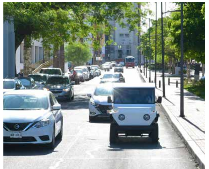
Antonio Astiazarán Gutiérrez conoció el proyecto AVIDO elaborado por estudiantes del Instituto Tecnológico de Hermosillo (ITH) enfocado en desarrollar una nueva alternativa de movilidad sustentable.

1/3 (Una tercera parte): Proporción actual de la flota vehicular del municipio que ya es eléctrica (incluyendo patrullas, dependencias, recolectores, barredoras y el H Bus).