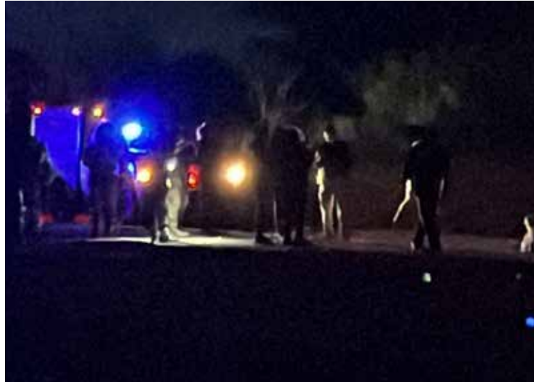
El cuerpo fue localizado envuelto en una cobija en la colonia Prados del Tepeyac.

Su hallazgo ocurrió poco antes de las 21:50 horas del martes 9 de