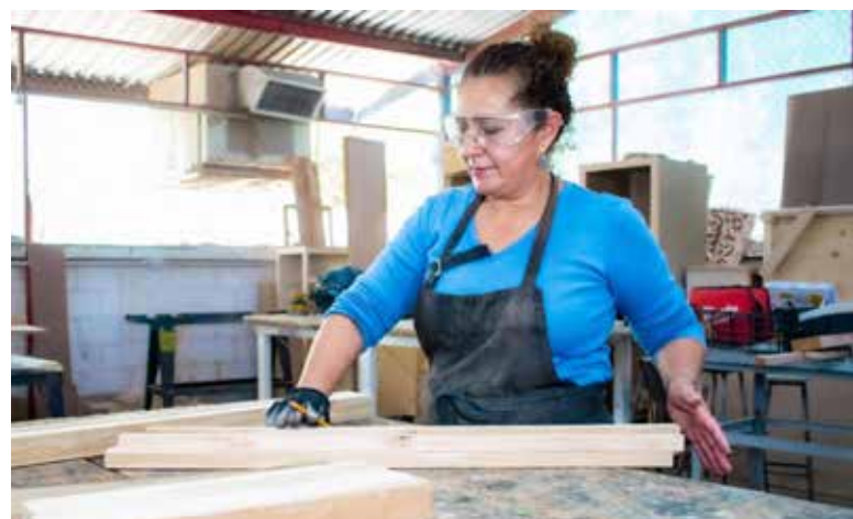
El Icatson intensificará sus actividades durante el segundo semestre del año, con una estrategia enfocada en ampliar la cobertura de cursos y talleres en distintas regiones de la entidad.