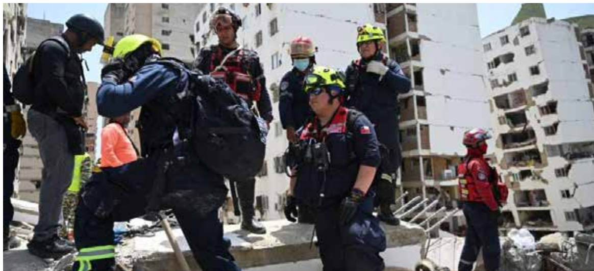
Familiares, vecinos y voluntarios se mueven como pueden entre la destrucción, pero necesitan maquinaria especializada para poder cortar varillas de acero o remover bloques.

Familiares, vecinos y voluntarios se mueven como pueden en