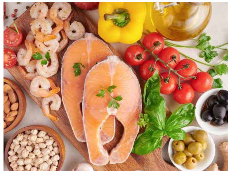
Una dieta equilibrada y antiinflamatoria puede contribuir a mejorar el bienestar de personas con hipotiroidismo y Hashimoto.

El mismo documento, respaldado por la Organización Mundial de la Salud (OMS) y la Asociación Americana de Tiroides (ATA), enfatiza que los nutrientes clave para el metabolismo tiroideo son