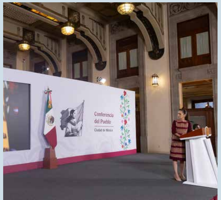
250 efectivos y 18 binomios caninos del agrupamiento “Yumare” apoyarán en las labores de rescate tras los dos terremotos consecutivos que se registraron el miércoles 24 de junio.

Avión C-130 Hércules con 8 toneladas de medicamento; 4 toneladas de equipo y material para actividades de rescate y salvamento.