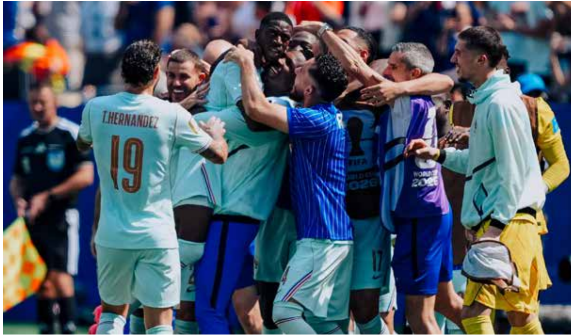
El duelo careció de las principales figuras esperadas, pero dejó una clara superioridad francesa.

Ousmane Dembélé se robó el show con definiciones exquisitas de izquierda y derecha para firmar su triplete a los minutos 7', 20' y 32'.