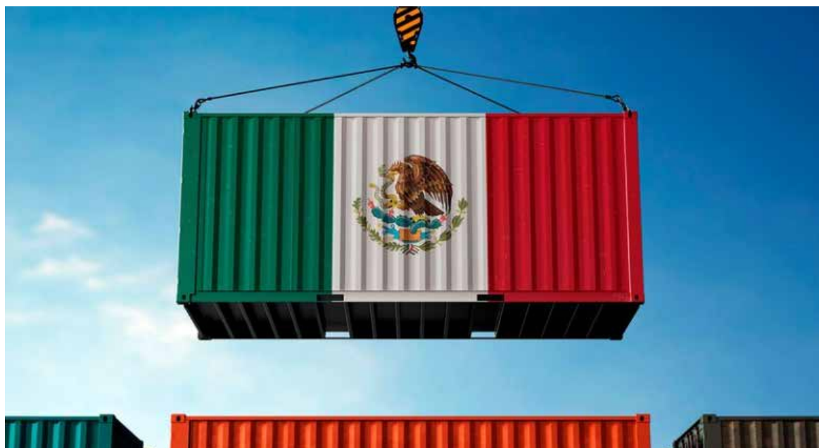
El superávit de la balanza comercial se redujo respecto al mes previo, aunque se mantiene en terreno positivo en lo que va del año.

El superávit comercial disminuyó de abril a mayo debido a