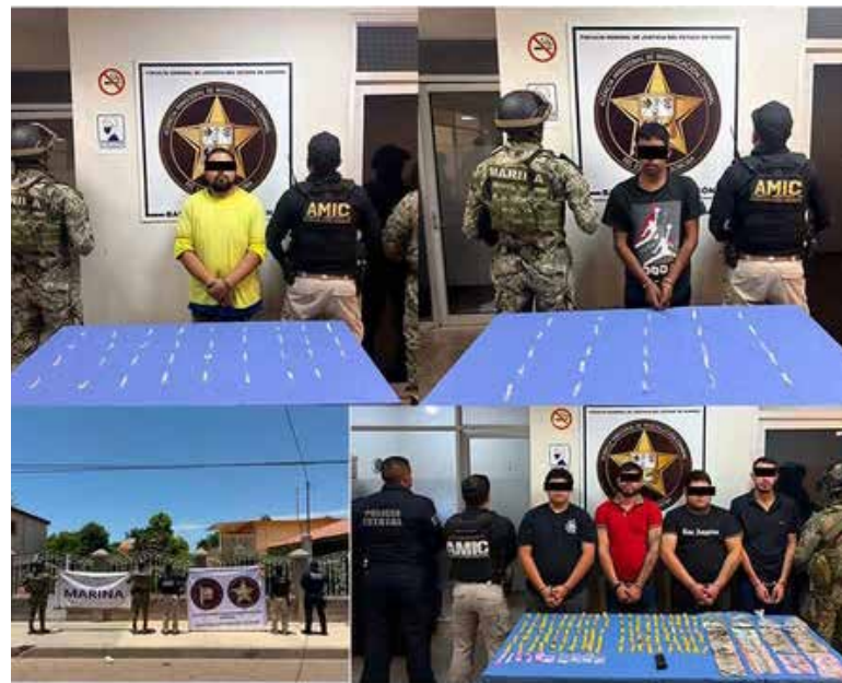
Fueron aseguradas seis personas, diversas dosis de droga, dinero en efectivo y un cargador abastecido.

Durante esta tercera intervención fueron asegurados 105 envoltorios con 'cristal', cinco envoltorios de plástico con polvo blanco, 10 mil 500 pesos en efectivo y un cargador abastecido con cartuchos útiles calibre 5.7x28,