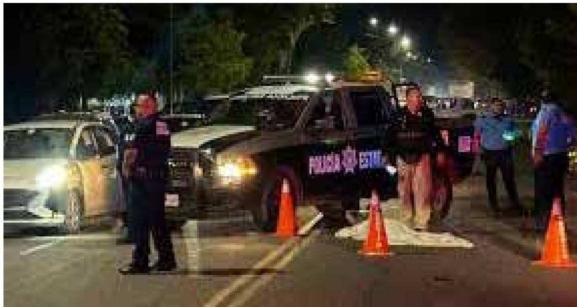
Una mujer quedó tendida en la carpeta asfáltica sin signos vitales, tras ser impactada por un automóvil.

Las autoridades no dieron a conocer más detalles, sólo se informó que la mujer fue atropellada y perdió la vida en el lugar del accidente.