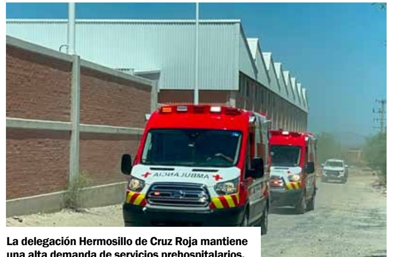
La delegación Hermosillo de Cruz Roja mantiene una alta demanda de servicios prehospitalarios.

ción desde el centro de comunicaciones que permite definir si es prudente acudir a determinados servicios, especialmente aquellos relacionados con violencia armada.