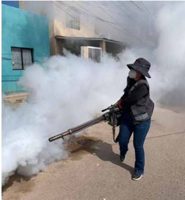
La estrategia permanente de prevención y control del dengue que mantiene el Gobierno de Sonora, a través de la Secretaría de Salud Pública (SSP), continúa dando resultados.

H ERMOSILLO. La estrategia permanente de prevención y control del dengue que mantiene el Gobierno de Sonora, a través de la Secretaría de Salud Pública (SSP), continúa dando resultados, gracias al fortalecimiento de las acciones de vigilancia epidemiológica, fumigación y eliminación de criaderos del mosquito transmisor en todo el estado.