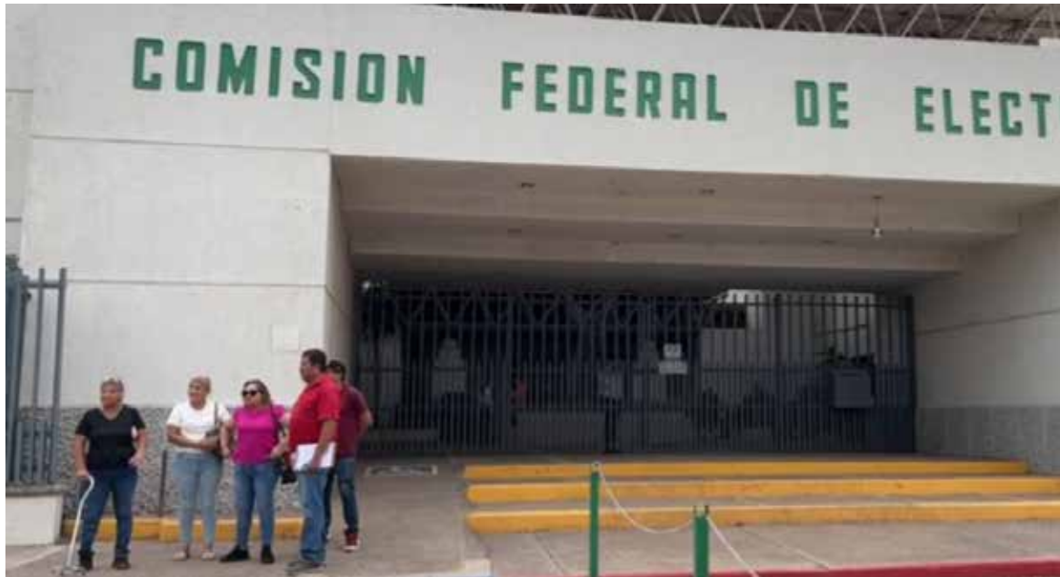
Es necesario que CFE revise el estado en el que se encuentran los transformadores del primer cuadro de la ciudad y amplíe la capacidad de suministro.

El presidente de la Canaco, señaló que el problema de los apagones es una situación que también afecta al comercio, problema que no solo es “soportar el calor”, sino que