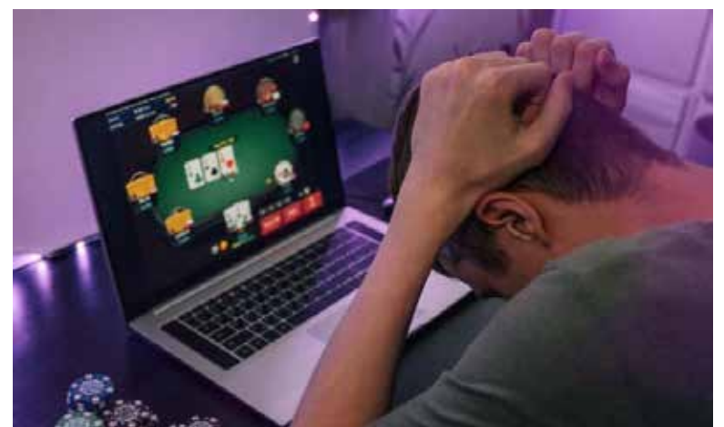
El crecimiento de las apuestas en línea y el fácil acceso a plataformas digitales han encendido alertas entre especialistas en salud mental en Sonora.

Sin embargo, alertó que el mayor riesgo actual proviene de las plataformas digitales, donde menores de edad logran registrarse y realizar apuestas pese a supuestas restricciones.