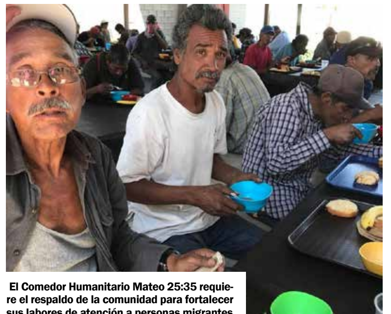
El Comedor Humanitario Mateo 25:35 requiere el respaldo de la comunidad para fortalecer sus labores de atención a personas migrantes.

no perecederos, productos de higiene, medicamentos básicos y ropa para hombre en buen estado, insumos que son necesarios para continuar apoyando a