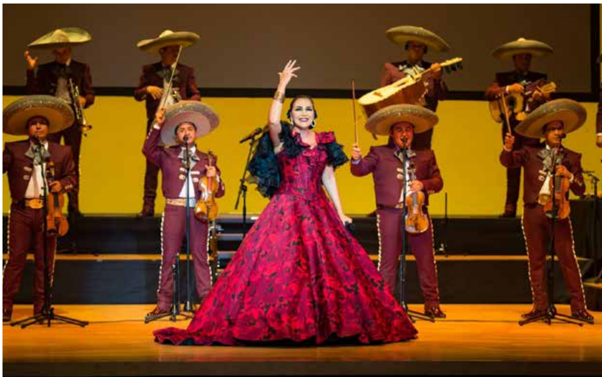
Aída Cuevas busca celebrar sus bodas de oro en Bellas Artes y alista un libro revelador sobre Juan Gabriel y su conflicto con Carlos Cuevas.