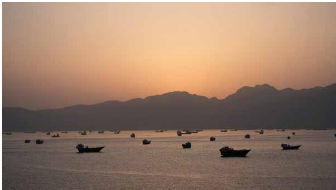
Las fuerzas del Mando Central de Estados Unidos (CENTCOM) confirmaron el sábado que sus fuerzas aéreas atacaron posiciones estratégicas iraníes en respuesta a la “continua agresión”.

El primer punto del documento no solo exige el cese de bombardeos israelíes sino que además