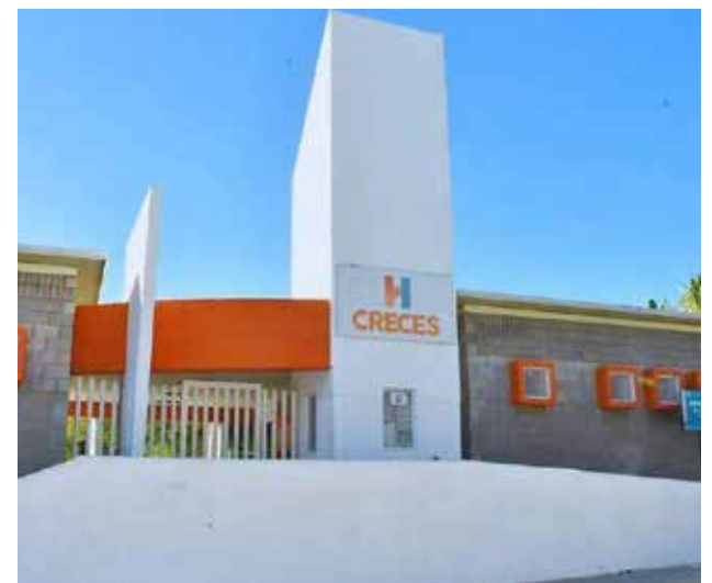
Centros Hábitat resguardan a más de 20 personas durante apagones del fin de semana.

agua potable, áreas climatizadas y condiciones adecuadas para que los ciudadanos puedan permanecer mientras se restablece el servicio eléctrico en sus colonias.