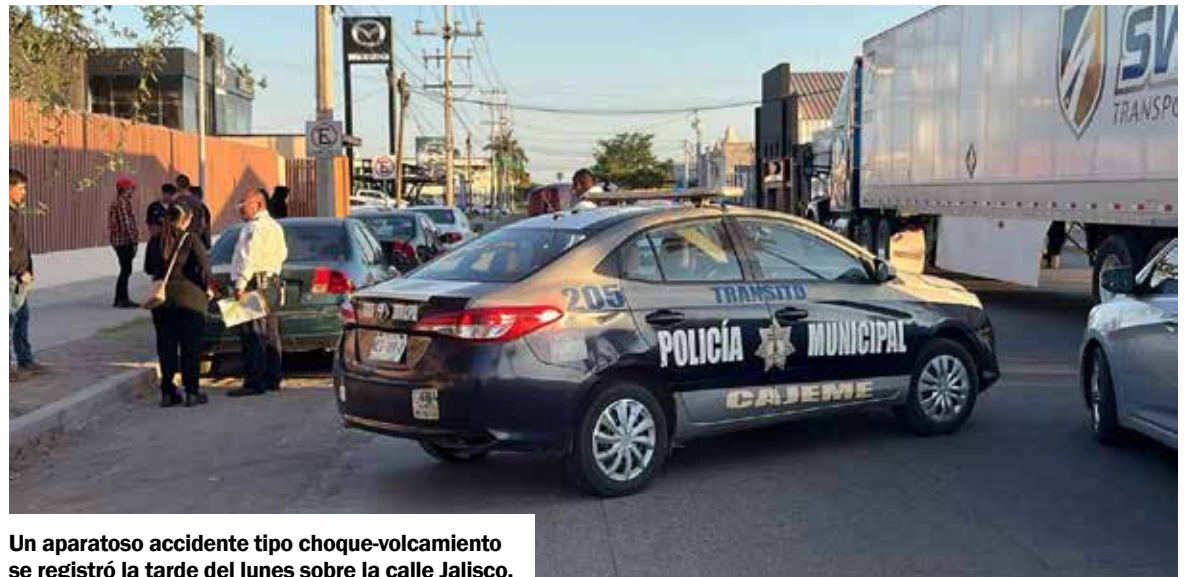
Un aparatoso accidente tipo choque-volcamiento se registró la tarde del lunes sobre la calle Jalisco.