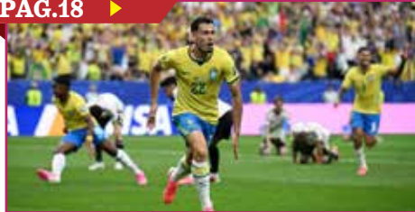
BRASIL AVANZA A OCTAVOS DE FINAL DEL MUNDIAL 2026