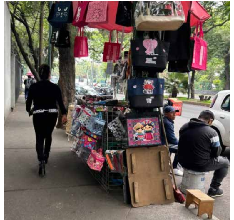
El aumento de este sector refleja menor impulso en la economía formal, con baja inversión, estancamiento del empleo y consumo moderado.

Por actividad económica, el VAB de la economía informal creció principalmente en el sector primario, con un avance anual de 3.7%, impulsado por actividades como la agricultura, la ganadería y la pesca. En tanto, las actividades terciarias informales aumentaron 2.2%, por encima del 1.4% registrado por las formales. Esto refleja una creciente precarización de sectores como el comercio, el transporte, los servicios financieros y actividades culturales.