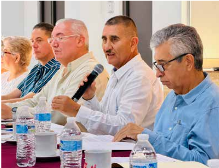
CTM Hermosillo impulsa nueva clínica del IMSS para atender a más de 206 mil derechohabientes.

Enfatizó, que la propuesta fue presentada durante la reunión