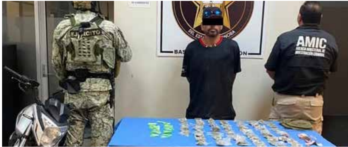
Durante recorridos de seguridad, se detectó una posible actividad de venta en vía pública, lo que derivó en una intervención inmediata y el aseguramiento de indicios.