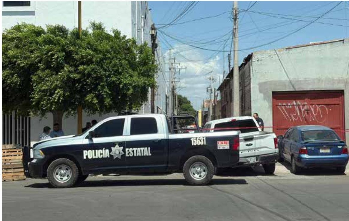
Un hombre de 65 años terminó con su vida, ahorcándose de una protección metálica en la vía pública, en la colonia Hidalgo.

El hombre utilizó un trozo de tela de color negro atando un extremo a la protección metálica y