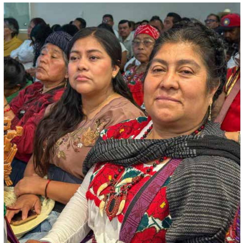
Sonora participará en consulta nacional para nueva Ley de Derechos Indígenas y Afromexicanos.

nueva legislación permitirá garantizar la participación efectiva de los pueblos indígenas y afroamericanos en la vida pública nacional, además de fortalecer el respeto a sus formas de organización, cultura, territorio y sistemas normativos.