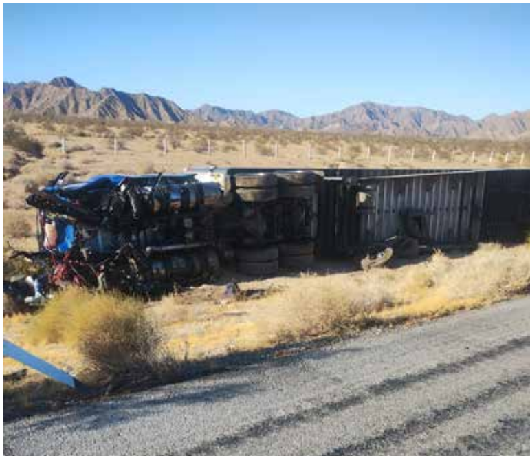
Un aparatoso accidente, en el que presuntamente dos vehículos chocaron de frente, dejó como saldo una persona sin vida y otra más con lesiones de gravedad.

De acuerdo con el reporte preliminar, una persona perdió la vida en el lugar, otra fue trasladada en estado grave para recibir atención