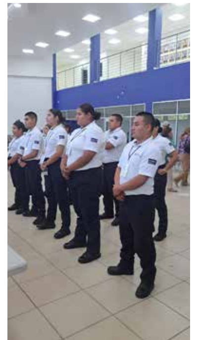
La Academia de Policía mantiene un índice de cero deserción.

Homologado. Estamos hablando de mil 100 horas de capacitación y 48 materias", detalló.