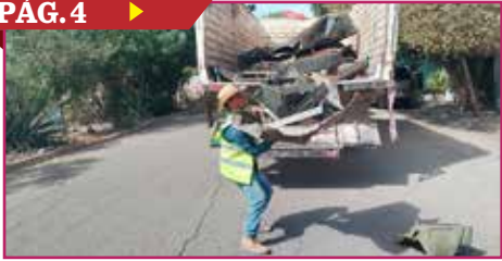
COMBATEN A LOS MOSCOS