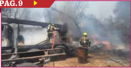
FALTA EMPATÍA CON BOMBEROS