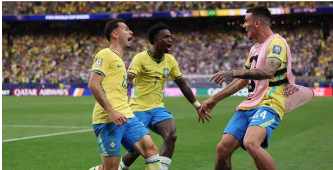
Un gol en la recta final sentenció un partido intenso que mantuvo la tensión hasta el último instante en Houston.

El tanto fue doloroso para los sudamericanos, que se fueron