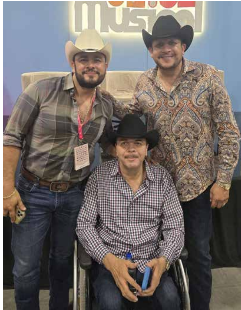
Los herederos de Don Everardo “Lalo El Gallo” Elizalde listos para seguir haciendo historia en los escenarios más importantes de México.

Sin embargo, la sorpresa no termina con los hombres de la casa. Joel compartió que la herencia musical ha comenzado a ramificarse de manera formal hacia las nuevas generaciones, tocando ahora la voz de algunas de sus sobrinas. Estas jóvenes, cobijadas por el prestigioso apellido y el ejemplo constante de sus tíos, ya empiezan a dar sus primeros pasos dentro de la industria grabando maquetas y preparando repertorios especiales. Este relevo generacional femenino inyecta frescura a la dinastía y asegura que el característico estilo interpretativo de la familia evolucione y se adapte a los nuevos tiempos,