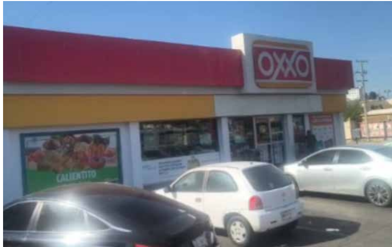
Bomberos de Hermosillo denunciaron que personal del Oxxo San Bernardino les negó el acceso a la tienda cuando pretendían comprar agua, sueros, hielo y refrescos.

HERMOSILLO. Bomberos de Hermosillo denunciaron que personal del Oxxo San Bernardino les negó el acceso a la tienda cuando pretendían comprar agua, sueros, hielo, refrescos y otros productos para hidratarse, además de adquirir bebidas para celebrar, durante su jornada laboral, el cumpleaños de uno de los integrantes de la corporación, luego de combatir un incendio que se prolongó por más de una hora.