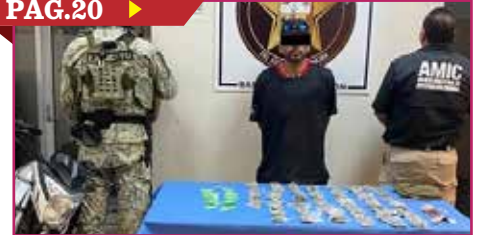
DETIENEN A SUJETO CON DROGA EN VILLA BONITA