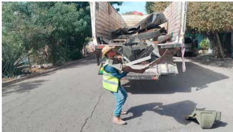
El implementar acciones de limpieza, descacharre y fumigación, son fundamentales para la prevención de enfermedades.

Como parte de la estrategia conjunta entre Ayuntamiento y Distrito de Salud número 4, para minimizar el riesgo de la propagación de enfermedades producidas por vector, tales como el Dengue, Zika y Chikungunya, mismas que son producidas por vector, principalmente por el mosquito Aedes Aegypti , continúan en Cajeme las acciones del programa de descacharrización en los diferentes polígonos de la localidad, acciones a través de las cuales también se previenen los casos de Rickettsia .