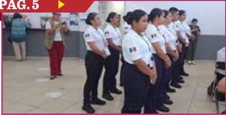
CERO DESERCIÓN EN LA ACADEMIA DE POLICÍA