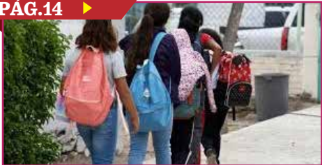
ALISTAN FIN DEL CICLO ESCOLAR