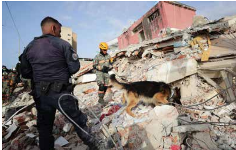
La presidenta Delcy Rodríguez, dijo que el país se encuentra en un periodo crucial para el hallazgo de sobrevivientes, cuando ya se han cumplido cuatro días desde lo ocurrido.

mingo con un grupo de rescatistas internacionales a quienes agradeció por su labor y solidaridad y añadió que los venezolanos tienen mucha esperanza en su trabajo.