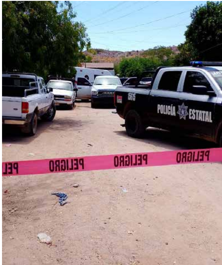
Un ataque armado registrado la noche del martes en la colonia Jorge Valdez Muñoz dejó como saldo un hombre sin vida y una mujer lesionada.

La zona fue acordonada por elementos de seguridad, mientras personal de Servicios Periciales y de la Agencia Ministerial de Investigación Criminal realizó el procesamiento de la escena e inició las investigaciones correspondientes.