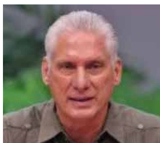
Miguel Díaz Canel