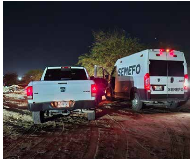
Un hombre de 63 años fue asesinado presuntamente por su propio hijo durante la madrugada del martes en la colonia Villa Hermosa.

mentos de seguridad tras el reporte de una persona sin vida. Información preliminar indica