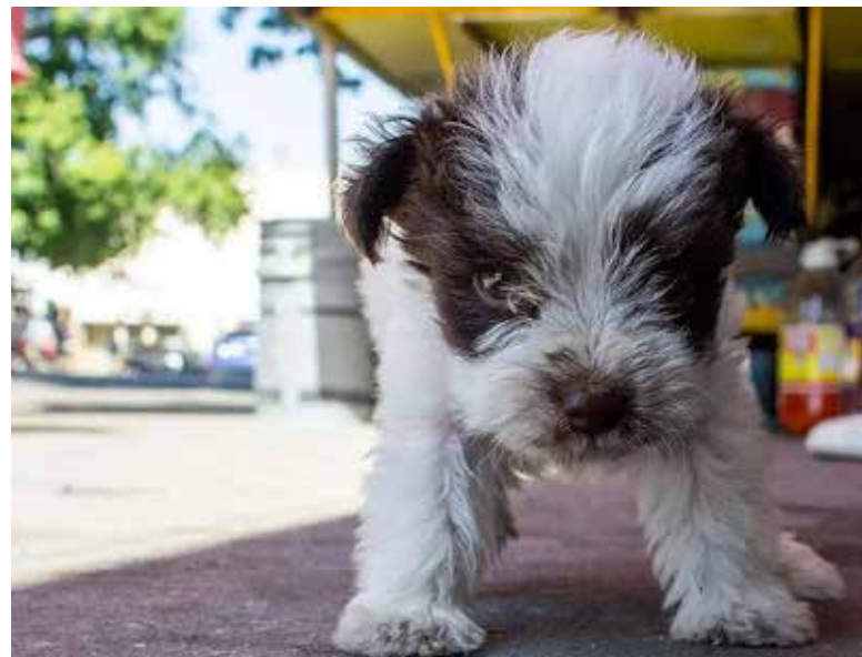
Promueven cultura de protección animal con talleres gratuitos en Sonora.

ción de perros y gatos, además de impulsar una mayor conciencia social”, comentó.