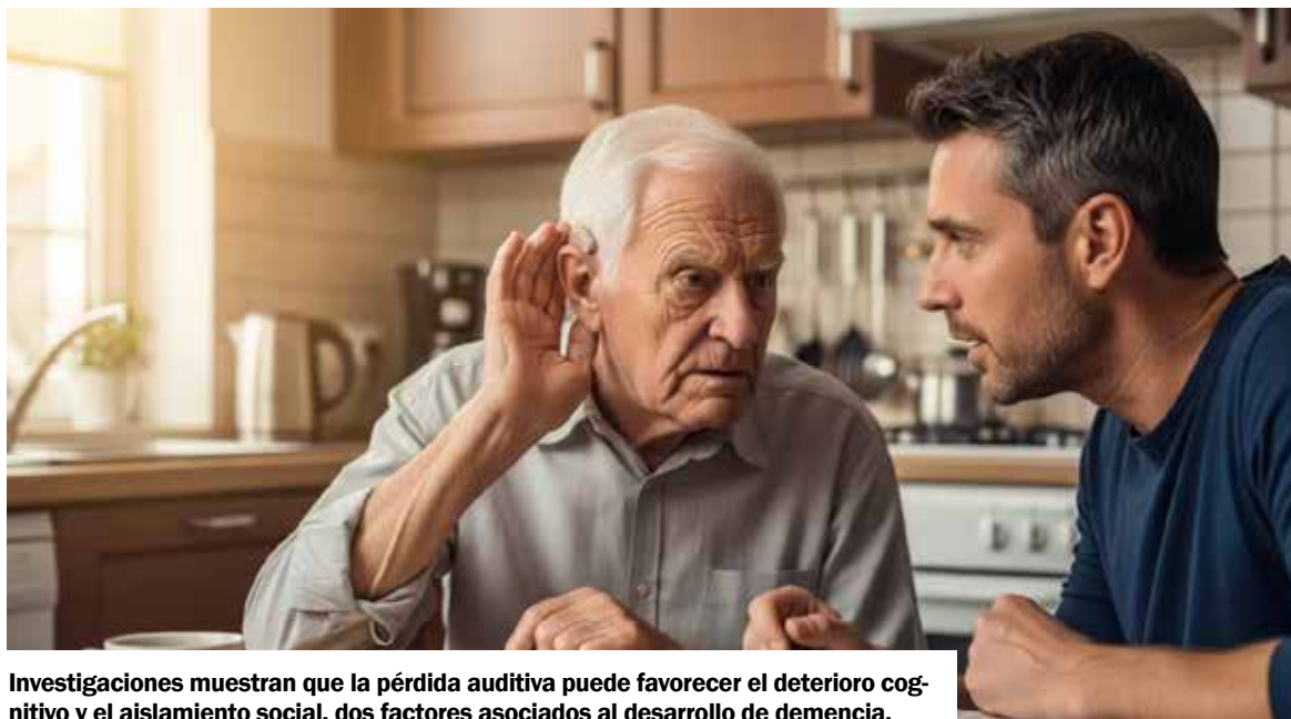
Investigaciones muestran que la pérdida auditiva puede favorecer el deterioro cognitivo y el aislamiento social, dos factores asociados al desarrollo de demencia.

Wint explicó que hablar de "causa" sería excesivo, aunque la asociación es clara. También indicó que la comunidad médica reconoció esta conexión hace relativamente poco. El especialista añadió que la pérdida de audición figura entre los mayores factores de riesgo modificables para la demencia y que puede tener un efecto posterior sobre la salud