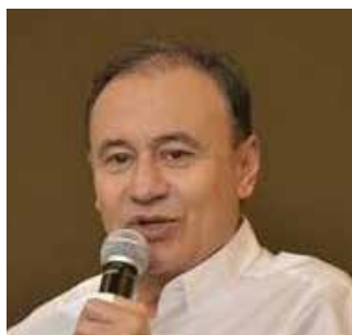
Alfonso Durazo Montaña