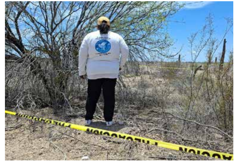
El cuerpo sin vida de una persona fue localizado en avanzado estado de descomposición a un costado de la carretera 36.

Las autoridades mantienen abierta la investigación para establecer el móvil de la agresión e identificar a los responsables.