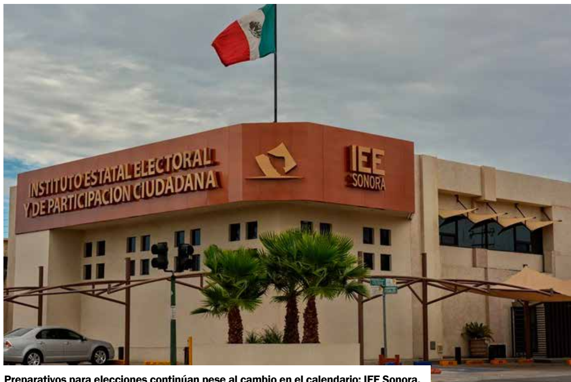
Preparativos para elecciones continúan pese al cambio en el calendario: IEE Sonora.

tegración de equipos de trabajo, la planeación operativa y la asignación de recursos necesarios para garantizar una elección ordenada”, precisó.