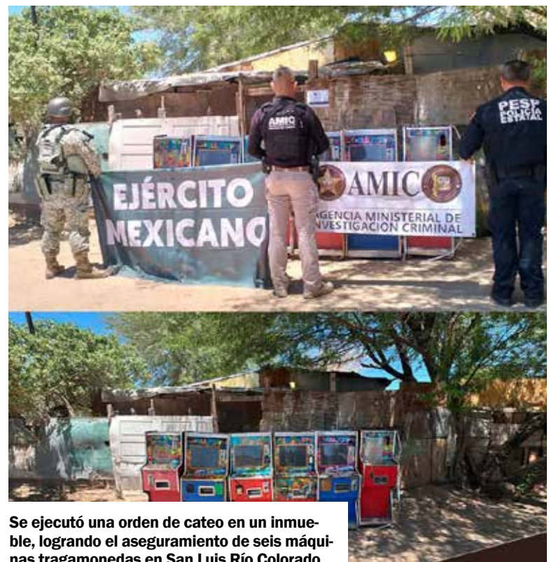
Se ejecutó una orden de cateo en un inmueble, logrando el aseguramiento de seis máquinas tragamonedas en San Luis Río Colorado.

El operativo se desarrolló de manera coordinada entre perso-