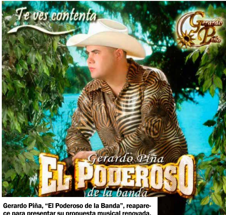
Gerardo Piña, “El Poderoso de la Banda”, reaparece para presentar su propuesta musical renovada.