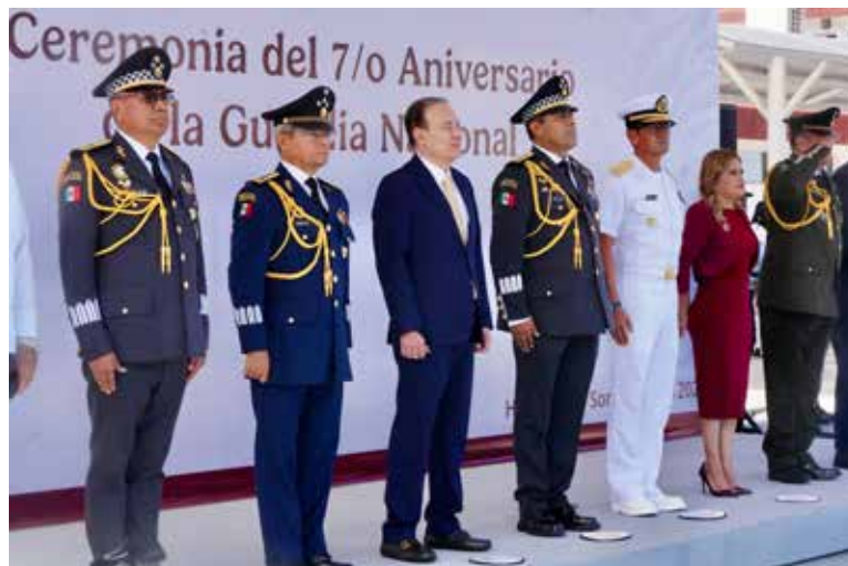
En el marco del séptimo aniversario de la corporación, el gobernador Alfonso Durazo estatal recibió un reconocimiento por su invaluable apoyo y participación activa en la creación de la Guardia Nacional.

‘Sonora se encuentra en el lugar 17 y eso no sería posible sin el respaldo de instituciones extraordinarias, el Ejército, la Marina, la Fiscalía General, pero de manera muy particular de la Guardia Na-