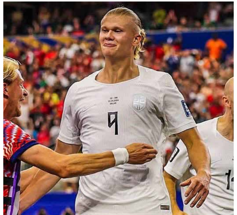
El conjunto europeo resolvió un duelo muy disputado en los minutos finales y ahora enfrentará un desafío de máxima exigencia.

Con el boleto a Octavos de Final en la bolsa, Noruega ahora tendrá una prueba de máxima exigencia cuando enfrente a Brasil, en un duelo donde buscará seguir haciendo historia y superar, por primera vez, la barrera de los Octavos de Final en una Copa del Mundo.