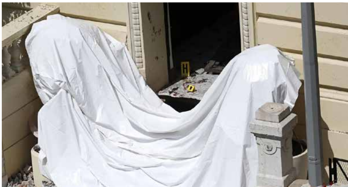
El fiscal se negó a revelar quién era el objetivo del atentado, aunque varias fuentes señalan que se trataba de un empresario ucraniano.

El artefacto explotó dejando a un hombre y una mujer gravemente heridos y a un adolescente con lesiones leves, según las autoridades monegascas.