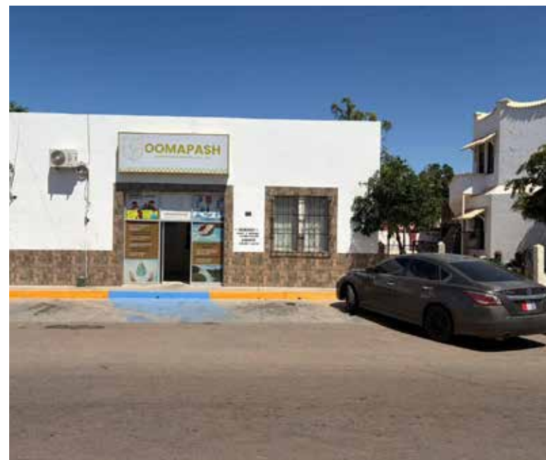
Usuarios no pudieron realizar pagos debido a la falta de sistema, mientras el organismo evitó explicar las causas del corte de energía, presuntamente relacionado con un adeudo ante la CFE.

La ironía no pasó desapercibida entre los ciudadanos: el organismo encargado de cobrar el agua terminó seco de respuestas... y sin luz para cobrar. Porque una cosa es pedirle a la población que pague puntualmente sus recibos y otra muy distinta es predicar con el ejemplo.