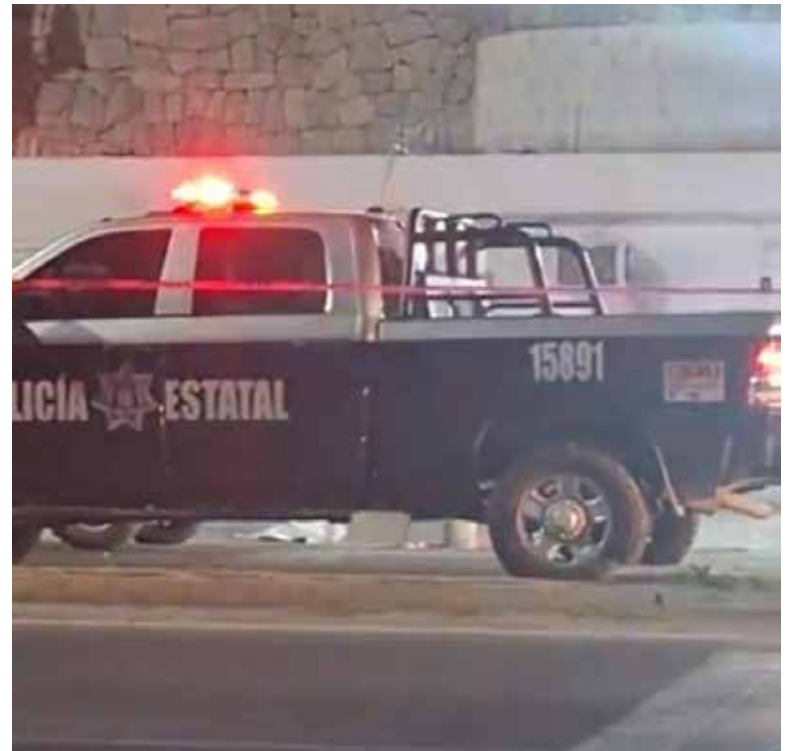
Un hombre que había recuperado su libertad apenas unos momentos antes fue asesinado la noche del lunes a las afueras del Centro de Reinserción Social (Cereso) Número 1 de Hermosillo.

Hasta el momento, la autoridad no ha emitido información oficial sobre este homicidio ni sobre el posible móvil del ataque.