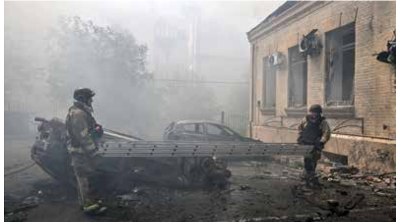
Un informe apunta a que en estos 51 meses se han superado los dos millones entre muertos y heridos de ambos bandos.

Rusia se lleva la peor parte con 1,4 millones de bajas, de las que 450.000 pueden ser muertos. Todo, en un momento en el que Putin sigue lejos de conseguir sus objetivos; sus tropas han perdido en abril y mayo más terreno del capturado en meses anteriores. Además, una ofensiva ucraniana sacude bastiones su-