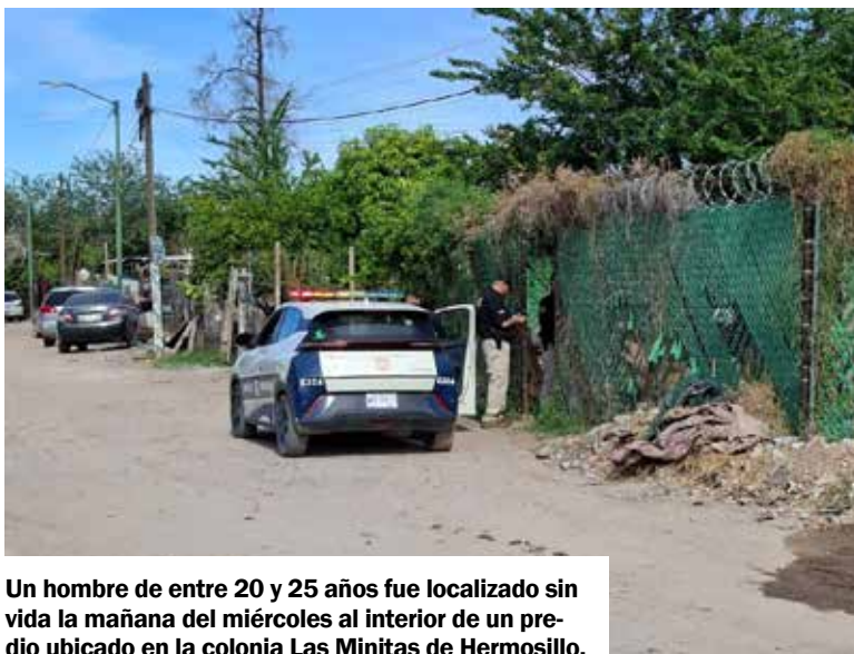
Un hombre de entre 20 y 25 años fue localizado sin vida la mañana del miércoles al interior de un predio ubicado en la colonia Las Minitas de Hermosillo.

Personal de Servicios Periciales procesó la escena y la Fiscalía General de Justicia del Estado inició las investigaciones para esclarecer los hechos e identificar oficialmente a la víctima.