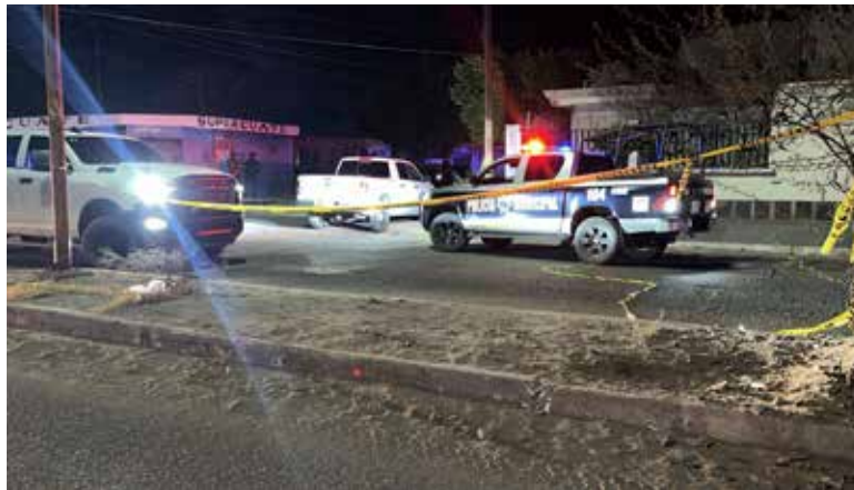
Autoridades acordonaron la zona para iniciar las investigaciones y levantar indicios balísticos.