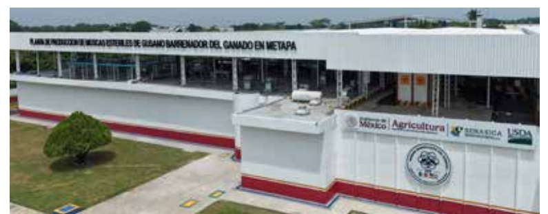
La presidenta Claudia Sheinbaum Pardo inauguró la Planta de Producción de Moscas Estériles del Gusano Barrenador del Ganado (GBG) en Metapa de Domínguez, Chiapas, una instalación estratégica binacional entre México y Estados Unidos.