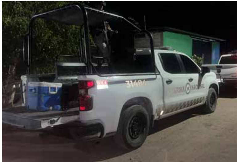
Una mujer fue asesinada a balazos la noche del martes cuando se encontraba en plena vía pública de la colonia Leandro Valle.

Al arribar al lugar, elementos policiacos localizaron a una mujer tendida sobre la calle con