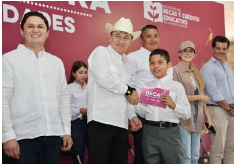
El mandatario estatal encabezó la jornada de servicios Sonora Atiende en Trincheras, con la que se busca acercar los trámites más esenciales del Gobierno de Sonora a la población de mayor vulnerabilidad de manera gratuita.

En Trincheras, el mandatario estatal, acompañado de presidentes municipales de esa región, destacó que su administración mantiene una gestión de territorio cercana a la ciudadanía. Desde el inicio de Sonora Atiende, en mayo de 2025, se han realizado más de 123 jornadas en Hermosillo y distintos municipios de la entidad, acercando de manera gratuita trámites, servicios y programas de salud, Registro Civil, vivienda, asistencia social y orientación ciudadana, para beneficiar