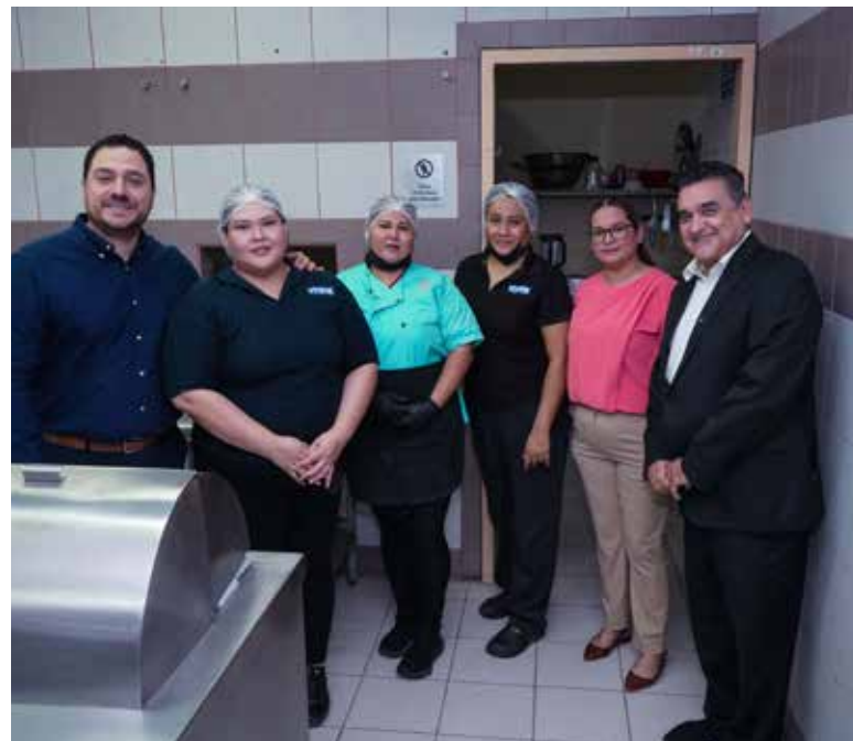
Con el compromiso de contribuir al bienestar de la comunidad estudiantil, el Instituto Tecnológico de Sonora (Itson), en colaboración con Fundación Itson, A.C. y el Patronato Itson, puso en marcha la prueba piloto del Comedor Universitario Solidario.

C IUDAD OBREGÓN. Con el compromiso de contribuir al bienestar de la comunidad estudiantil, el Instituto Tecnológico de Sonora (Itson), en colaboración con Fundación Itson, A.C. y el Patronato Itson, puso en marcha la prueba piloto del Comedor Universitario Solidario, iniciativa que inició operaciones del 29 de junio al 3 de julio en el Comedor Estudiantil, ubicado en el Pasillo de Servicios del Campus Nánari, en Unidad Obregón.