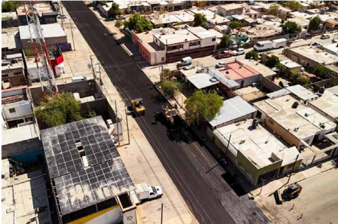
Concluyen obras del Presupuesto CRECES y continúan mejoras viales en Hermosillo: Alcalde.

El presidente municipal señaló que recientemente realizó un recorrido de supervisión por ambos sectores para constatar la conclusión de los trabajos, los cuales forman parte del esquema de participación ciudadana impulsado por el Ayuntamiento para definir