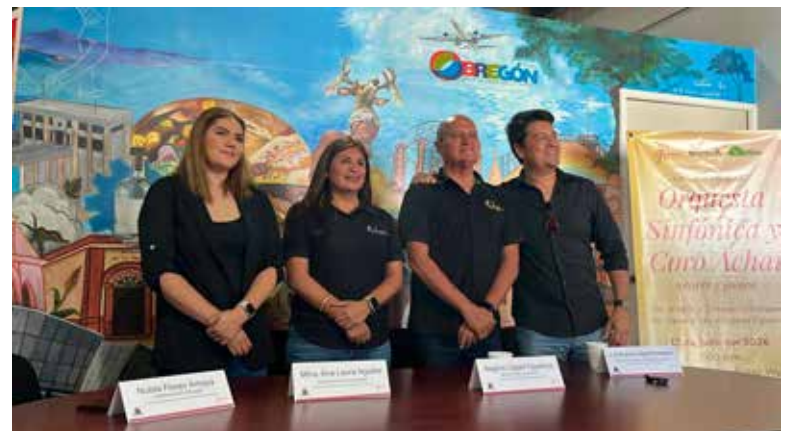
El Ballet Folklórico ACHAI buscará la certificación del Consejo Internacional de Organizaciones de Festivales de Folklore y de las Artes Tradicionales.

durante los cuales el amor por la danza, la disciplina y la dedica-