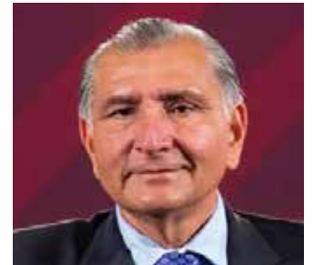
Adán Augusto López