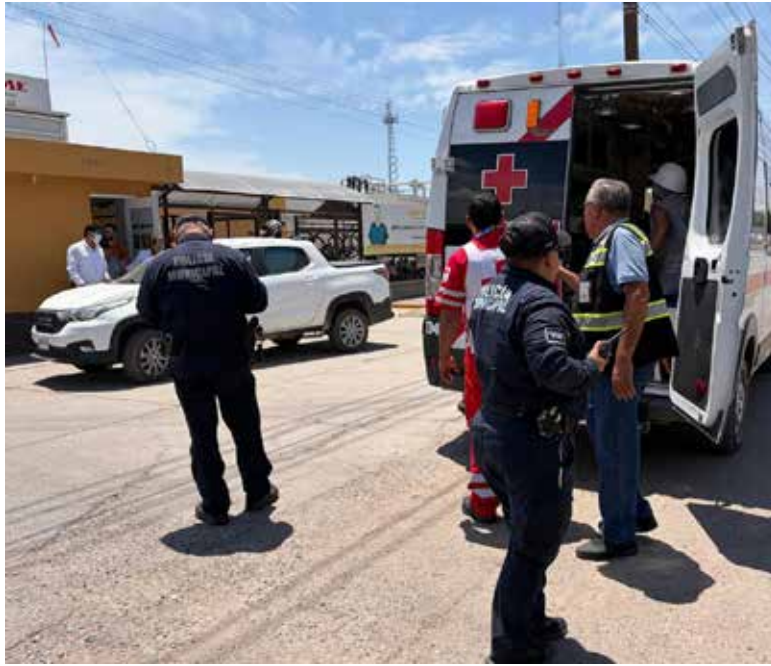
Al menos 18 trabajadores de la planta procesadora de carnes Yoreme, resultaron intoxicados al registrarse una fuga de amoniaco cerca del área de comedor.

Trascendió que al menos dos o tres de los operarios afectados perdieron el conocimiento y por ello se les trasladó con la premura del caso.