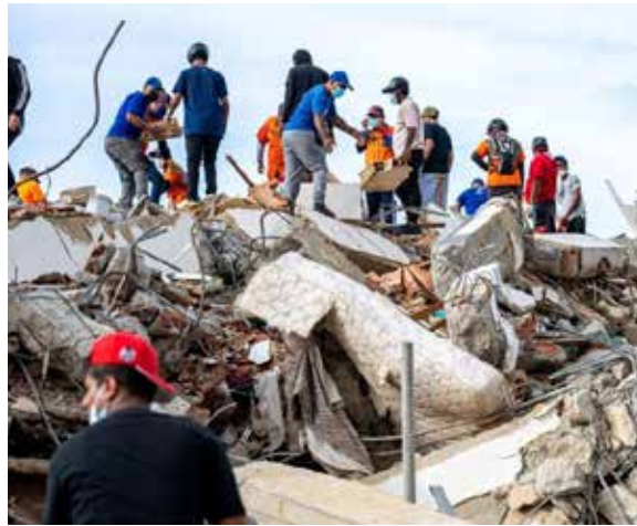
El impacto psicológico de los terremotos puede manifestarse durante un periodo prolongado, por lo que la atención emocional es uno de los ejes centrales de la intervención humanitaria.

Benes explicó que UNICEF ha instalado espacios seguros para la infancia en las zonas afectadas. Precisamente el funcionario se encontraba en uno de estos centros, creados para atender a menores que requieren apoyo especializado. “Nuestra preocupación, es realmente asegurar que los niños