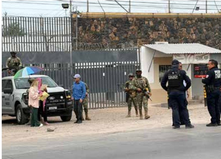
Otros cien reclusos del Centro de Reinserción Social fueron cambiados al Cereso de Guaymas para despresurizar el reclusorio local.

La maniobra tomó de sorpresa a sus seres queridos que acudie-