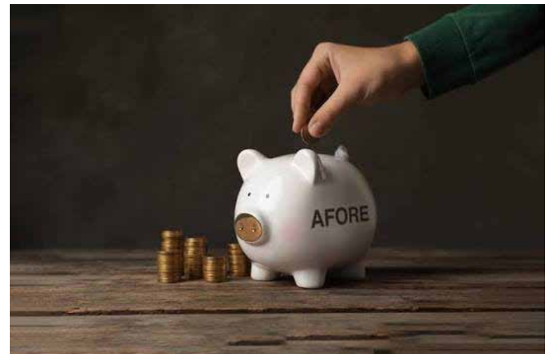
El ministro presidente de la SCJN, Hugo Aguilar Ortiz, calificó como contradictorio pretender gravar los montos de las Afores, a los que calificó como 'raquíticos', cuando hay herencias que pueden ser muy superiores y que, por ley no pagan impuestos.

La razón, de acuerdo con el comunicado, es que esos fondos integran el patrimonio formado por la persona trabajadora y su finalidad es dar protección económica a quienes fueron designadas