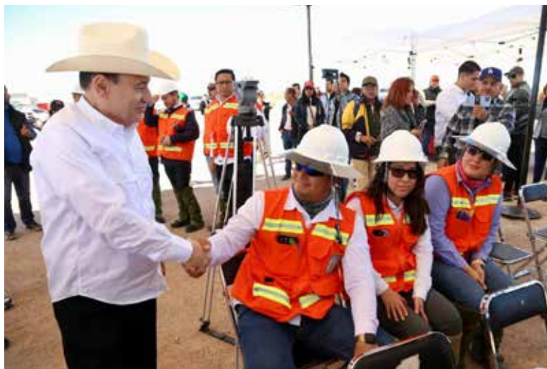
Sonora registró un crecimiento anual de 33.8 por ciento en sus exportaciones mineras durante el primer trimestre de 2026.

H ERMOSILLO. Como resultado de la estrategia de desarrollo económico impulsada por el gobernador Alfonso Durazo Montaño, Sonora registró un crecimiento anual de 33.8 por ciento en sus exportaciones mineras durante el primer trimestre de 2026, posicionando al estado dentro de las primeras cinco entidades con mayor valor aportado en este rubro, de acuerdo con cifras del Instituto Nacional de Estadística y Geografía (INEGI).