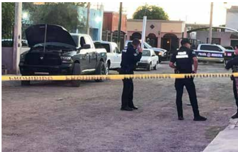
El delito de homicidio doloso en Sonora registró una reducción de enero a mayo de 2026 en comparación con el mismo periodo del año pasado.

enero y mayo de 2025 a 134 expedientes en el mismo periodo de 2026.