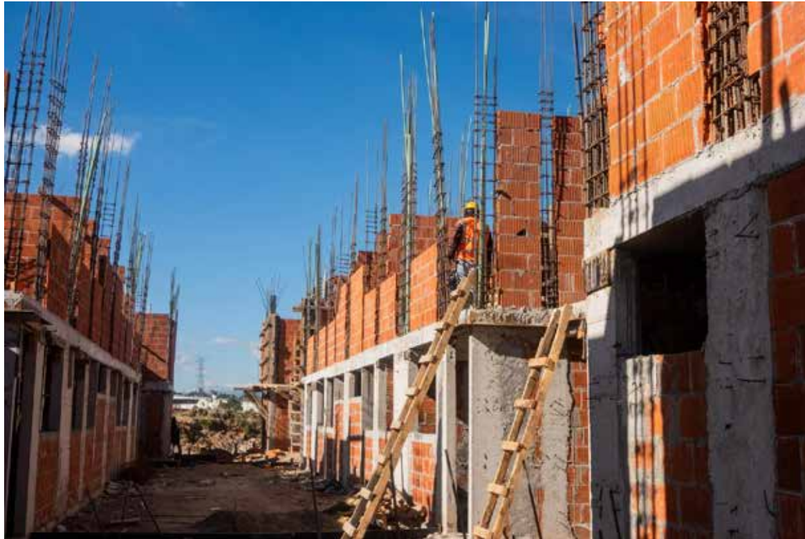
Sección 54 del SNTE lanza convocatoria de vivienda con bolsa histórica de 100 millones de pesos.

El secretario general de la organización sindical, Javier Ceballos Corral, informó que la convocatoria ya comenzó a distribuirse en los distintos planteles educativos del estado y también estará disponible en formato digital, con el propósito de que un mayor número de docentes y personal educativo pueda participar en el proceso.