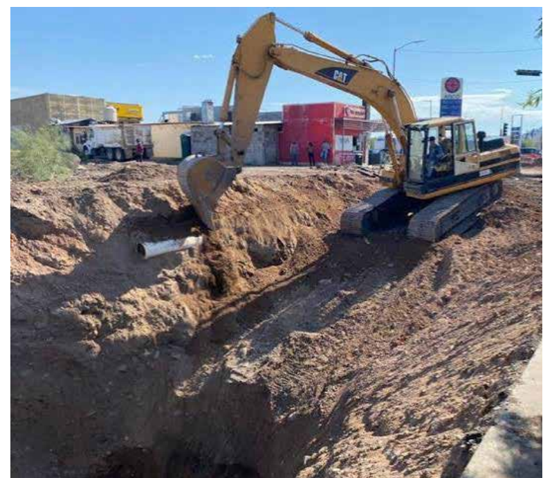
Habrà cierre parcial en bulevar Río Sonora por rehabilitación de colector sanitario.

Durante esta etapa, los vehículos que circulen en sentido