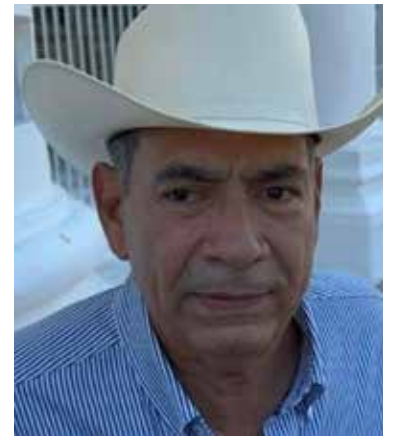
Ganaderos acumulan pérdidas millonarias por cierre de exportaciones a Estados Unidos.

ciente disponibilidad de animales en el país dificulta cada vez más su venta, por lo que llamó a las autoridades federales a reforzar los controles para la introducción de carne y ganado en pie provenientes de otras regiones, con el fin de evitar una mayor presión