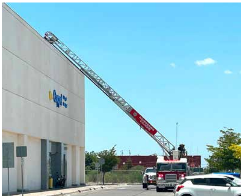
La contingencia se derivó de un derrame de gas LP en un tanque estacionario ubicado en el techo de Coppel, el cual se emplea para el sistema de emergencia de dicha tienda.

El incidente se registró alrededor de las 12:20 horas de este domingo.