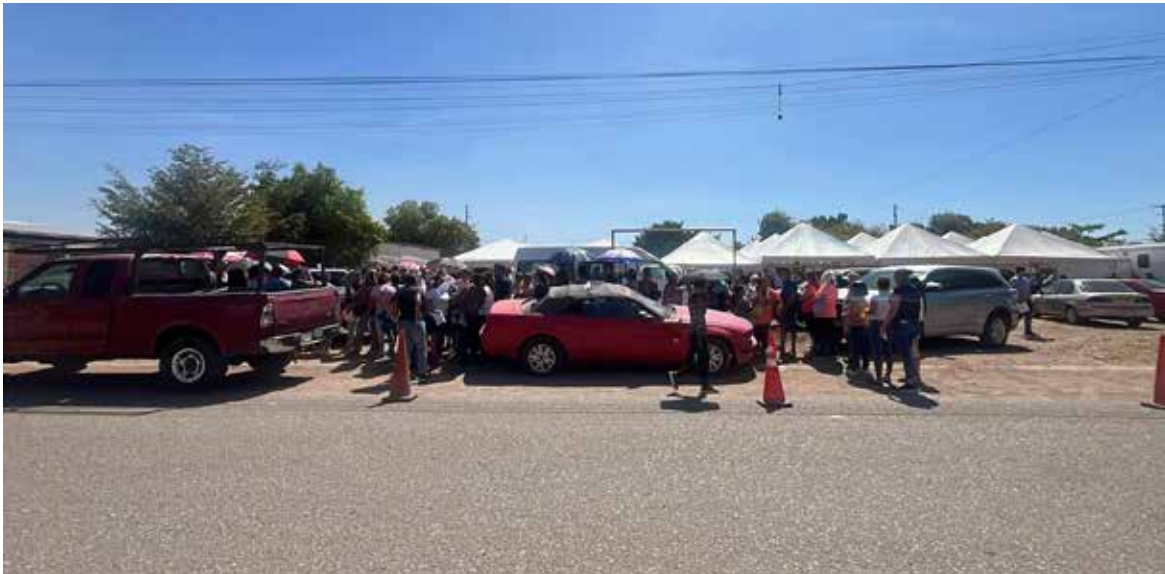
Aunque el compromiso era realizar 10 Ferias de Servicios y Atención a las Causas por año, en la práctica esa meta se ha duplicado, al llevarse a cabo 20 jornadas anuales.