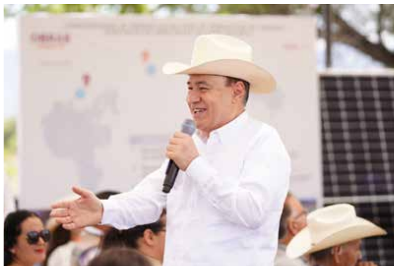
El gobernador Alfonso Durazo Montaña puso en marcha el programa Techos Solares para el Bienestar, mediante la firma de convenios de colaboración entre el Gobierno de Sonora y el Gobierno de México.

El mandatario estatal explicó que esta estrategia permitirá instalar paneles solares en viviendas de familias sonorenses, con lo que podrán disminuir hasta en un 70 por ciento el costo de su recibo de energía