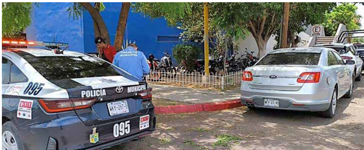
El Corralón Municipal reanudó operaciones en el predio ubicado a un costado de las instalaciones de la Secretaría de Seguridad Pública.

El presidente de la Comisión de Seguridad Pública y Tránsito,