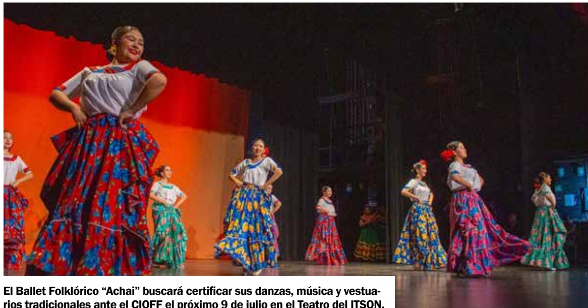
El Ballet Folklórico "Achai" buscará certificar sus danzas, música y vestuarios tradicionales ante el CIOFF el próximo 9 de julio en el Teatro del ITSON.

Lo que a mediados de los años ochenta comenzó como un sueño sembrado con profundo amor y orgullo por la identidad nacional, se ha consolidado hoy como uno de los pilares culturales y comunitarios más importantes de la región sureste del estado. La permanencia de "Achai" en los escenarios no ha sido fácil ni producto de la casualidad; es el resultado directo de la pasión, la disciplina de acero y el compromiso inque-