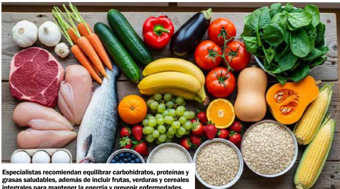
Especialistas recomiendan equilibrar carbohidratos, proteínas y grasas saludables, además de incluir frutas, verduras y cereales integrales para mantener la energía y prevenir enfermedades.

Si una persona tiene necesidades o restricciones alimentarias específicas, la recomendación es consultar a un dietista titulado. Según recoge la revista citada, ese profesional puede ofrecer pautas adaptadas para cubrir los requerimientos nutricionales sin sacrificar salud ni sabor.