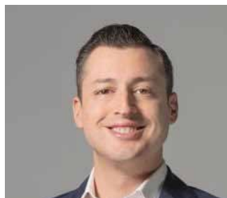
Luis Donald Colosio Riojas