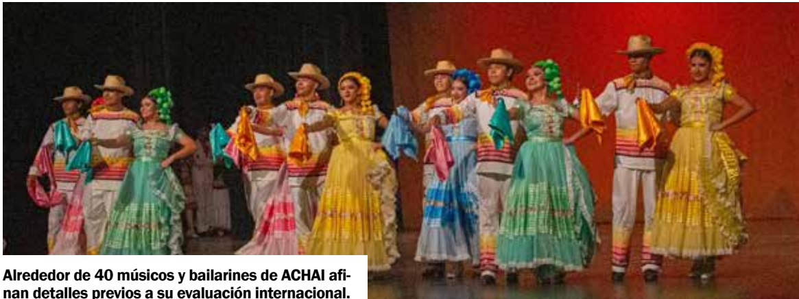
Alrededor de 40 músicos y bailarines de ACHAI afinan detalles previos a su evaluación internacional.