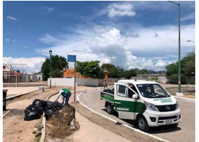
Patrulla Verde atiende 3 mil reportes al mes para combatir focos de contaminación en Hermosillo.