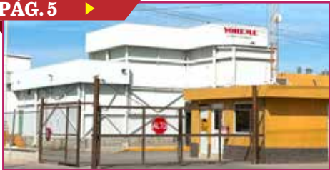
TERMINA CONTINGENCIA EN EMPRESA YOREME