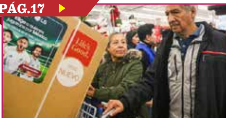
SUBE CONFIANZA DEL CONSUMIDOR EN JUNIO