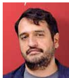
Andy López Beltrán

La discusión en la Suprema Corte de Justicia de la Nación sobre la posibilidad de gravar con Impuesto Sobre la Renta los recursos de las Afores entregados a beneficiarios de trabajadores fallecidos pone de relieve un debate de fondo entre la política tributaria y la protección del patrimonio familiar. La postura respaldada por Lenia Batres, al considerar que dichos recursos podrían tratarse como ingresos gravables, abrió una reflexión sobre la función redistributiva de los impuestos. Sin embargo, la mayoría del Pleno optó por privilegiar la naturaleza de esos fondos como parte de un derecho de seguridad social construido durante la vida laboral del trabajador. La resolución evita modificar el criterio vigente y brinda certeza jurídica a las familias que reciben estos recursos tras el fallecimiento de un ser querido. Más allá de las diferencias de interpretación, el caso demuestra la importancia de que cualquier cambio en materia fiscal considere sus implicaciones sociales, económicas y jurídicas. La protección del ahorro para el retiro y la confianza en el sistema de seguridad social son elementos fundamentales que deben equilibrarse con los principios de equidad tributaria dentro del marco constitucional.