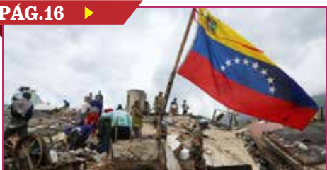
SUBE A 2,645 LA CIFRA DE MUERTOS POR LOS SISMOS