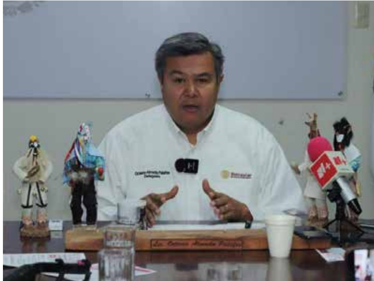
Alerta Bienestar Sonora sobre calendario falso de pagos.

danía no acudir de manera anticipada a sucursales bancarias ni realizar consultas con base en información no verificada, ya que esto únicamente provoca aglomeraciones y molestias innecesarias.