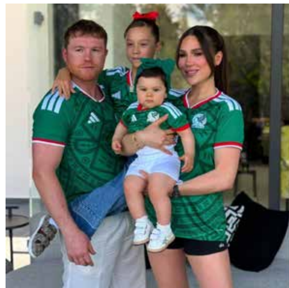
Saúl "El Canelo" Álvarez junto a su familia.

Las bellezas del pop no se quedan atrás en esta fiesta de pasión. La bellísima Belinda ha encendido las gradas luciendo un jersey personalizado con cristales y contagiando con su energía a todos los que siguen de cerca cada encuentro. Asimismo, la carismática María José "La Josa" y los chicos de "Matisse" se han sumado