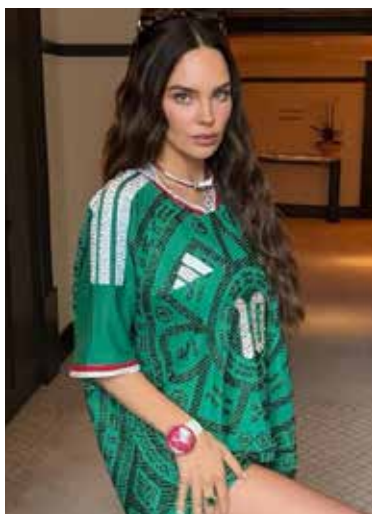
Belinda presume su camiseta de la Selección Mexicana rumbo al crucial duelo de este domingo 5 de julio.

Una enorme cantidad de músicos, cantantes, actores, influencers y creadores de contenido se han dado cita en los palcos y gradas del coloso de Santa Úrsula luciendo la camiseta tricolor y compartiendo su pasión en redes sociales, celebrando las victorias del equipo de casa. Este domingo no será la excepción; todos esperan que el equipo de México logre avanzar a los Cuartos de Final de la Copa del Mundo 2026, la mesa está puesta, las estrellas listas y el país entero unido por un mismo sueño, ¡que ruede el balón!