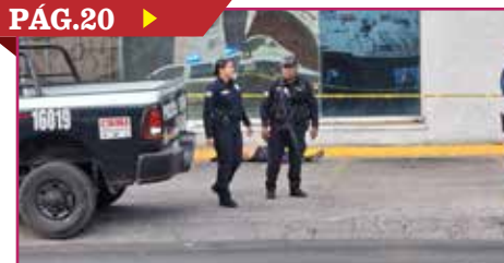
EJECUTAN A HOMBRE AL SALIR DE UN BANCO