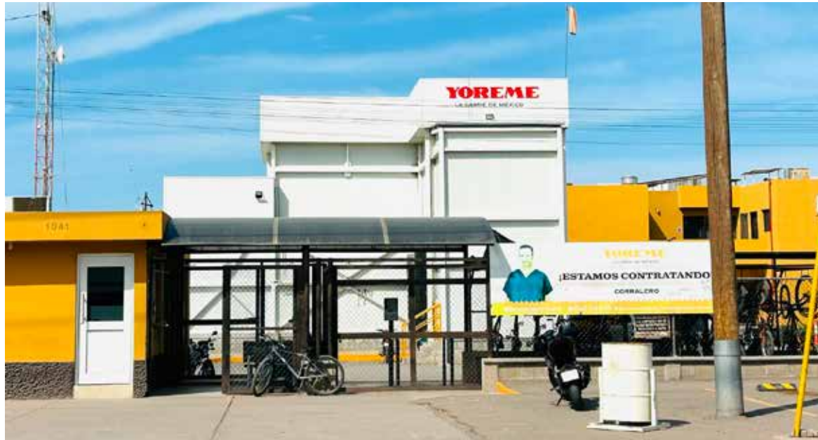
Tras ser atendida la emergencia en tiempo y forma, personal de la empresa afectada por escape de amoniaco regresó las labores, así se pudo constatar al acudir al lugar.

'Quedó suspendida y se colocaron sellos, ese mismo día en la tarde se quitaron los sellos, el día viernes se sostuvo una reunión informativa con el personal para reforzar las medidas de seguridad', informó, Francisco Mendoza Calderón, titular de protección civil municipal.