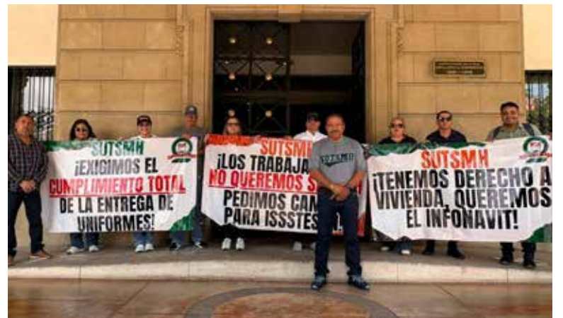
Sindicato de trabajadores municipales denuncia rezago en uniformes y cuestiona programa Salud H.

Díaz Holguín también expresó el rechazo del sindicato al programa Salud H, ya que ofrece un seguro de gastos médicos privados, mientras que los trabajadores buscan mantener una cobertura de carácter público, como la que proporciona el Isssteson.