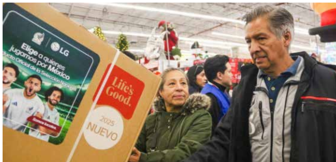
Las familias reportaron una mejor evaluación de su situación económica actual en comparación con meses previos, según datos de INEGI.

Después de que en el quinto mes el Indicador de Con-