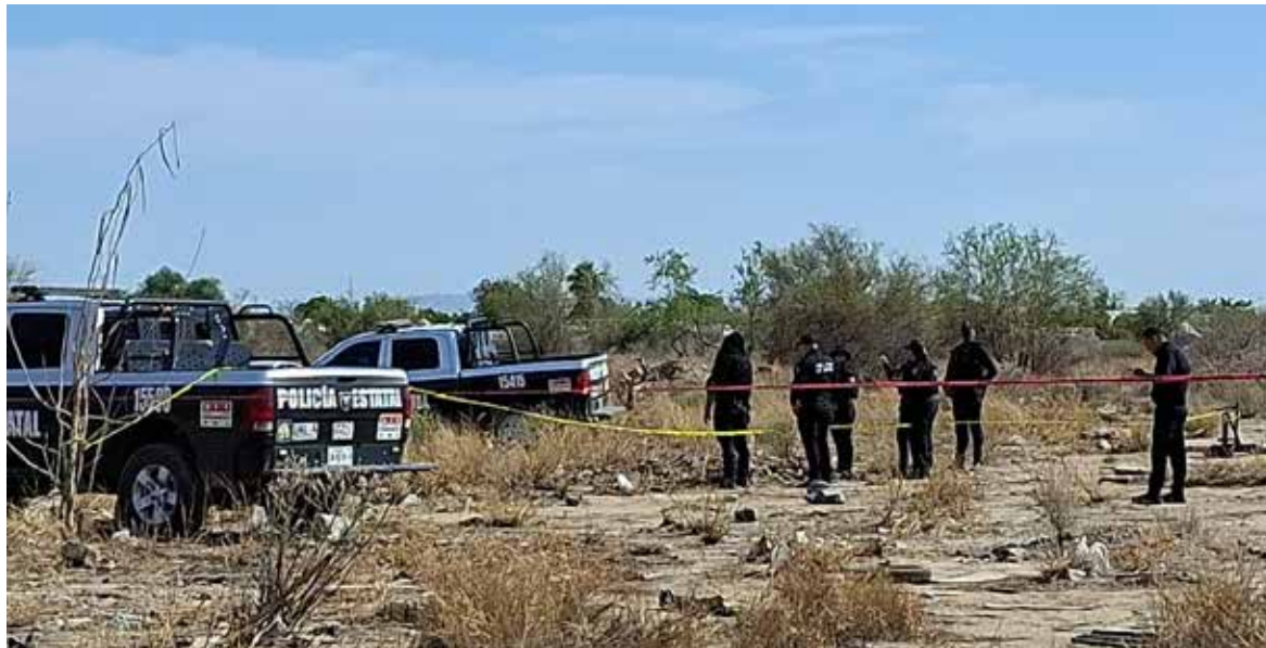
El cuerpo sin vida de un hombre fue localizado la tarde del viernes en avanzado estado de descomposición sobre una brecha de terracería conocida como camino a la mina Nico.

El hallazgo fue reportado por personas que transitaban por la zona, quienes observaron el ca-