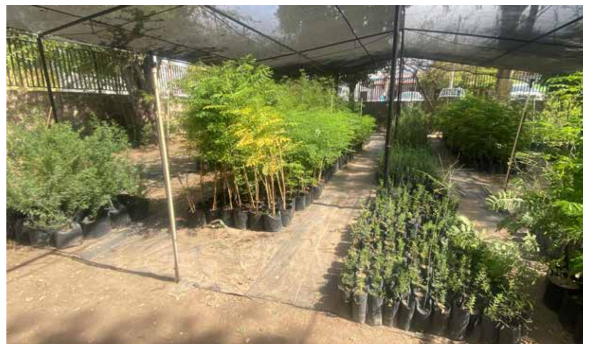
Invitan a hermosillenses a participar en jornada de donación de árboles nativos.

Señaló que el programa realiza entre dos y tres jornadas de donación cada mes; sin embar-