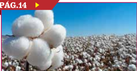
ALERTAN POR PRESENCIA DE PLAGAS EN ALGODÓN