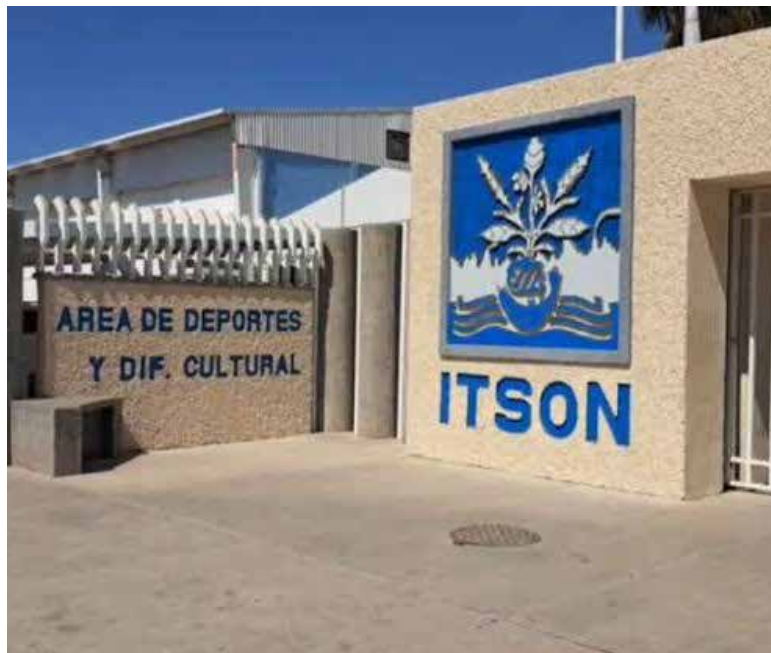
El Instituto Tecnológico de Sonora (Itson) ampliará su programa educativo con la licenciatura en Comunicación y Gestión de Medios Digitales en la Unidad Obregón.

a cerca de 3 mil 700 estudiantes, siendo carreras como Médico Veterinario Zootecnista, Enfermería y Derecho, por mencionar algunos.