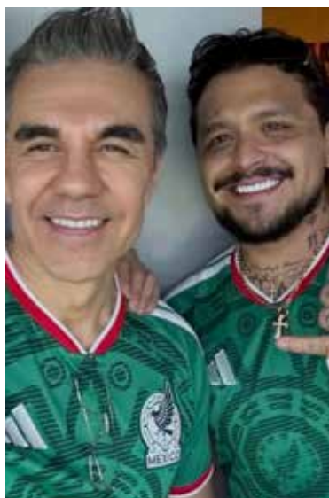
Adrián Uribe y Christian Nodal.