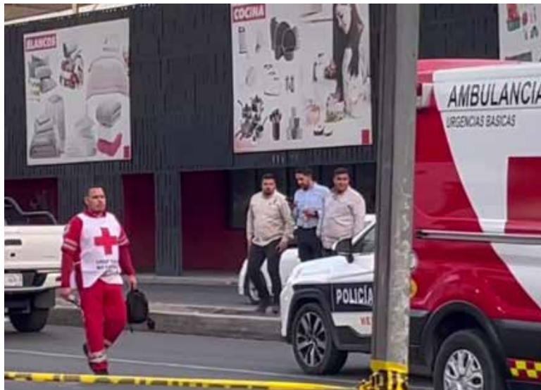
Ejecutan a custodio del Cereso 1 al salir de un banco; es el segundo ataque contra personal penitenciario en menos de 24 horas.

El presunto responsable fue descrito como un hombre que vestía camisa azul, quien tras la