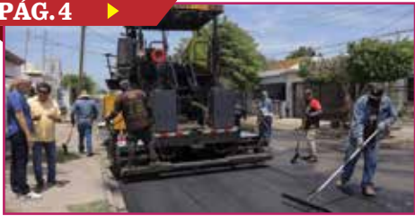
AVANZA EL RECARPETEO