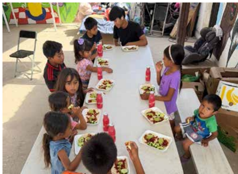
Comedor Golondrinas busca apoyo para celebrar a estudiantes graduados tras años de acompañamiento

Además, destacó que este año el Comedor Golondrinas cumple