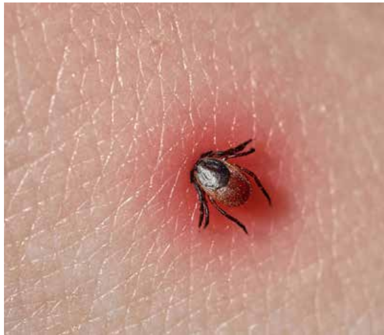
En lo que va de 2026, Cajeme ha confirmado seis casos de fiebre manchada por Rickettsia rickettsii .

En cuanto a las defunciones, Cajeme y Guaymas encabezan la estadística con seis fallecimientos cada uno, seguidos de Hermosillo con cinco, Navojoa con cuatro,