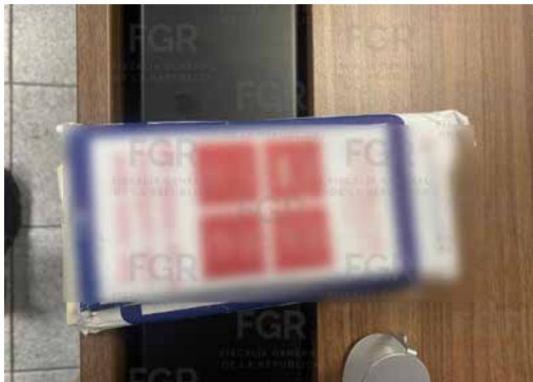
Se inició una investigación en contra de dos personas, por su probable participación en la comisión del delito de operaciones con recursos de procedencia ilícita.

Los elementos policiales marcaron el alto al conductor del autobús, y al efectuar una inspección, detuvieron a dos mujeres que habían sido descritas en la denuncia recibida, y a quienes, las autoridades les aseguraron 385 mil 400 dólares estadouni-