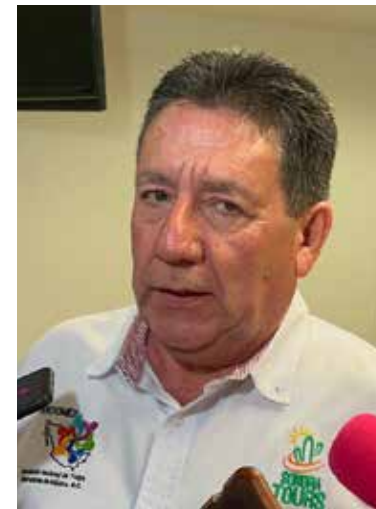
Sonora aprovechará la Serie del Caribe 2027 para impulsar sus destinos turísticos.

rísticos diarios, con recorridos de un solo día que permitan a los visitantes regresar a tiempo a