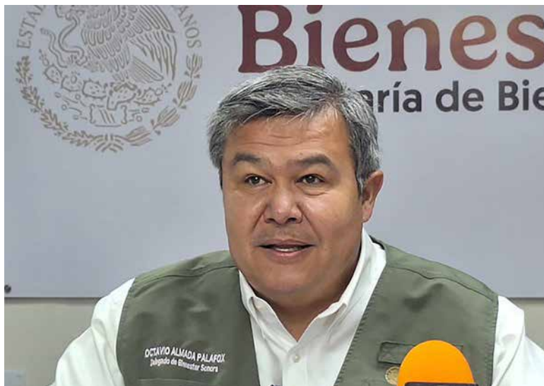
Más de 2 mil 600 millones de pesos serán dispersados en Sonora por Pensiones para el Bienestar.

Durante este bimestre se distribuirán más de 2 mil 600 millones