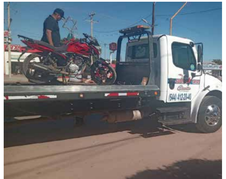
No está prohibido que los menores de edad conduzcan motocicletas, siempre y cuando respeten el Reglamento de Tránsito y lo hagan de manera responsable.

El comandante reconoció que, para muchos jóvenes, la motocicleta es una necesidad, ya que representa su principal medio de transporte para acudir a la escuela, por lo que insistió en la importancia de conducir con responsabilidad y cumplir con la ley.