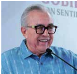
Rubén Rocha Moya