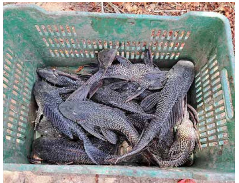
A partir de esta semana comenzará la extracción y conteo de 'pez diablo' en la Laguna del Nánari; especie invasora que el año pasado representaba cerca del 40 por ciento de la población de peces.