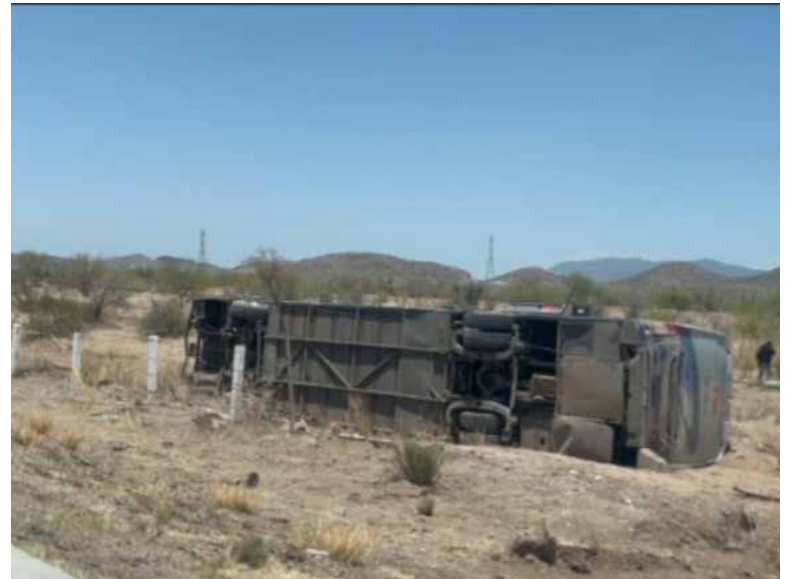
Una mujer falleció y al menos ocho personas resultaron lesionadas tras la volcadura de un autobús de pasajeros.

El oficial detalló que la víctima es, de manera preliminar, una mujer joven que quedó atrapada debajo de la unidad, por lo que será necesario utilizar equipo especializado para recuperar el