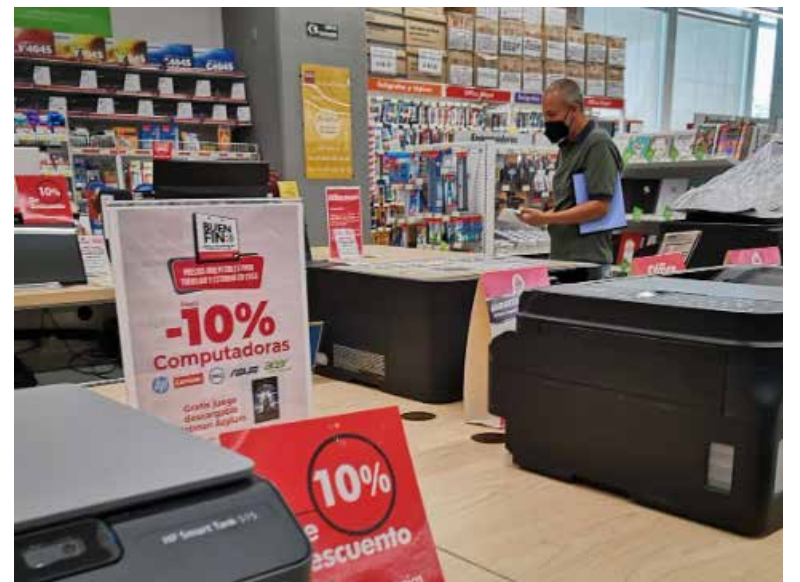
Aunque el gasto de las familias siguió creciendo, el ritmo fue más lento respecto al mes previo, de acuerdo con cifras oficiales.

Los bienes nacionales mostraron un crecimiento mensual de 1.1 por ciento y los servicios se contrajeron 0.1 por ciento y los importados 1.5 por ciento. Con respecto a abril del año pasado, los importados se dispararon 11.7 por ciento y los bienes nacionales