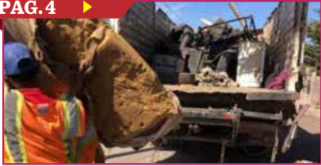
AVANZA EL DESCACHARRE