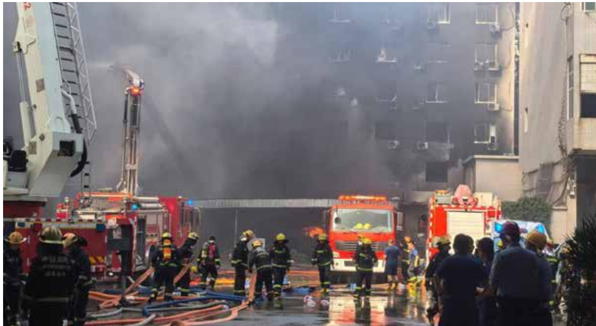
Las autoridades habían desplegado a más de 500 personas para las tareas de rescate y gestión del siniestro.

La televisión estatal CCTV indicó que una evaluación preliminar situó el origen del fuego en un taller de la primera planta, donde había materiales de calzado acumulados en los accesos de seguridad.