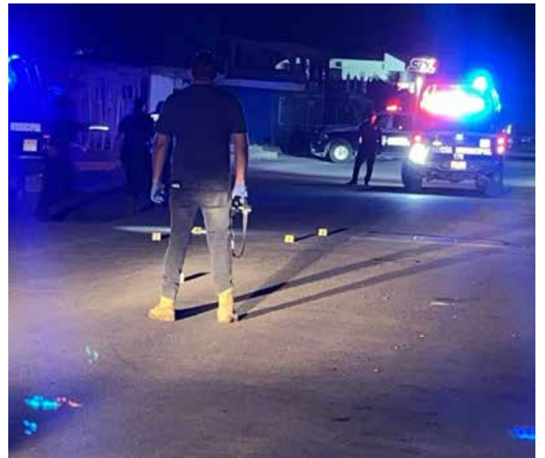
Personal investigador acudió al sitio para iniciar las diligencias correspondientes.

La zona fue acordonada mientras peritos de la Fiscalía General de Justicia del Estado realizaban