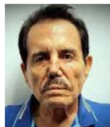
Ismael 'Mayo' Zambada

La reaparición pública de Rubén Rocha Moya, luego de semanas de especulaciones sobre su paradero, no puso fin a la controversia política, sino que abrió un nuevo capítulo de cuestionamientos entre el oficialismo y la oposición. Mientras el exgobernador aseguró permanecer en su domicilio y negó contar con protección de corporaciones federales, el PRI, a través del senador Manuel Añorve, sostuvo que la explicación resulta insuficiente y exigió aclarar tanto su situación como los señalamientos que han surgido en torno a su administración. En un ambiente de alta polarización, este tipo de acusaciones inevitablemente elevan la confrontación política, pero también hacen evidente la necesidad de que prevalezca la transparencia institucional. Más allá de los discursos partidistas, la ciudadanía espera respuestas sustentadas en hechos y, en su caso, investigaciones imparciales que permitan esclarecer cualquier señalamiento. La confianza en las instituciones no se fortalece con declaraciones encontradas, sino con información verificable, procesos legales sólidos y la aplicación de la ley sin distinciones políticas.