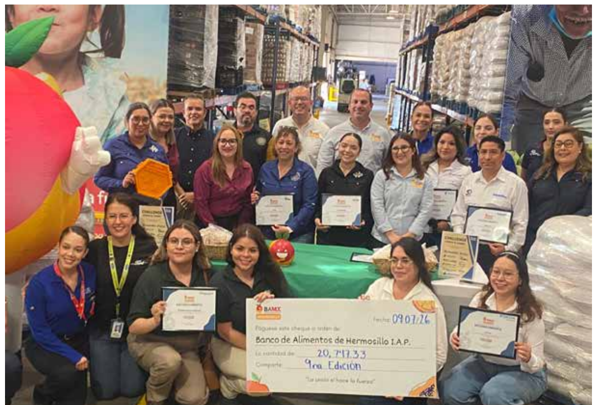
Empresas reúnen más de 20 toneladas de frijol en favor de familias vulnerables.

señalaron que este esfuerzo refleja la unión del sector productivo para atender una de las principales necesidades de la población.