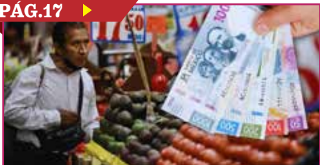
INFLACIÓN EN MÉXICO DESACELERA EN JUNIO