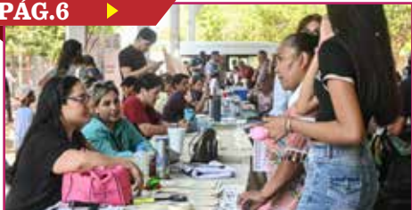
LLEVAN FERIA DE LA PAZ A PUEBLO YAQUI