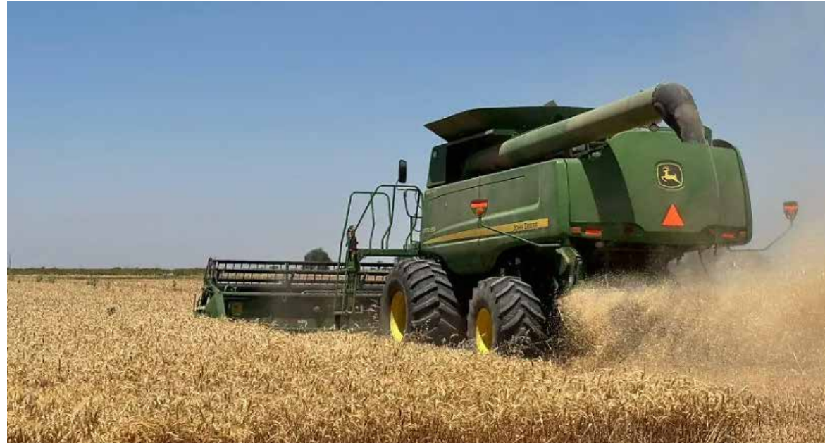
La reducción en las cosechas generó pérdidas económicas y complicaciones para cubrir compromisos adquiridos durante el ciclo agrícola.

C iudad Obregón. La producción de trigo y maíz durante el ciclo agrícola 2025-2026 cayó entre el 40 y 50 por ciento en el sur de Sonora, situación que ha impactado a los productores al quedar sin utilidades e incluso con complicaciones para cubrir sus créditos y costos de producción.