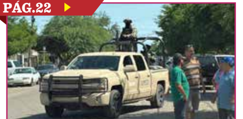
CAEN DOS SUJETOS TRAS ENFRENTAMIENTO