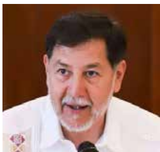
Gerardo Fernández Noroña