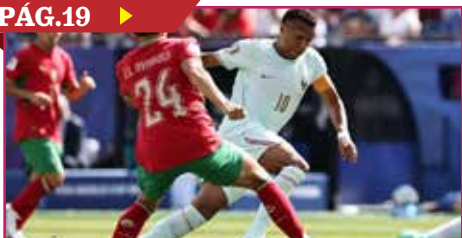
FRANCIA AVANZA A LAS SEMIFINALES