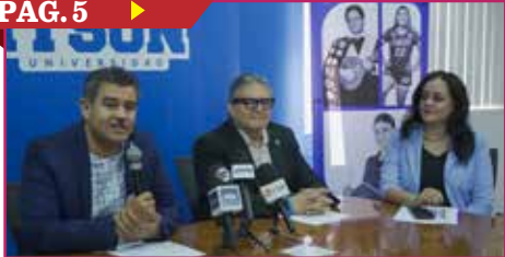
POR CERRAR EN ITSON EL PROCESO DE ADMISIÓN