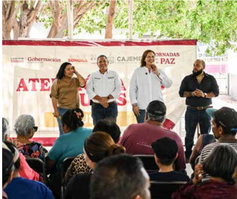
Se puso en marcha la Feria por la Paz y Jornada de Servicios, con la que se beneficiaron las familias de la Comisaría de Pueblo Yaqui y sus ocho Delegaciones.