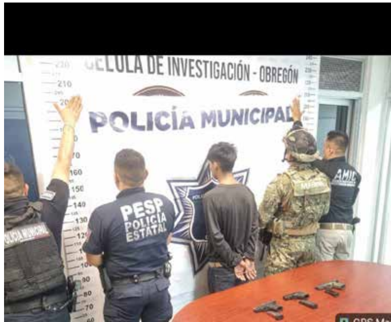
Dos presuntos sicarios cayeron en manos de policías municipales y personal de Marina al enfrentarse a balazos, luego de que se volcaron en un vehículo en plena huida, tras haber baleado a un hombre.

armas de fuego, tipo pistola y quedó pendiente de localizar una cuarta en el lugar de la detención.