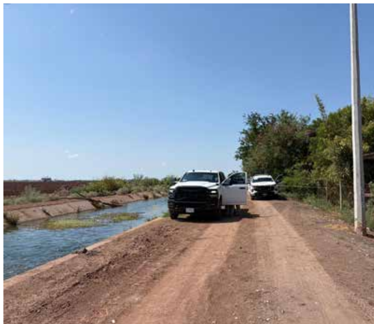
Restos calcinados de al menos una persona fueron hallados en un pozo sin agua ubicado en un predio del ejido Francisco I. Madero.

El área fue resguardada por elementos de la Policía Estatal de Seguridad Pública, Guardia Na-