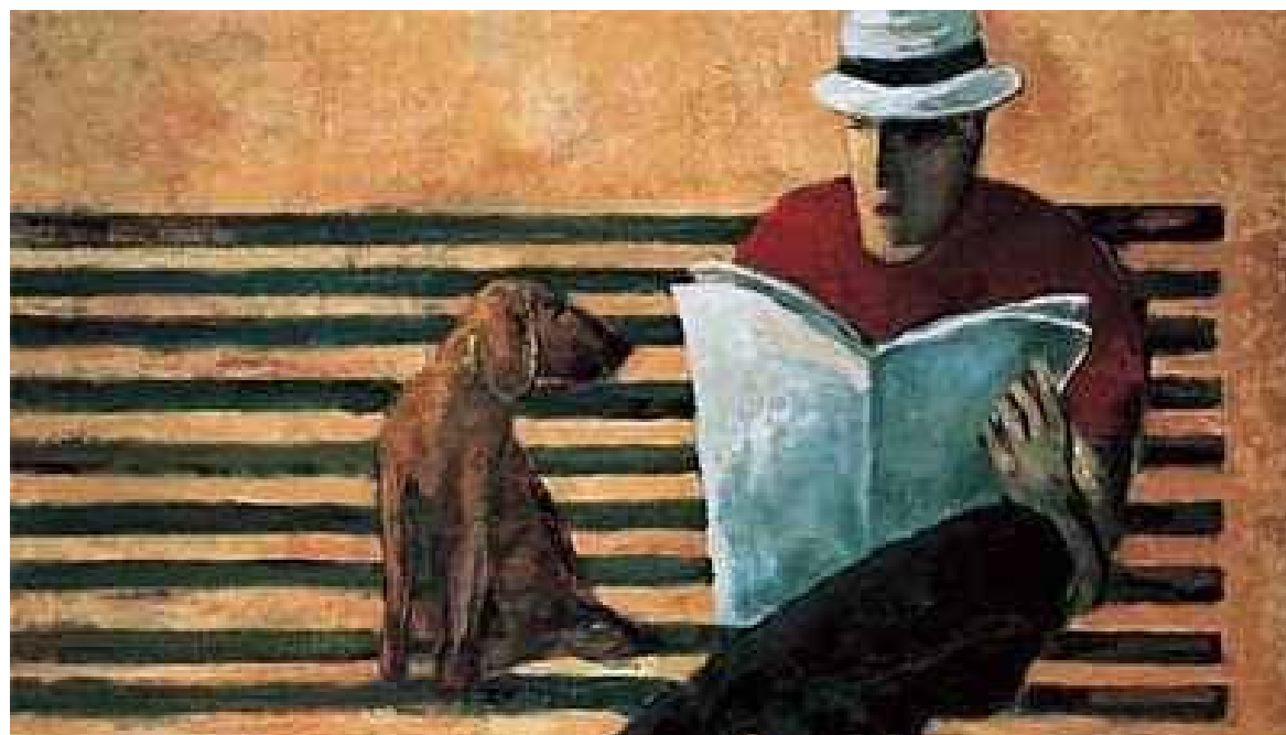
Poetas sonorenses llevarán su obra a Argentina en gira literaria.

"Entre las actividades confirmadas se encuentran una