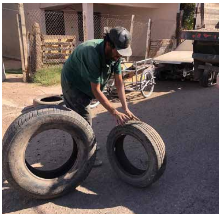
Las jornadas de descacharrización que se realizan en el municipio de Cajeme continúan reforzando las acciones de prevención contra el dengue y otras enfermedades transmitidas por el vector.

El funcionario señaló que los recorridos por distintas colonias del municipio se mantienen de manera permanente y destacó que tan solo durante la semana