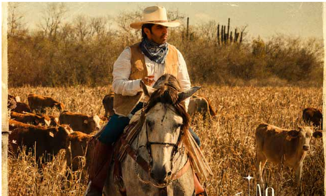
Joss Favela muestra su faceta más honesta y madura en los paisajes campiranos del videoclip de su nuevo sencillo promocional titulado “No me lo mandes decir”.