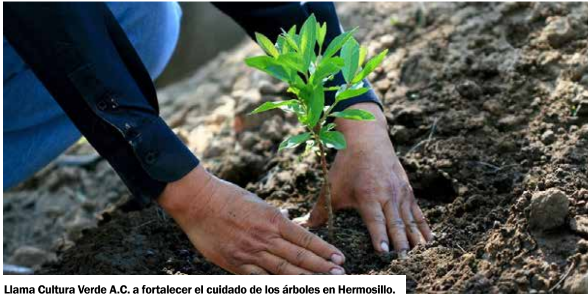
Llama Cultura Verde A.C. a fortalecer el cuidado de los árboles en Hermosillo.

HERMOSILLO. Ante las altas temperaturas que se registran en la capital sonorense y en el marco del Día del Árbol, especialistas hicieron un llamado a la ciudadanía a reforzar la cultura del cuidado y conservación del arbolado urbano, al considerar que representa una herramienta fundamental para reducir las islas de calor y mejorar la calidad de vida.