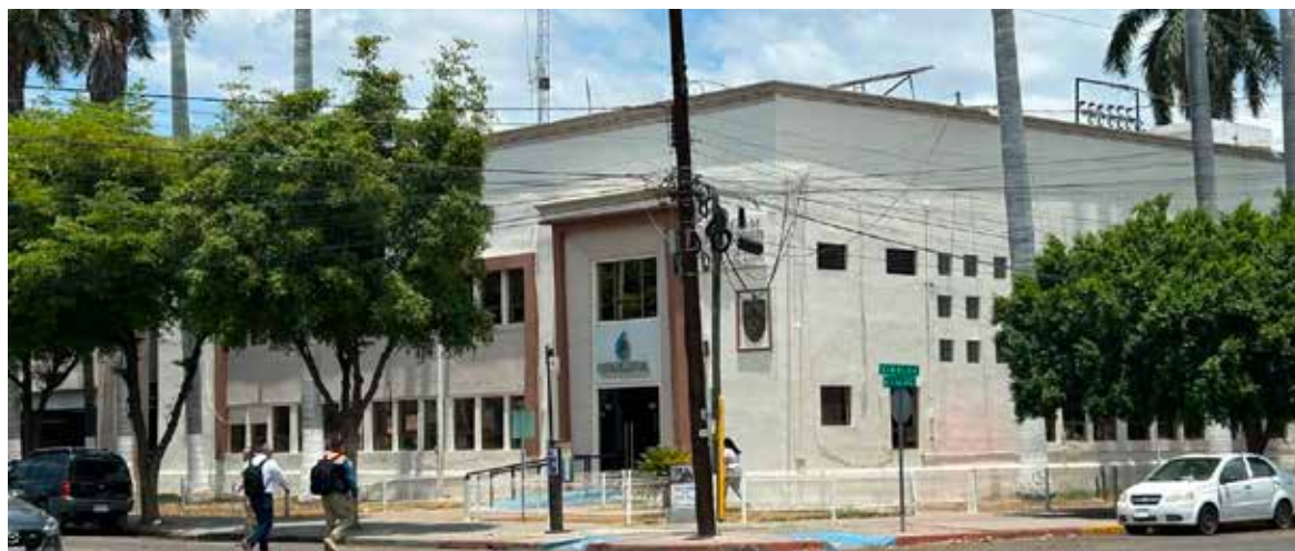
Habitantes del poblado de Buenavista acudieron a las oficinas de la Conagua, para solicitar una solución definitiva a los problemas de abastecimiento de agua potable.

A esta problemática se suma el servicio de energía eléctrica. Los vecinos señalaron que los apagones son constantes y afectan sus actividades cotidianas. Recordaron que anteriormente sostuvieron reuniones con personal de la Comisión Federal de Electricidad