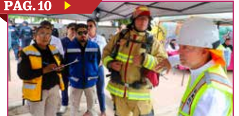
REALIZAN SIMULACRO BINACIONAL MÉXICO Y EU