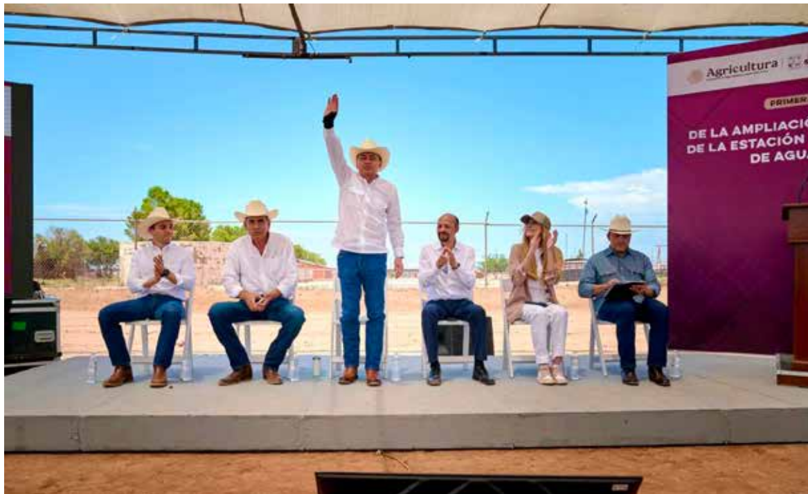
El gobernador Alfonso Durazo Montaño, con el apoyo de la presidenta Claudia Sheinbaum Pardo, puso en marcha los trabajos de ampliación de la Estación Cuarentenaria de Agua Prieta, con una inversión de 80 millones de pesos.