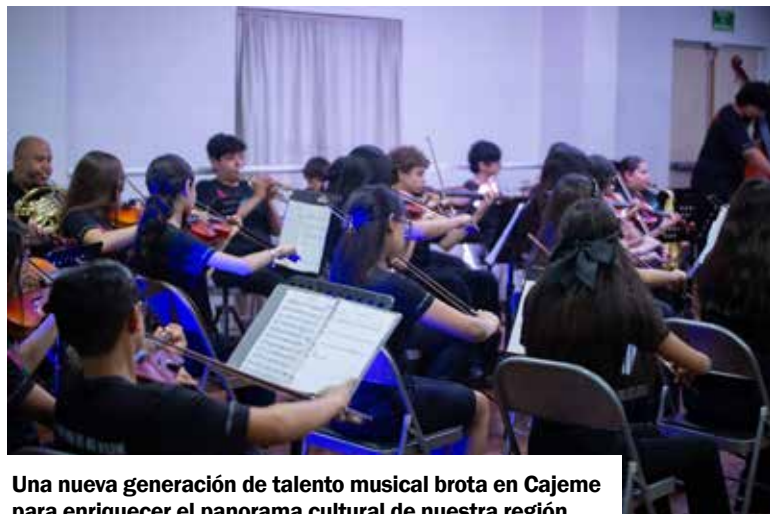
Una nueva generación de talento musical brota en Cajeme para enriquecer el panorama cultural de nuestra región.

Detrás de este concierto de gala hay una entrañable historia de esfuerzo que merece ser aplaudida de pie, un total de 56 niños y jóvenes cajemenses verán rea-