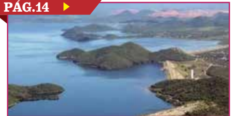
'REVIVE' PRESA EL MOCUZARIT