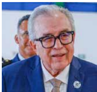
Rubén Rocha Moya