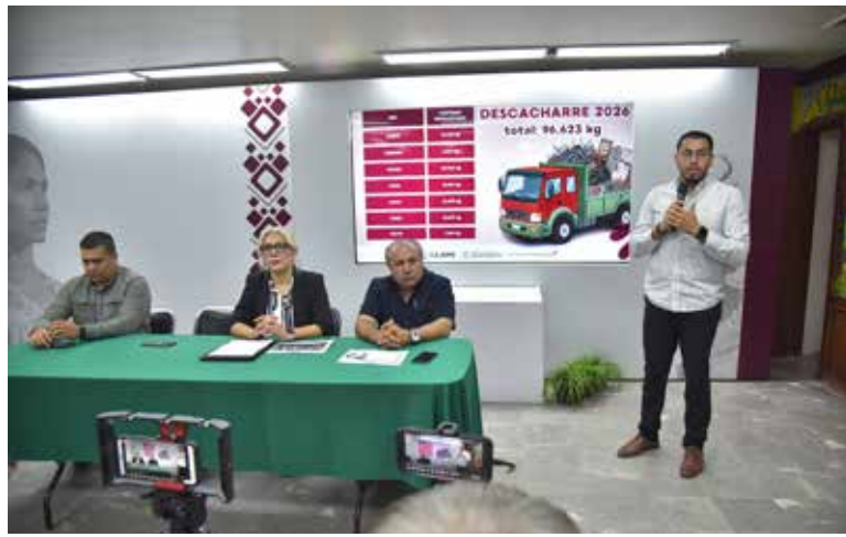
El Gobierno Municipal, a través de la Dirección de Salud, la Dirección de Gestión Ambiental para el Desarrollo Sustentable y la Unidad Municipal de Protección Civil, intensifica los programas y acciones de prevención a fin de salvaguardar la integridad de la población.

Entre estas estrategias conjuntas, destacan la campaña permanente de Limpieza y Descacharre, a través de las cuales se busca minimizar el riesgo de la propagación de enfermedades