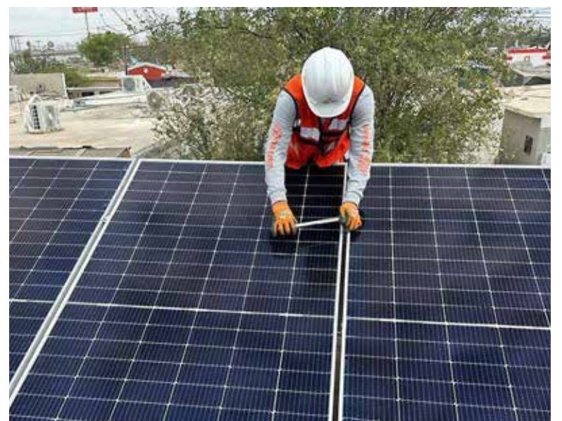
Programa Techos Solares impulsará un sistema eléctrico más eficiente en Sonora.

les durante el día la CFE ya no se la tiene que entregar a esos usuarios y la puede tener disponible para la población más vulnerable; entonces va siendo un cambio social y económico muy interesan-