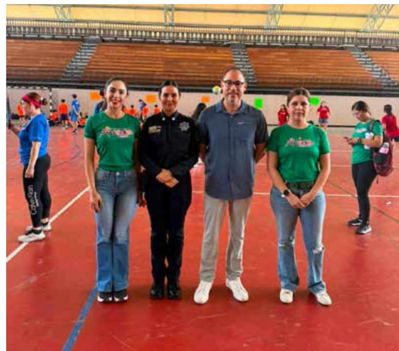
Convive Policía Estatal con niñas y niños en campamento de verano Codeson.

Estas acciones buscan fortalecer valores, generar entornos