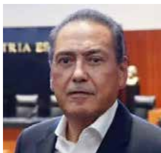
Manlio Fabio Beltrones Rivera