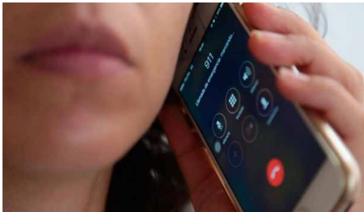
Vacaciones elevan llamadas falsas al 911 y afectan la atención de emergencias en Sonora.

La funcionaria explicó que durante las vacaciones es común que niñas, niños y adolescentes permanezcan más tiempo en