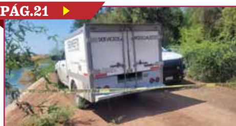
RESTOS LOCALIZADOS EN POZO SERÍAN DE MUJER