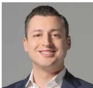
Luis Donaldo Colosio Riojas