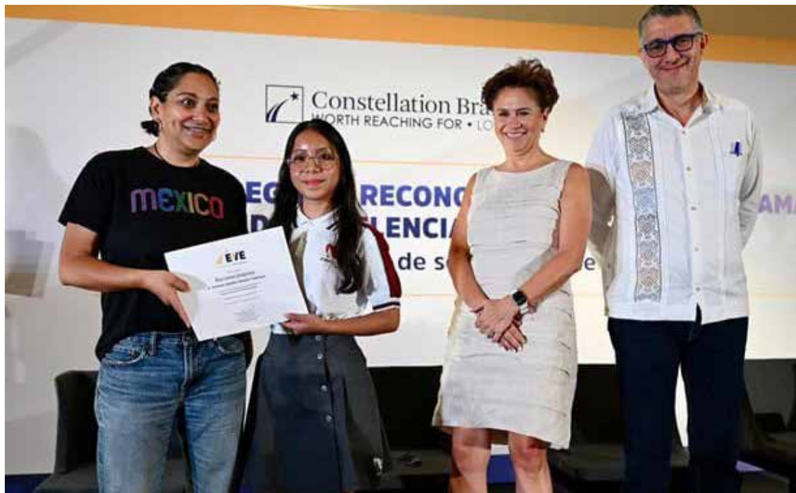
El programa de excelencia El Valor de Educar de Constellation Brands no solo brinda a jóvenes el apoyo económico para culminar sus estudios, sino también capacitaciones.

habilidades y conocimientos que permitan a los participantes contribuir de manera signi-