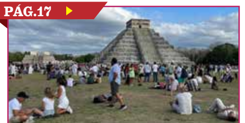
MÉXICO RECIBIÓ A MÁS DE 8.3 MILLONES DE TURISTAS