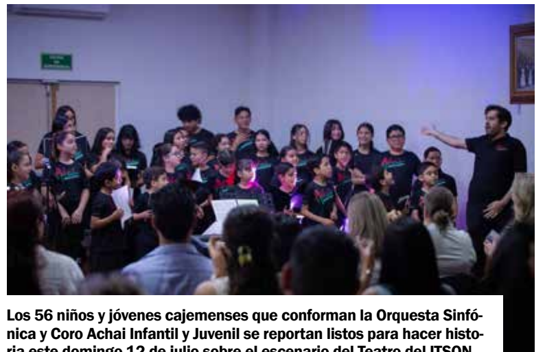
Los 56 niños y jóvenes cajemenses que conforman la Orquesta Sinfónica y Coro Achai Infantil y Juvenil se reportan listos para hacer historia este domingo 12 de julio sobre el escenario del Teatro del ITSON.