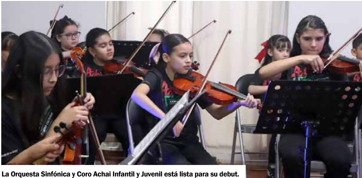
La Orquesta Sinfónica y Coro Achai Infantil y Juvenil está lista para su debut.